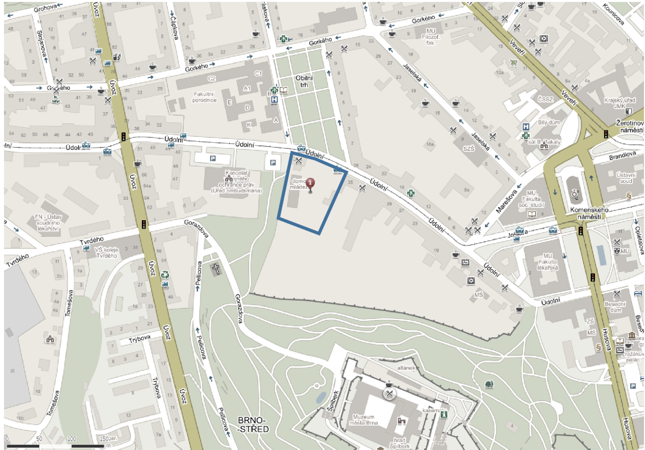
Obr. 1 – Umístění pozemku na mapě širších vztahů

Původní terén je svažitý, stoupá od severu k jihu. Při stavbě bude terén upraven pro novostavbu hudebního klubu.