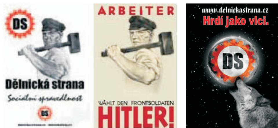
Přiloha 5: Další plakáty Dělnické strany. 5