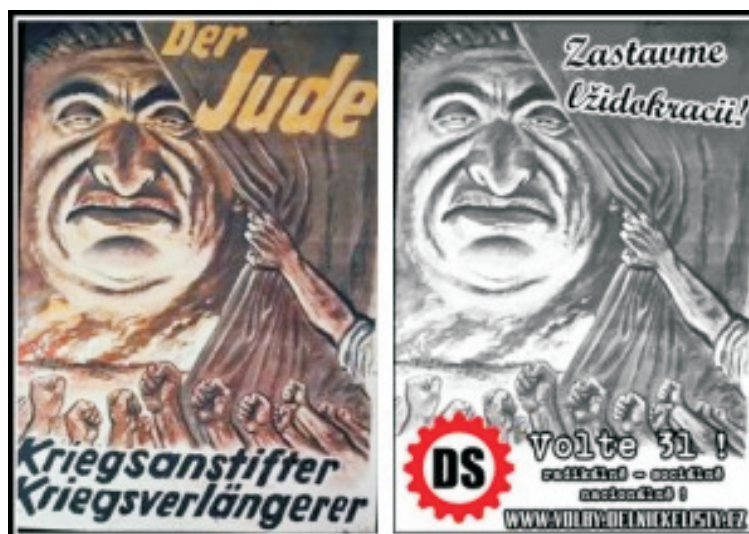
Přiloha 4: Plakát Dělnické strany, který ukazuje na propojenost s nacistickými institucemi. Jedná se o Německou pracovní frontu (DAF). 4