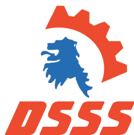
Příloha 6: Logo Dělnické strany sociální spravedlnosti. 6