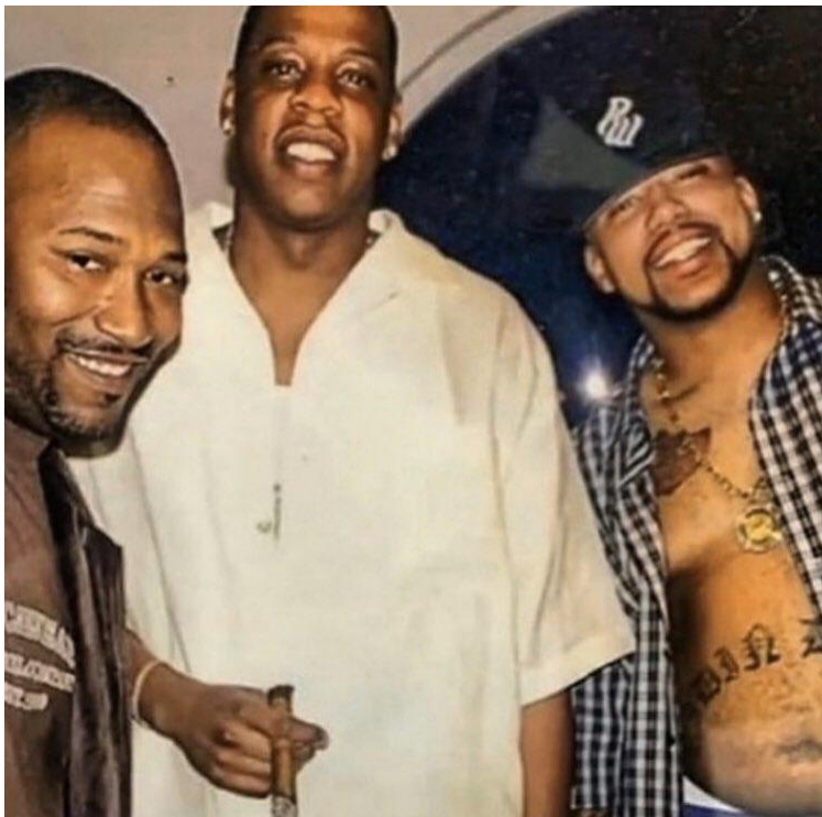
Obrázek č.2 – Zleva Bun B, Jay Z a Pimp C