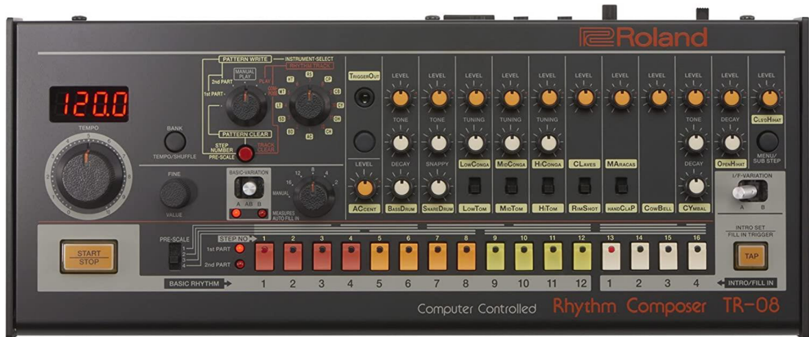
Obrázek č.1 – 808 Roland TR-808 Rhythm Composer