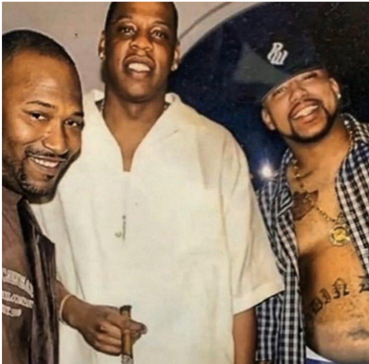
Obrázek č.2 – Zleva Bun B, Jay Z a Pimp C

Dostupné z: https://twitter.com/allinhiphop/status/1253104228375150594