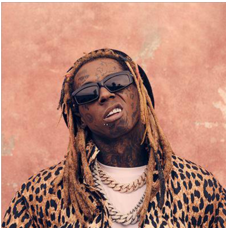
Obrázek č.3 – Lil Wayne