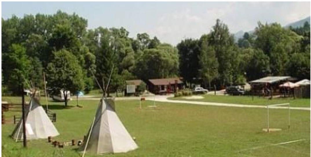
Obr.8: Green camping Slnčné skaly