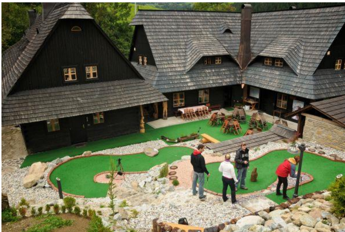
Obr.5: Jánošíkov Dvor