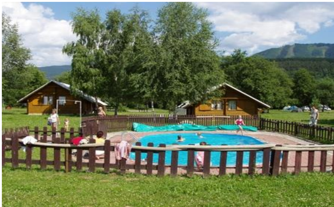
Obr.2: Autokemping Varin