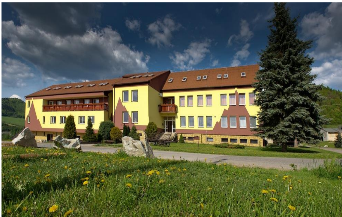
Obr.3: Agrodružstvo Dlhá