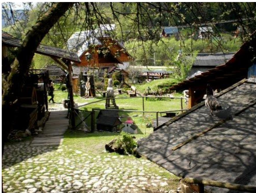
Obr.10: Ekoskanzen Lietavská Svinná