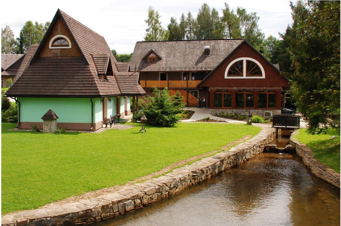
Obr.7: Oravský háj