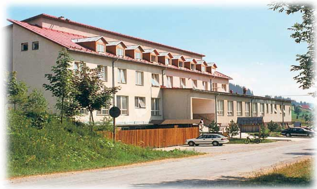
Obr.1: Agropenzión AB Novot'