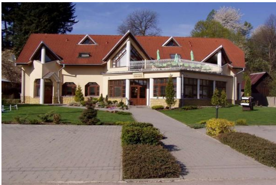
Obr.4: Agropenzión Grunt