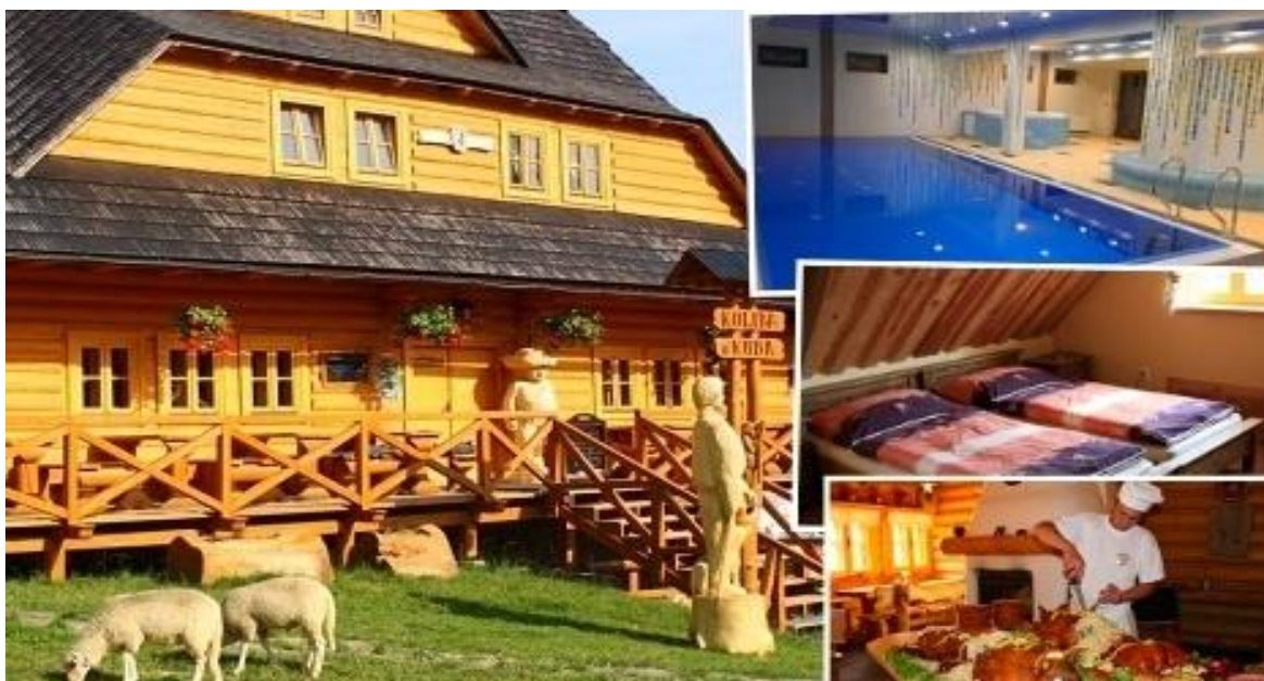
Obr.6: Koliba u Kuba