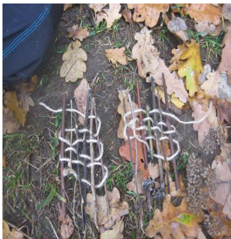
Příloha 1 Tkaní, plstění, pletení