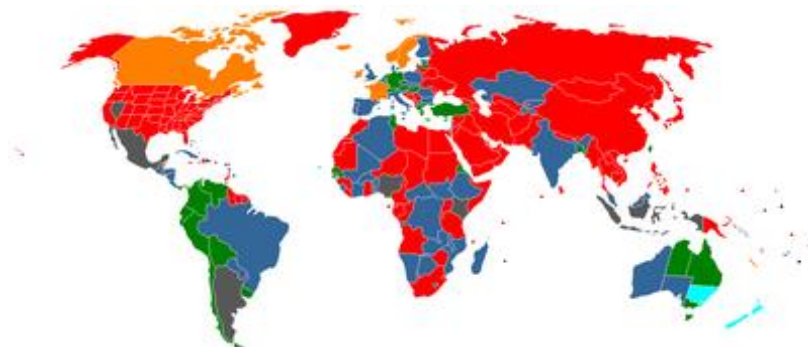
Obrázek 1: Kde je prostituce povolena a kde naopak zakázána

Jsou i země, kde ovšem prostituce je zcela legální. V Evropě k těmto státům patří například Německo či Nizozemsko, Skandinávské státy nepostihují živnost jako takovou, ale je nelegální za tuto službu platit. Ve většině západoevropských zemích pak není prostituce postihována, ale je vládami různě omezována.