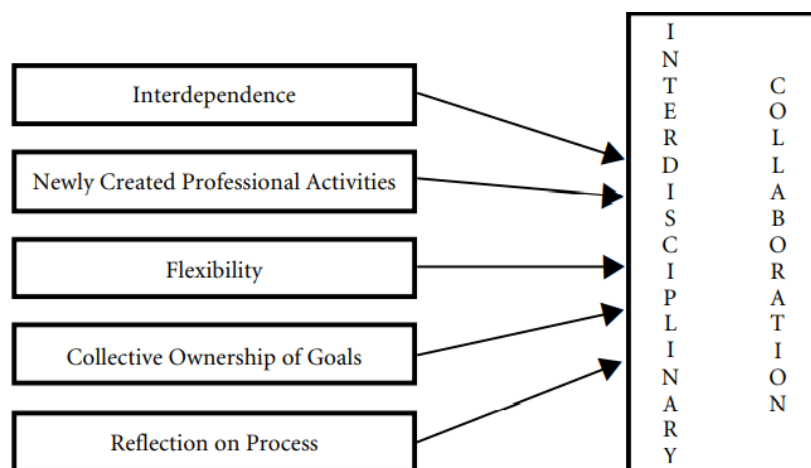
Obrázek č. 1, Komponenty modelu interdisciplinární spolupráce dle Laury Bronstein

Vzájemná závislost vede k vzájemné důvěře a zároveň závislosti jednotlivých členů na druhých při dosahování cíle. Je zde potřeba dobře rozumět rozdílů mezi vlastní rolí a rolí spolupracujících profesionálů a vhodně je využívat. Charakteristický je společně trávený čas, formálně i neformálně, psaná i nepsaná komunikace mezi členy týmu a respekt k profesionálnímu pohledu, názorům a vstupům ostatních odborníků v týmu. (Bronstein, 2003, s. 299).