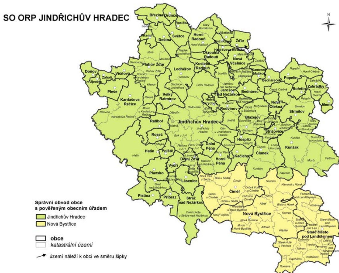
Obrázek. č 1 Správní obvod Jindřichův Hradec 114