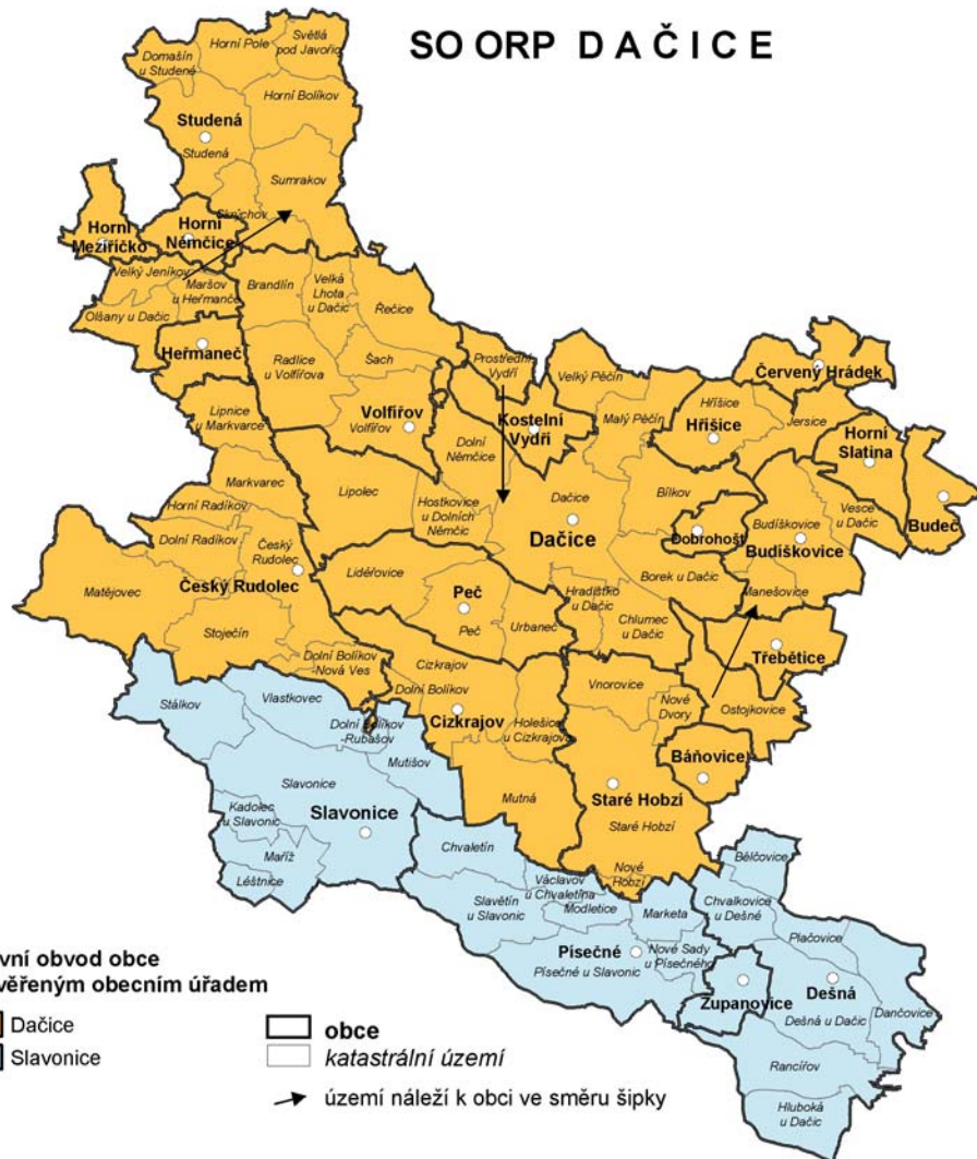
Obrázek č.2 Správní obvod Dačice 115