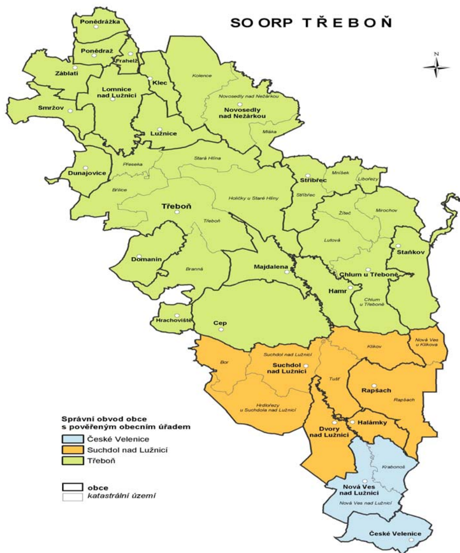
Obrázek č.3 Správni obvod Třeboň 116