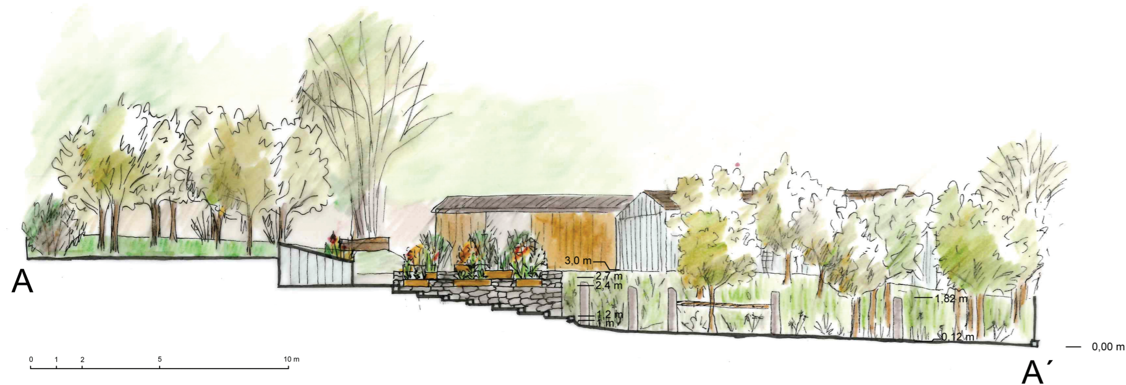
Řezopohled A - A'