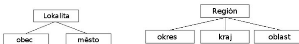
Schéma ukazuje, že lokální média se týkají jednoho územního celku – obce, či města. Na druhé straně ty regionální berou v potaz větší územní (a tedy i větší územní zásah) celek složený z většího množství subjektů – dělí se na okresní, krajské a oblastní média.

Obr. 1: Vymezení lokality a regionu podle Tušera. Zdroj: Tušer 1995: 8.