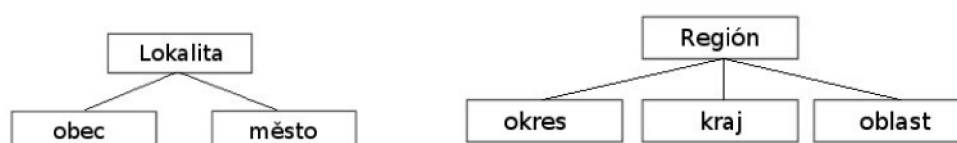
Obr. 1: Vymezení lokality a regionu podle Tušera.

Schéma ukazuje, že lokální média se týkají jednoho územního celku – obce, či města. Na druhé straně ty regionální berou v potaz větší územní (a tedy i větší územní zásah) celek složený z většího množství subjektů – dělí se na okresní, krajské a oblastní média.