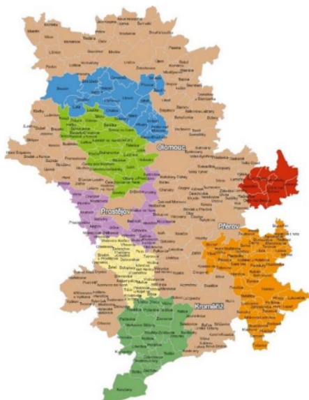
Obrázek 1: Mapa regionu Haná

Region Hané se nachází ve střední části Moravy, a to v kraji Olomouckém a Zlínském. Tato oblast je pak vymezena městy Olomouc, Kroměříž, Prostějov či Přerov. Protéká zde řeka Morava, která pramení v Jeseníkách. Dominantou tohoto regionu je Hornomoravský úval rozprostírající se mezi městem Zábřeh a Otrokovicemi, jež leží v oblasti jižní Hané. Mezi další dominantu regionu Hané zařazujeme také Litenčickou pahorkatinu. Ta se nachází v okrese Kroměříž. (Vencálek, 1997)