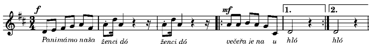
Obrázek 9: notový zápis Panímámo naša (vlastní zpracování)