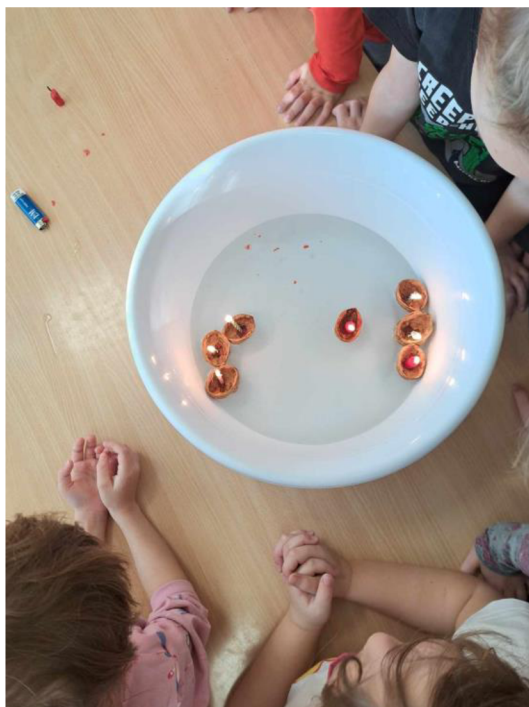
Příloha č. 2: ukázka pouštění lodiček ve skořápce