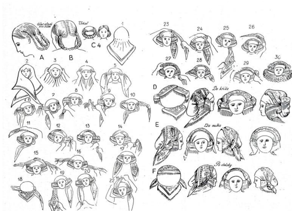
195.—236. Vázání šátků. Krojová oblast: západ Stínava, východ Dřevohostice, sever Loštice, jih Nezamyslice.

Na Hané je i dětský kroj, který má ovšem spíše historickou tradici. Novorozeně mělo košili, jež byla dlouhá a sahala až po kotníky. V zimě byla doplněna kabátkem nesoucí modrou barvu. Hlava je zdobena čepičkou. Křestní čepičky pak byly mnohem bohatěji zdobené a byly doplněny pentlí. (Bečák, 1941)