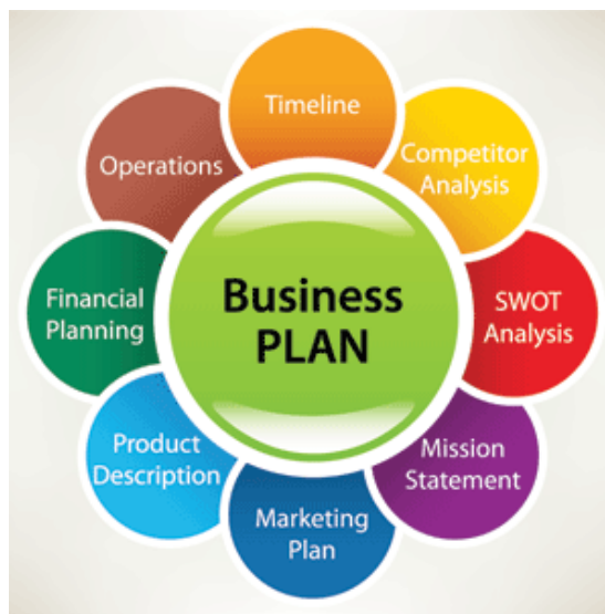
Obrázek 1: Podnikatelský plán (Djobey Consulting Corporation, ©2013)

Jedná se například o výpis z obchodního nebo živnostenského rejstříku, výkresy produktů, výsledky průzkumů trhu, výsledky propagačních akcí, zprávy a články z novin a časopisů o produktech na trhu, technologické schéma výroby, účetní výkazy, reference, důležité smlouvy, získané certifikáty aj. (Veber a Srpová 2012).