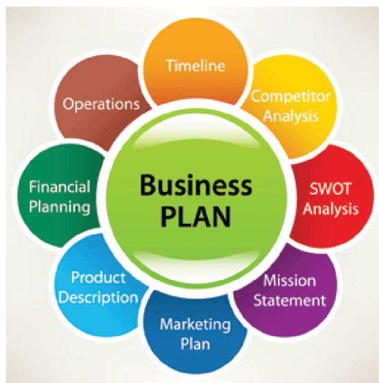
Obrázek 1: Podnikatelský plán (Djobey Consulting Corporation, ©2013)

Jedná se například o výpis z obchodního nebo živnostenského rejstříku, výkresy produktů, výsledky průzkumů trhu, výsledky propagačních akcí, zprávy a články z novin a časopisů o produktech na trhu, technologické schéma výroby, účetní výkazy, reference, důležité smlouvy, získané certifikáty aj. (Veber a Srpová 2012).