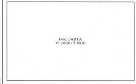
Zařízení stavěné nepřítelů ležnou vichřice. Jako karty rozházela montovaný domek, který zrovna musela postavit parťá stavbyvedoucího Marceňka z Právnímých zavěš. Zlá.