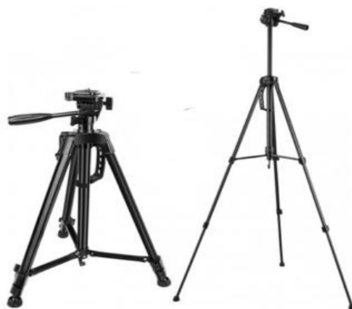
Obrázek 1: Rozložitelný stativ