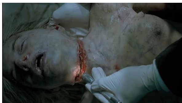
Obrázek 32: Mrtvola anglické turistky

Film vypráví o pátrání po vrahovi známém jako Karetní hráč. Pomocí webové kamery se maniak spojuje s policejní stanicí, kde pracuje Anna Mari (Stefania Rocca). Online vrah nutí policisty hrát internetový poker. Pokud policisté prohrají, bude mučit a pak zabije unesenou ženu. První zabitou obětí se stává britská turistka, proto detektiv z Anglie John Brennan (Liam Cunningham) dostává případ na starost a přijíždí do Říma. Společně se Anna a John snaží maniaka najít. Nicméně John zachytí stopu, jež ho dovede na místo zločinu jako prvního, a zmizí. Během hledání Johna se Anna stává rukojmím maniaka, kterým je její kolega policista.