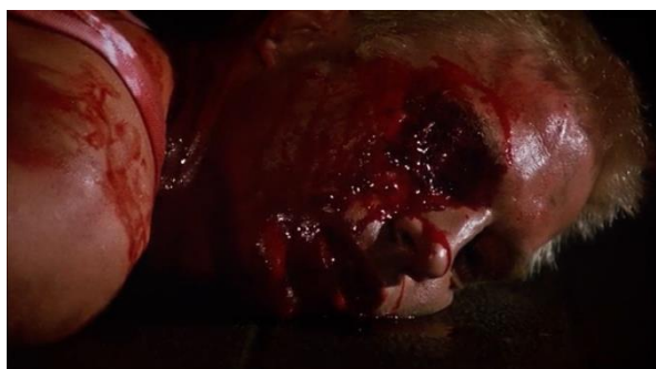
Obrázek 27: Alfredovo zranění

Poté je uvedena scéna únosu Anny Manni a jejího druhého sexuálního zneužití. Během samotné scény znásilnění Argento střídá subjektivní kameru a pohled maniaka na oběť (a na detail její tváře, aby dal lépe najevo emotivní stav, jenž