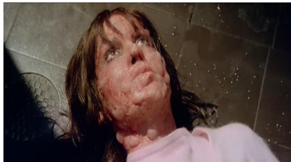
Obrázek 15: Mrtvola druhé oběti ve filmu Tmavě červená

Když se postava Amandy otočí a dívá se přímo na diváka, Argento detailně ukazuje újmy způsobené vrahem – oděrky, zlomený nos a kapky krve na tváři oběti. Vrcholem výše zmíněné scény je utopení ženské