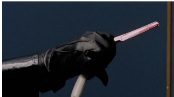
Obrázek 8: Záběr vražedného nástroje ze scény zabití páté oběti

nože a pak zakrvavená podlaha výtahu [Obrázek 8].