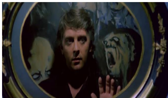
Obrázek 12: Vzpomínka na vraha v zrcadle

Po výše zmíněných událostech si Marcus, procházející se po náměstí, kde kdysi mluvil s Carlem, uvědomuje, že Carlo byl během zavraždění Helgy s ním, a dospívá k závěru, že Carlo měl spolupachatele. To přivádí pianistu