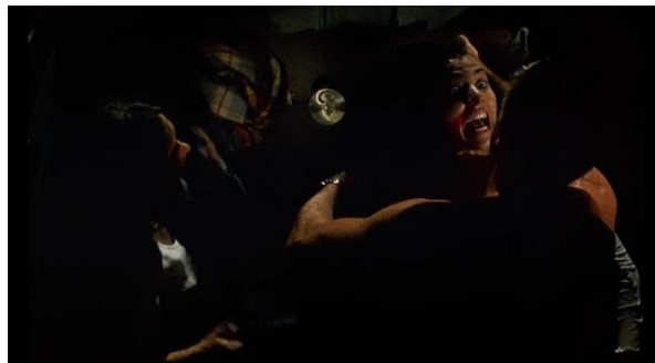
Obrázek 24: Záběr znásilnění neznámé ženy v autě

Je nutné zmínit, že z valné části je scéna samotného znásilnění předvedena pomocí subjektivní kamery ze strany hlavní ženské postavy. Režisér jen zřídka proměňuje rakurs na velký detail tváře Manni, aby zesílil pocit úzkosti. Scéna končí