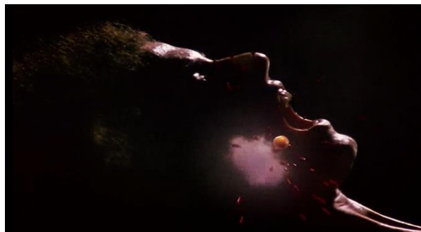
Obrázek 25: Slowmotion scény zabíjení neznámé ženy pomocí počítačové grafiky

zatemnívačkou společně s tím, jak hlavní ženská postava upadá do bezvědomí. Hned poté Argento uvádí scénu znásilnění neznámé ženy v autě, při němž Anna Manni nabývá vědomí. Režisér znovu uvádí záběr shora, aby ukázal prostředí, ve kterém se objevila hlavní ženská postava [Obrázek 24]. Je také nutné zmínit, že daná scéna zabíjení byla vytvořena pomocí počítačové grafiky, již režisér v tomto snímku