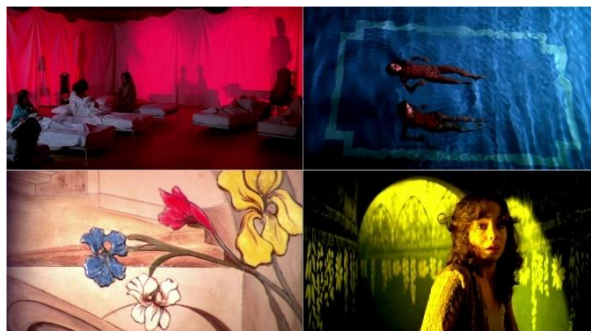
Obrázek 3: Koláž záběrů různých filmů Daria Argenta – ukázky Argentovy barevné palety

Barevná paleta. Další znak osobitosti Argentových filmů spočívá ve využívání barev, které v tradičním giallo není charakteristické. Barevná paleta jeho snímků není tmavá, ale naopak velice jasná a sytá. Využívá kombinaci základních barev, jako je červená, žlutá a modrá. Tímto způsobem režisér vytváří pocit nebezpečí, nepohodlí a nereálnosti toho, co se děje na obrazovce. Nejčastěji však Argento využívá černou a červenou barvu, které mají symbolický význam a jsou spojené se zlem a smrtí [Obrázek 3]. 62