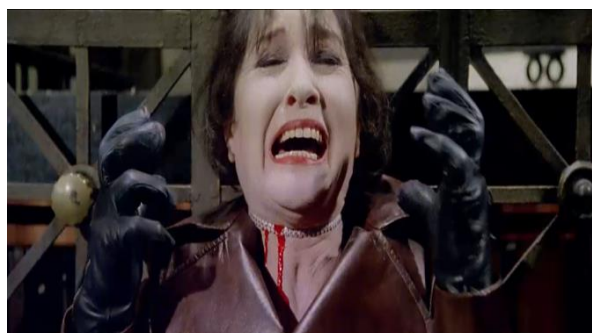
Obrázek 18: Scéna zavraždění Marty Manganiello

Tragickou smrt Carla Manganiella režisér ukazuje využíváním celku v tmavých odstínech. Zdůrazňuje a osvětluje jen detailní záběry, během kterých Carlo naráží hlavou do pouličního světla a do obrubníku, aby ukázal jeho zranění. Kulminací dané scény je náraz auta do Carlovy hlavy, který režisér natočil zespondu a velkým detailem. Smrt Marty Manganiello ukazuje Argento velmi podrobně. Během útoku na Marcuse Dalyho přívěsek Marty uvízne v mřížce výtahu a usekne jí hlavu. Useknutí hlavy režisér zobrazuje pomocí fragmentárního ukazování několika záběrů – velký detail očí, po němž lze vidět polocelek postavy Marty a velký detail jejího krku, podříznutého přívěskem. Po ukončení dějství režisér ukazuje jen visící krvavý přívěsek a tratoliště krve, na něž se dívá Daly [Obrázek 18].