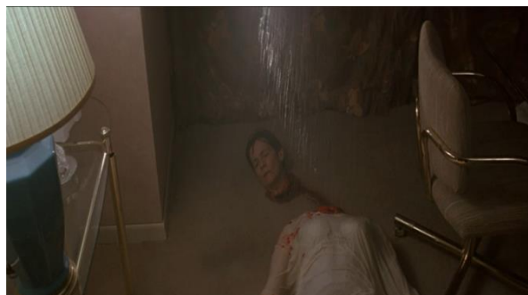
Obrázek 30 : Odříznutá hlava doktorky

Stejně jako ve filmech Tmavě červená a Děs v opeře Dario Argento opovrhuje jedním z hlavních atributů klasického giallo – ženskou sexualizací. Tento fakt následně způsobuje zaměření narativu na detailnější rozbor detektivní složky. Za překročení žánrových konvencí také považují zmínění sociálního problému (anorexie hlavní ženské postavy) a místo, kde se děj odehrává. Na rozdíl od klasické