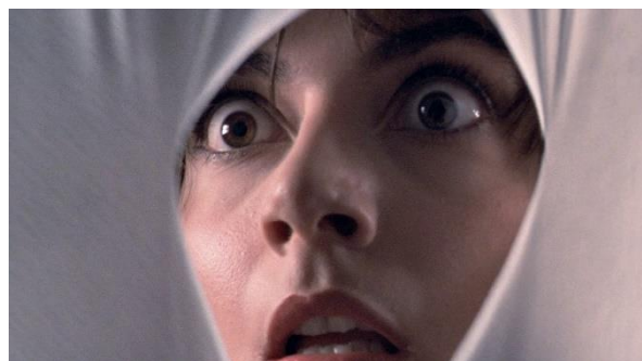
Obrázek 2: Subjektivní záběr z pohledu nože ve filmu Temnota

zmiňuje ve své autobiografii: „Myslím si, že kamera vřdycky byla moje posedlost, ten pohyb kamery. Protože pro mě je nejdůležitější věc pohyb věcí, ta kamera, protože bez ní film představuje jen jeviště nebo televizi – nic.“ 57 Subjektivní kamera se u Argenta stala revoluční díky způsobu, jakým ji využívá. Režisér staví diváka ne na místo protagonisty, ale na místo vraha, čímž rozšiřuje voyeuristickou podstatu filmu. 58 Režisér dává divákům možnost identifikovat se s maniakem, ale s rozvojem giallo začíná přemísťovat subjektivní kameru na oběť. Je nutné zmínit, že s vývojem giallo Argento experimentuje se subjektivitou. Ve filmu Phenomena 59 z roku 1985 se subjektivní kamera obrací k hmyzu, ve filmu Děs v opeře 60 z roku 1987 k vráně prolétající nad divadelním sálem. Režisér také zaměřuje subjektivní kameru na neživé předměty. Ve snímku Temnota 61 z roku 1982 je scéna vraždy ukázaná z pohledu nože [Obrázek 2].