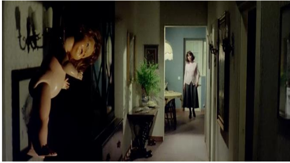
Obrázek 10: Scéna zavraždění Amandy Righetti

Společně s novinářkou Giannou Brezzi (Daria Nicolodi) pianista zahájí vlastní pátrání, jež je přivádí do domu Amandy Righetti, spisovatelky románu The House of the Screaming Child . V této epizodě Argento znovu uvádí neomezenou naraci 195 , neboť divák