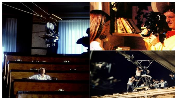
Obrázek 1: Koláž, jež uvádí režiséřské metody natáčení

byla natočena dlouhým záběrem. Pro tuto scénu Argento využíval jeřáb Louma [Obrázek 1] a doba natáčení trvala až 3 dny. 56