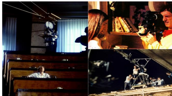
Obrázek 1: Koláž, jež uvádí režiséřské metody natáčení

byla natočena dlouhým záběrem. Pro tuto scénu Argento využíval jeřáb Louma [Obrázek 1] a doba natáčení trvala až 3 dny. 56