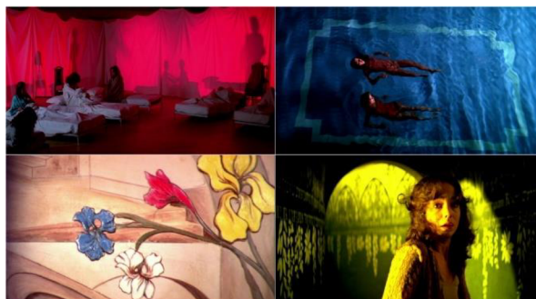
Obrázek 3: Koláž záběrů různých filmů Daria Argenta – ukázky Argentovy barevné palety

Barevná paleta. Další znak osobitosti Argentových filmů spočívá ve využívání barev, které v tradičním giallo není charakteristické. Barevná paleta jeho snímků není tmavá, ale naopak velice jasná a sytá. Využívá kombinaci základních barev, jako je červená, žlutá a modrá. Tímto způsobem režisér vytváří pocit nebezpečí, nepohodlí a nereálnosti toho, co se děje na obrazovce. Nejčastěji však Argento využívá černou a červenou barvu, které mají symbolický význam a jsou spojené se zlem a smrtí [Obrázek 3]. 62