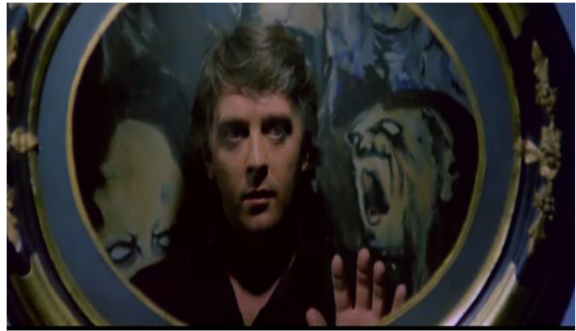
Obrázek 12: Vzpomínka na vraha v zrcadle

Po výše zmíněných událostech si Marcus, procházející se po náměstí, kde kdysi mluvil s Carlem, uvědomuje, že Carlo byl během zavraždění Helgy s ním, a dospívá k závěru, že Carlo měl spolupachatele. To přivádí pianistu