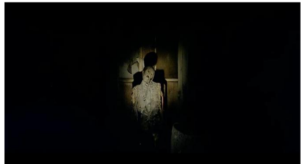
Obrázek 11: Mrtvola manžela Marty Manganiello

Pátrání přivádí Marcuse do místního školního archivu, v němž nachází obrázek identický tomu, který objevil v domě.