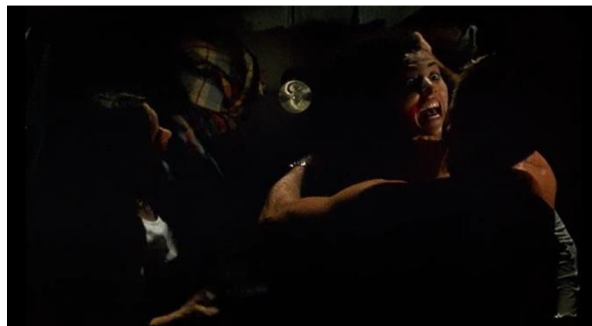
Obrázek 24: Záběr znásilnění neznámé ženy v autě

zatmívačkou společně s tím, jak hlavní ženská postava upadá do bezvědomí. Hned poté Argento uvádí scénu znásilnění neznámé ženy v autě, při němž Anna Manni nabývá vědomí. Režisér znovu uvádí záběr shora, aby ukázal prostředí, ve kterém se objevila hlavní ženská postava [Obrázek 24]. Je také nutné zmínit, že daná scéna zabíjení byla vytvořena pomocí počítačové grafiky, již režisér v tomto snímku