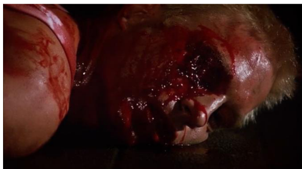
Obrázek 27: Alfredovo zranění

Poté je uvedena scéna únosu Anny Manni a jejího druhého sexuálního zneužití. Během samotné scény znásilnění Argento střídá subjektivní kameru a pohled maniaka na oběť (a na detail její tváře, aby dal lépe najevo emotivní stav, jenž