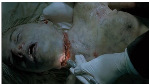
Obrázek 32: Mrtvola anglické turistky

Film vypráví o pátrání po vrahovi známém jako Karetní hráč. Pomocí webové kamery se maniak spojuje s policejní stanicí, kde pracuje Anna Mari (Stefania Rocca). Online vrah nutí policisty hrát internetový poker. Pokud policisté prohrají, bude mučit a pak zabije unesenou ženu. První zabitou obětí se stává britská turistka, proto detektiv z Anglie John Brennan (Liam Cunningham) dostává případ na starost a přijíždí do Říma. Společně se Anna a John snaží maniaka najít. Nicméně John zachytí stopu, jež ho dovede na místo zločinu jako prvního, a zmizí. Během hledání Johna se Anna stává rukojmím maniaka, kterým je její kolega policista.