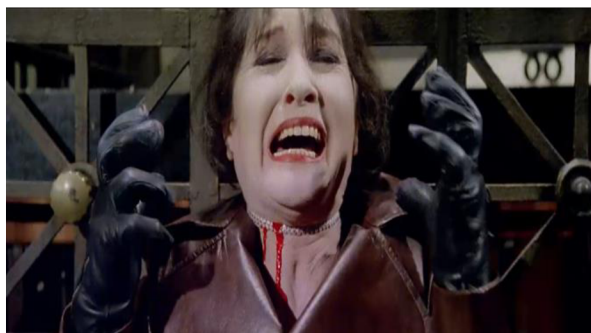
Obrázek 18: Scéna zavraždění Marty Manganiello

Tragickou smrt Carla Manganiella režisér ukazuje využíváním celku v tmavých odstínech. Zdůrazňuje a osvětluje jen detailní záběry, během kterých Carlo naráží hlavou do pouličního světla a do obrubníku, aby ukázal jeho zranění. Kulminací dané scény je náraz auta do Carlovy hlavy, který režisér natočil zespodu a velkým detailem. Smrt Marty Manganiello ukazuje Argento velmi podrobně. Během útoku na Marcuse Dalyho přívěsek Marty uvízne v mřížce výtahu a usekne jí hlavu. Useknutí hlavy režisér zobrazuje pomocí fragmentárního ukazování několika záběrů – velký detail očí, po němž lze vidět polocelek postavy Marty a velký detail jejího krku, podříznutého přívěskem. Po ukončení dějství režisér ukazuje jen visící krvavý přívěsek a tratoliště krve, na něž se dívá Daly [Obrázek 18].