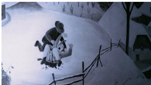
Obrázek 4: Obraz primitivisty Berta Consalviho

Ve filmu Pták s křišťálovým peřím: Přízrak teroru je hlavním hrdinou Sam Dalmas (Tony Musante). Sam je americký spisovatel, který vyrazil do Říma, aby si dopřál tvůrčí dovolenou. Jednoho večera se stává svědkem toho, co se zdá být bezdůvodným útokem na ženu Moniku Ranieri (Eva Renzi) v umělecké galerii, jejímž majitelem je Alberto Ranieri (Umberto Raho), manžel Moniky Ranieri. Posedlý myšlenkou zjistit, kdo je útočník, spisovatel-detektiv začíná neoficiální pátrání, čímž ohrožuje svůj život a život své přítelkyně Julie (Suzy Kendall). Na začátku filmu Pták s křišťálovým peřím: Přízrak teroru lze pozorovat omezenou formu narace 180 , jelikož divák může vidět a slyšet jen to, co vnímá hlavní mužský hrdina. Během celého filmu dává Argento divákovi najevo, že se Dalmas snaží vzpomenout si na nějaký důležitý detail, kterého si všiml během útoku na Moniku Ranieri. Argento ukazuje tento flashback několikrát, během čehož využívá subjektivní naraci 181 , kterou lze převést do mentálního druhu subjektivity 182 (záběr z optické pozice mužské postavy). Právě tento detail, na který režisér obrací pozornost během celého snímku, je klíčovým v odhalení identity vraha.