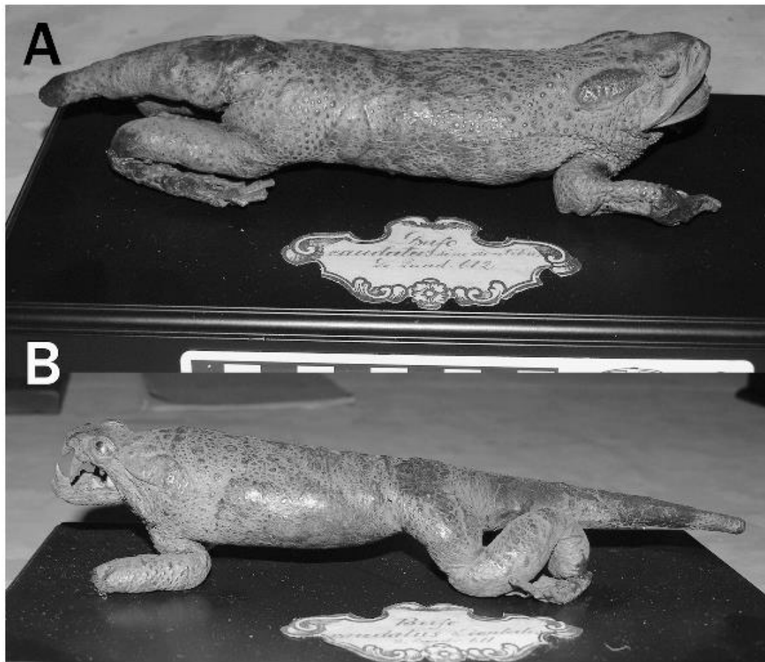
Obrázek 3: Nejstarší dochované dermoplastické preparáty žab, převzato z (Bauer, 2013).

V současně využívaných příručkách Breaktrough se doporučuje postup stažení kůže žab bez vzniku viditelné incize, tedy skrz ústa. Jediná incize se vede skrze ústa, kde kůže rtu přechází v dásně, kůže se následně stahuje přes hlavu, tělo a končetiny. V končetinách je možné nechat chodidla, dle velikosti jedince. U větších kusů se stahují i chodidla. Staženou kůži je nutné očistit od zbylých tkání. Čistá kůže se zakonzervuje pomocí Lutanu F, či speciálním činidlem na plazy a obojživelníky True-tan. Ze tří drátů se vyrobí opora preparátu v tomto tvar