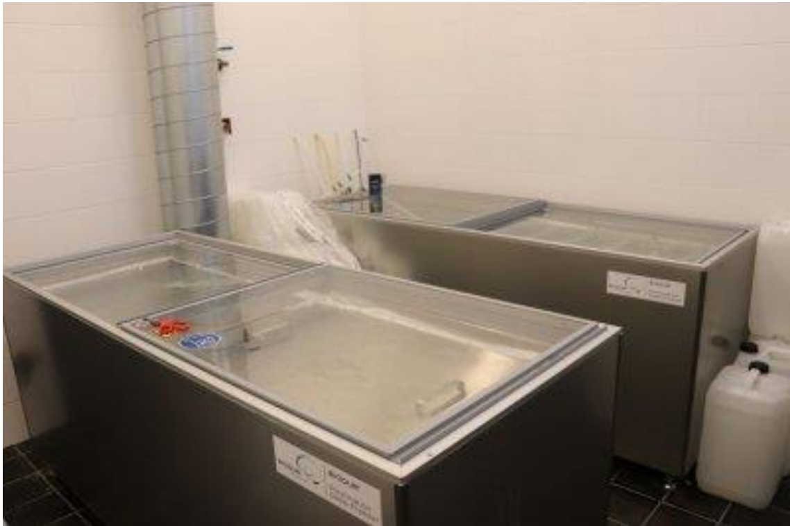
Obrázek 12: Mrazicí kádě plastinátoru, převzato z (Laboratoř plastinace HT109, 2021).