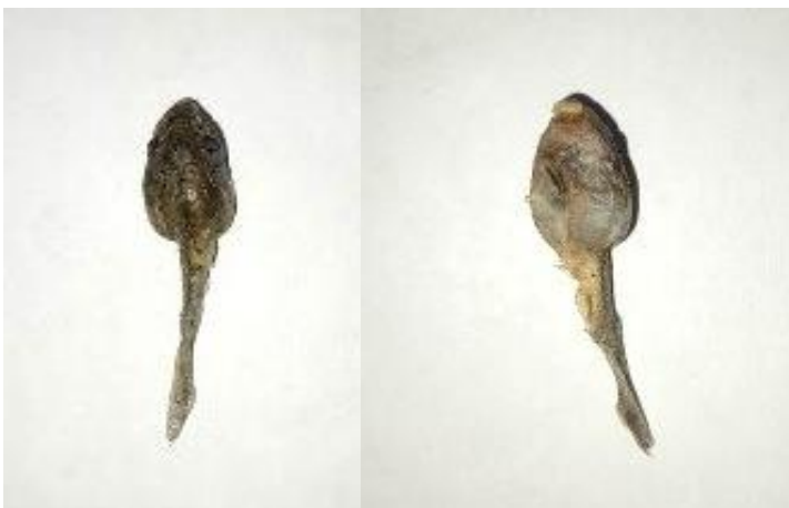
Obrázek 26: Lyofilizát pulce, hřbetní a břišní strana, vlastní tvorba