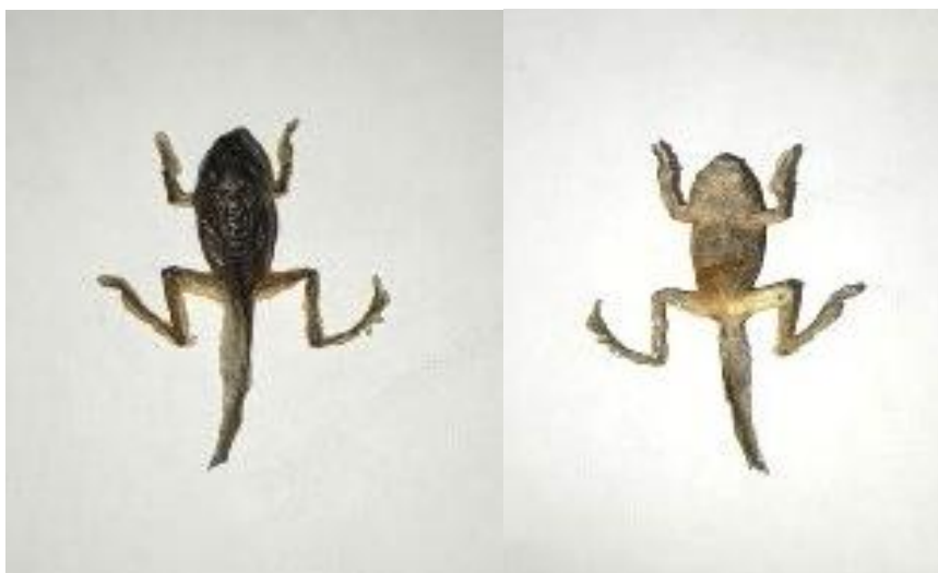
Obrázek 27: Lyofilizát juvenilního jedince, hřbetní a břišní strana, vlastní tvorba