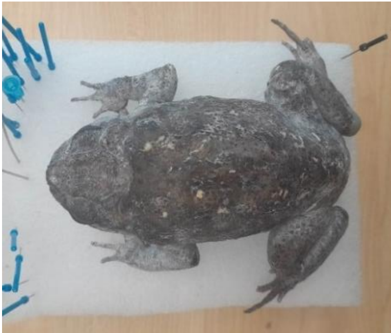
Obrázek 8: Preparát před dobarvením, hřbetní strana, vlastní tvorba

Sieanna (viz obrázek 10 ). Hřbetní stranu jsem nabarvila kombinací DR Olive Green a DR Sepia (viz obrázek 8 a 9 ). Barvy jsem nanesla pomocí air-brush pistole a jejich sytost jsem upravila pomocí ředícího media značky Golden Artist Colors. Detaily na kůži jsem dodělala pomocí štětce, barvou DR Sepia, ředěnou v různých poměrech ředícím mediem. Oči preparátu jsem zbrousila a za použití štětce jsem domalovala duhovku, na kterou jsem použila barvy DR Black, White, Indian Yellow a AAI Primary Yellow, Silver a Deep Gold (viz obrázek 11 ). Nakonec jsem celý preparát natřela lesklým lakem značky Life Tone Hydromist.