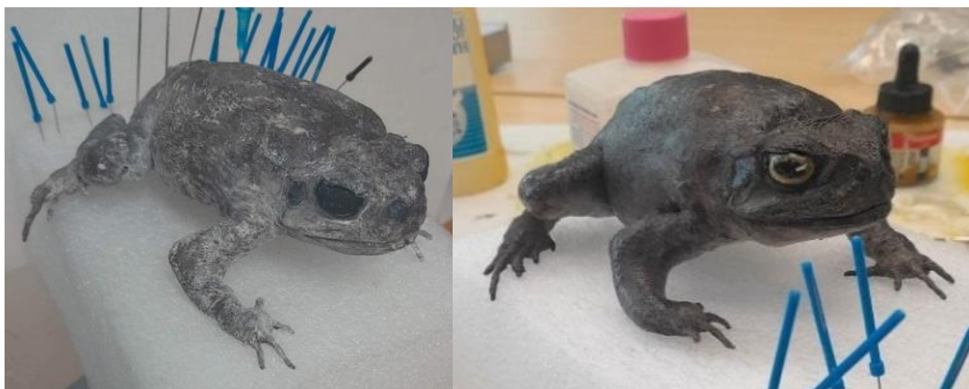
Obrázek 11: Preparát před a po dobarvení, hlava, vlastní tvorba