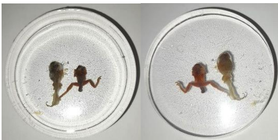
Obrázek 37: Vývojová stádia zalitá v pryskyřici, hřbetní a břišní strana, vlastní tvorba