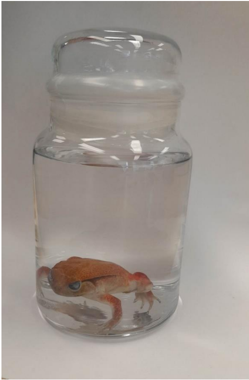
Obrázek 39: Tekutinový preparát vývojových stádií, vlastní tvorba