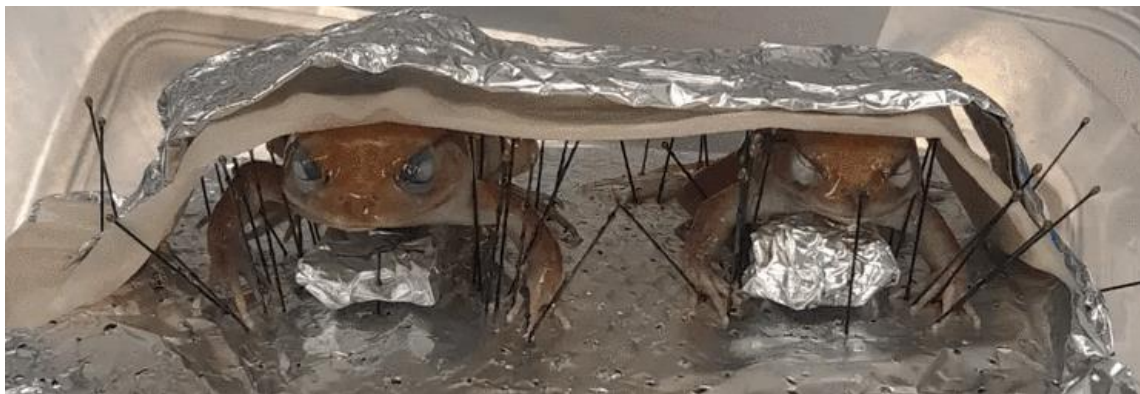
Obrázek 15: Napolohované žáby před vložením do formolu, vlastní tvorba

zachování barvy preparátů. Formaldehyd jsem také vpravila do tělní dutiny jedinců, abych zabránila interní dekompozici po ponoření do fixativu. Ve formaldehydu jsem vzorky nechala fixovat měsíc. Poté jsem je přemístila do skleněných nádob. Pulce a juvenilního jedince jsem společně uložila do drobné nádoby o objemu asi 100 ml, dospělé jsem umístila zvlášť do nádoby o objemu 890 ml. Nádoby s preparáty jsem naplnila technickým lihem v čistotě 95 %. Po uzavření sklenic jsem víka zajistila parafilmem, abych zamezila odpařování lihu z preparátů.