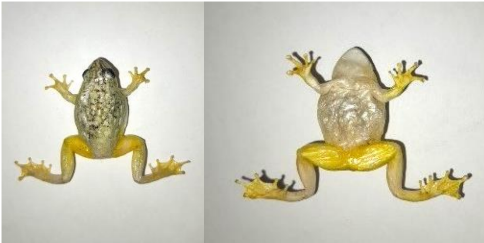
Obrázek 25: Lyofilizát dospělé dobarvený, hřbetní a břišní strana, vlastní tvorba