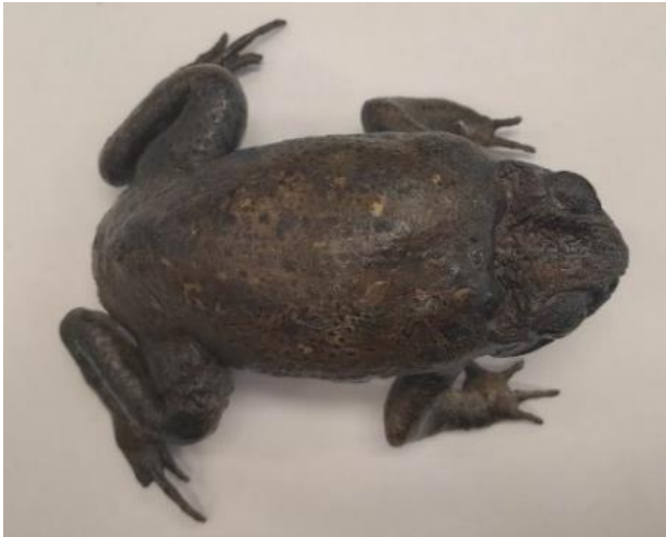
Obrázek 17: Dermoplastický preparát, hřbet, vlastní tvorba