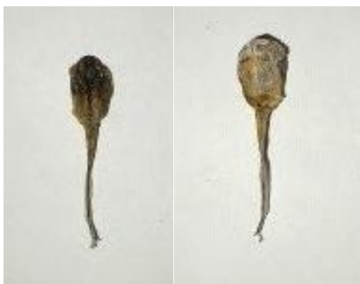
Obrázek 33: Pulec sušený mrazem 2, hřbetní a břišní strana, vlastní tvorba