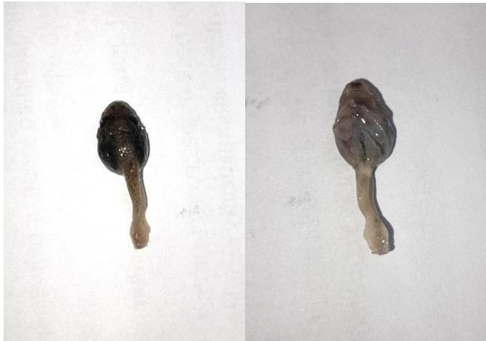
Obrázek 19: Platinát pulce, hřbetní a břišní strana, vlastní tvorba