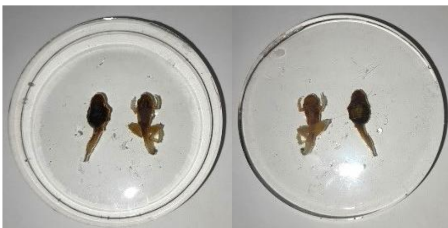
Obrázek 38: Vývojová stádia zalitá v pryskyřici, hřbetní a břišní strana, vlastní tvorba