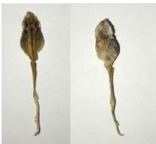
Obrázek 32: Pulec sušený mrazem 1, hřbetní a břišní strana, vlastní tvorba