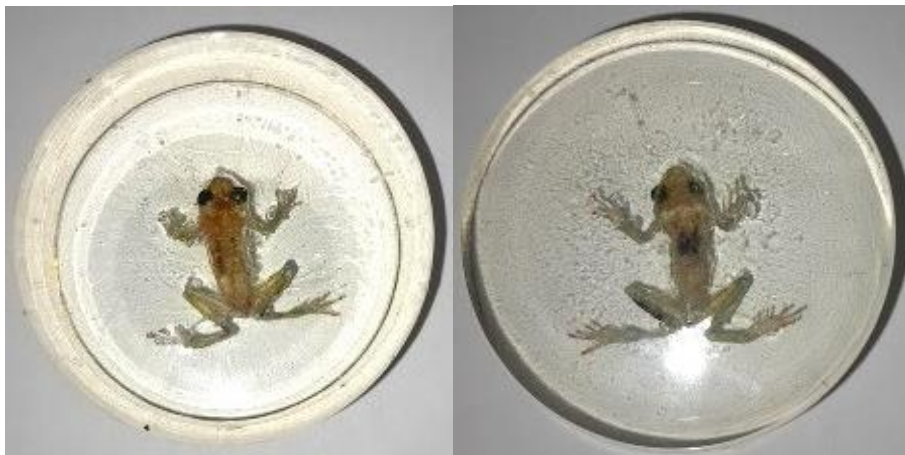
Obrázek 35: Dospělec zalitý v pryskyřici 2, hřbetní a břišní strana, vlastní tvorba