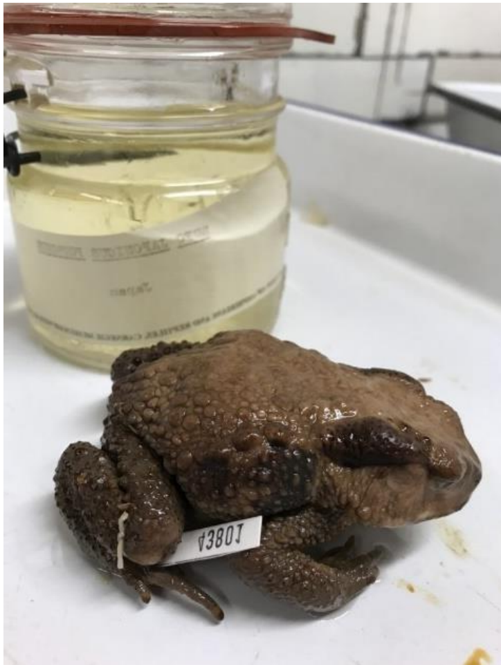
Obrázek 2: Příklad mokrého preparátu převzato z (Sheridan, 2023).

Dnes se nejčastěji fixuje pomocí aplikace tří roztoků. První roztok se skládá z octanu draselného, dusičnanu draselného, formaldehydu a vody. Tento roztok preparát fixuje a redukuje hemoglobin na methemoglobin. Druhý fixativ je ethanol, jenž mění methemoglobin na katahemoglobin, a vrací tak přirozenou barvu preparátu. Třetím roztokem je směs vody, glycerolu a octanu draselného, ve které je preparát dlouhodobě uchováván (Frišhons et al., 2019).