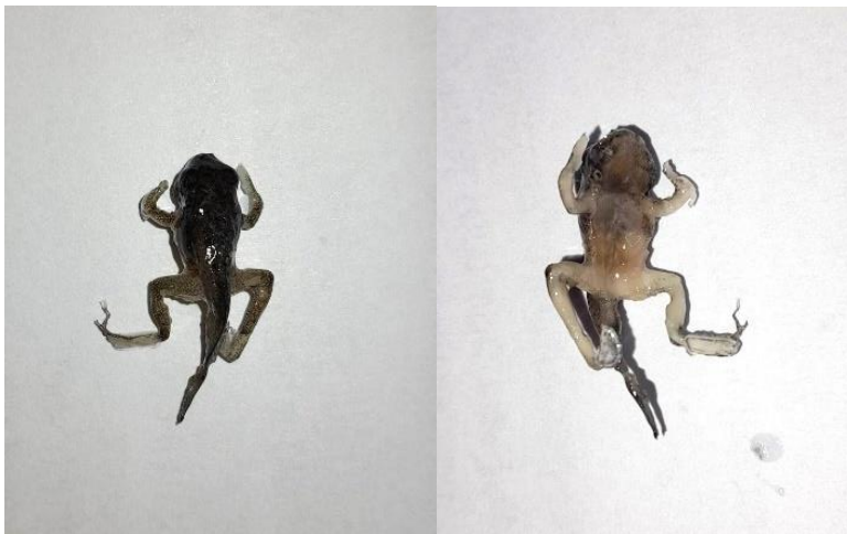
Obrázek 20: Platinát juvenilního jedince, hřbetní a břišní strana, vlastní tvorba