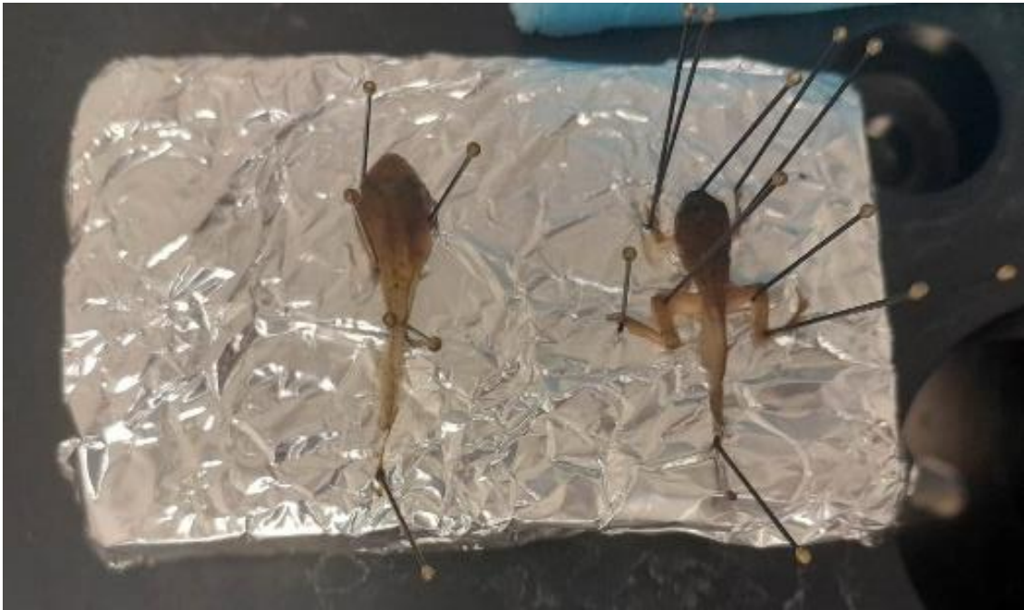
Obrázek 14: Hotové preparáty v lyofilizátoru, vlastní tvorba

pistoli. Preparát sušený mrazem jsem dobarvila stejnou metodou za použití barev AAI Primary yellow, Raw sienna a DR Sap Green, Olive Green, Black a White.