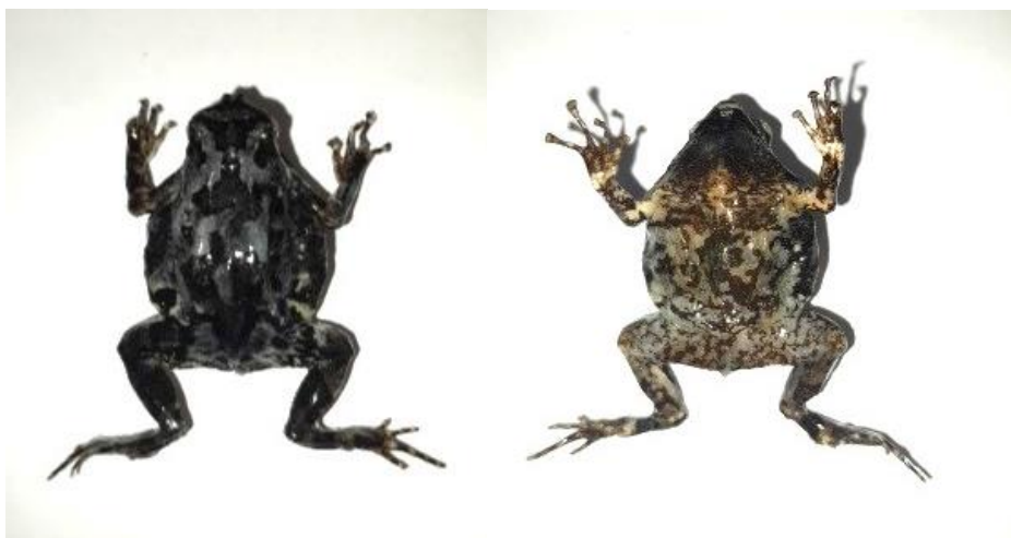
Obrázek 21: Plastinát dospělce 1, hřbetní a břišní strana, vlastní tvorba