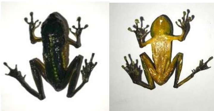
Obrázek 29: Dospělec sušený mrazem dobarvený, hřbetní a břišní strana, vlastní tvorba