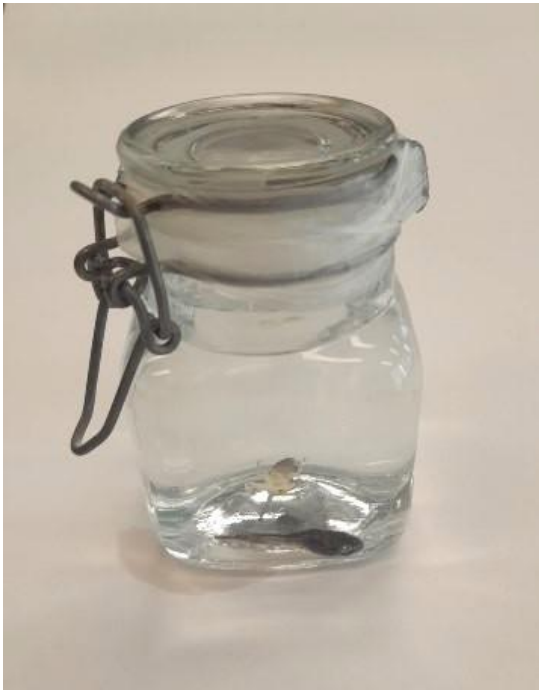
Obrázek 40: Tekutinový preparát dospělého, vlastní tvorba