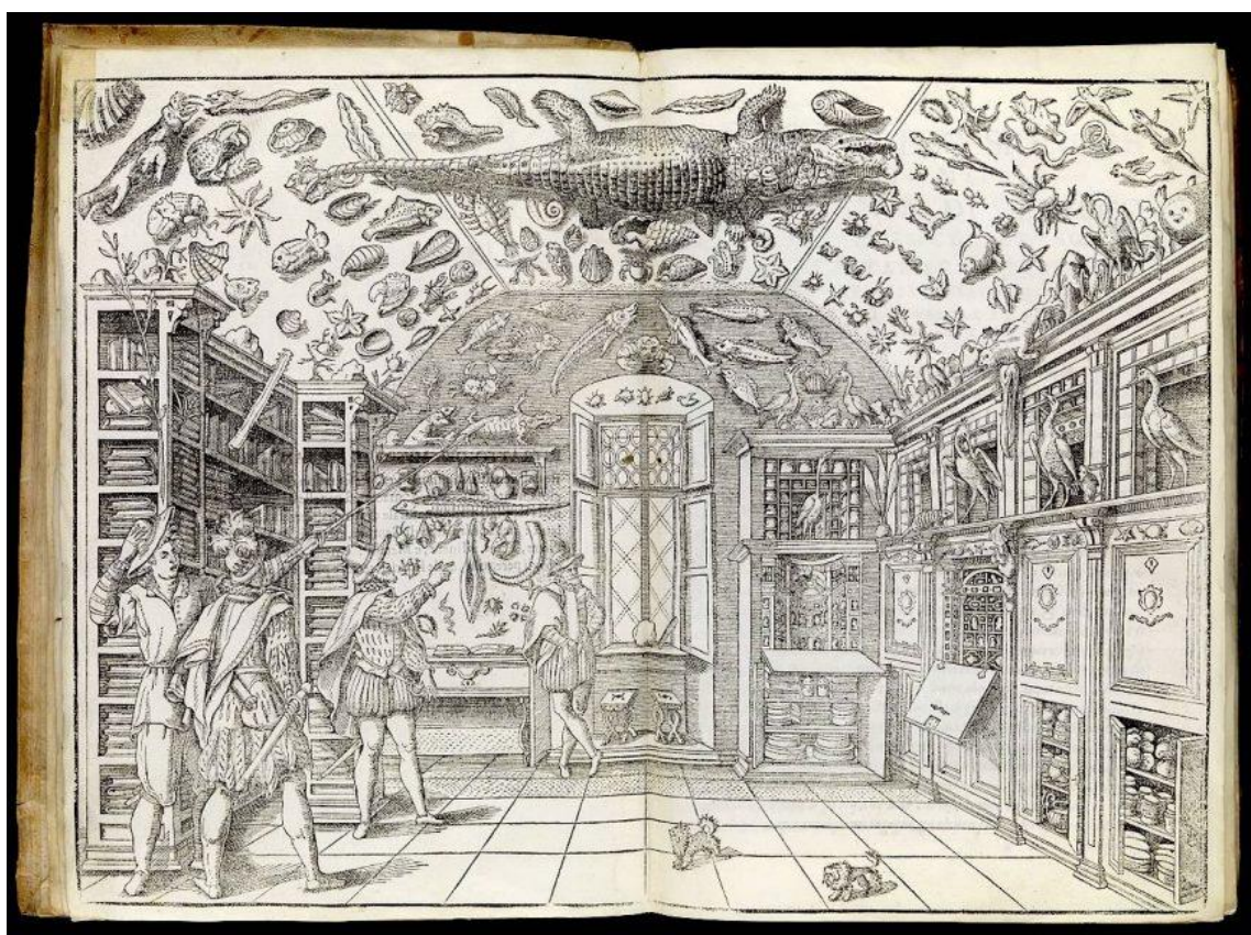
Obrázek 1: Příklad středověkého kabinetu kuriozit převzato z (Kilroy-Ewbank, 2019).

Sbírky původně uchovávaly běžně nedostupné předměty raritní či kuriozitní, které často pocházeli z exotických míst (Lane, 1996). Těmto kolekcím říkáme „kabinety kuriozit“. Jsou přímými předchůdci muzeí (Bauer, 2013). Příkladem kabinetu kuriozit je třeba Wunderkammer císaře Rudolfa II., který obsahoval krom jiného sbírku dvaceti jedna rohů nosorožců, či lidskou mumii (Lešková, 2014). Některé z těchto kabinetů byly ve skutečnosti celé místnosti, jiné byly kusy nábytku. Kabinety kuriozit nebyly vědecky uspořádány, ani nebyly pro studium dostupné veřejnosti. Byly vnímány jako privátní sbírky shromážděné pro soukromé, především však estetické účely (Ritterbush, 1969). Tyto kolekce představovaly spíše sbírky umění než skutečné přírodovědné sbírky protože konzervování biologického materiálu v dřívějších dobách bylo problematické (Porter, 1991).