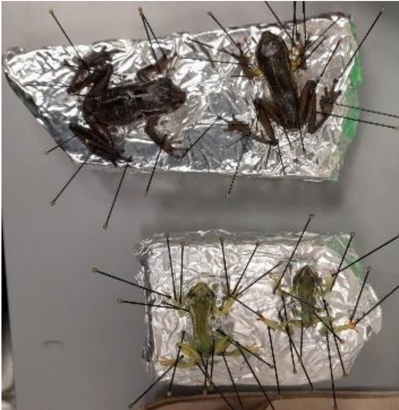
Obrázek 13: Polohování preparátů, vlastní tvorba

Pro lyofilizaci jsem vybrala dva dospělé, jednoho pulce a jednoho dospívajícího těsně před metamorfózou, stejně tak i pro sušení mrazem. Všechny obojživelníky jsem vpolohovala do požadovaného postroje (viz obrázek 13 ). Jedince určené na sušení mrazem jsem odkryté uložila do mrazáku s teplotou -20\text{ }^{\circ}\text{C} . Zde se sušili tři měsíce.