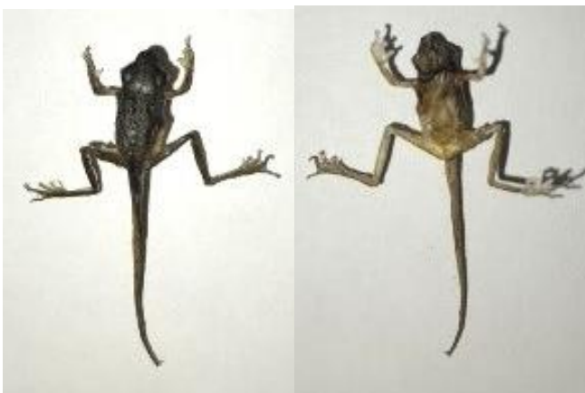
Obrázek 30: Juvenilní jedinec sušený mrazem 1, hřbetní a břišní strana, vlastní tvorba