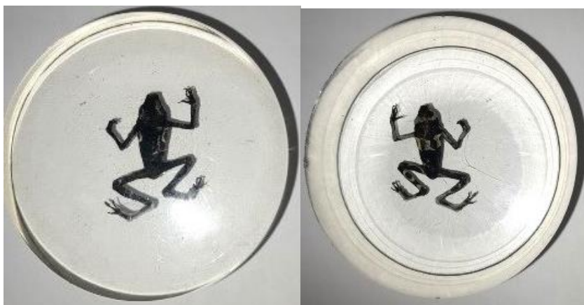
Obrázek 36: Dospělec zalitý v pryskyřici 3, hřbetní a břišní strana, vlastní tvorba