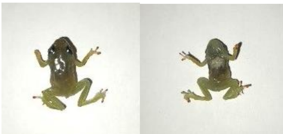
Obrázek 23: Plastinát dospělce 3, hřbetní a břišní strana, vlastní tvorba