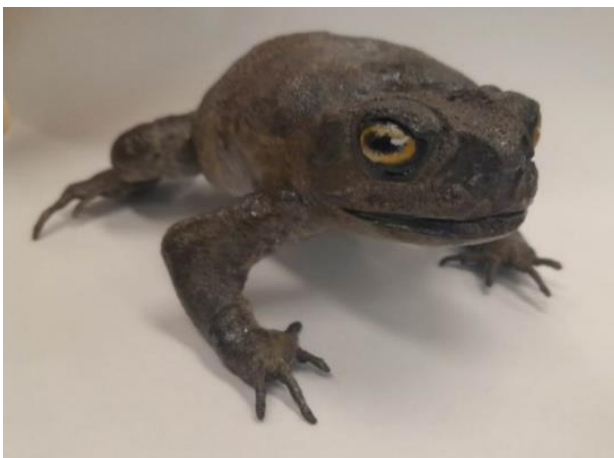
Obrázek 18: Dermoplastický preparát, hlava, vlastní tvorba