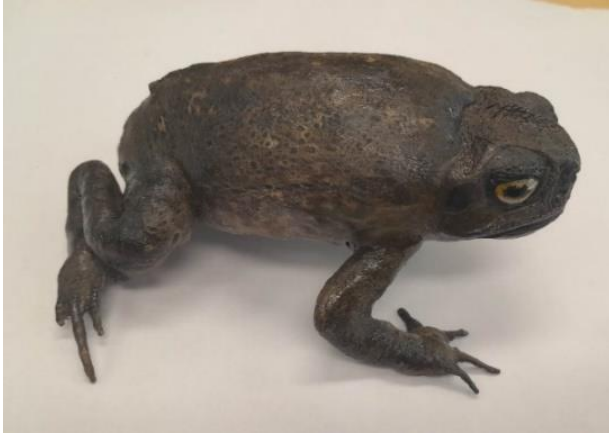
Obrázek 16: Dermoplastický preparát, celý, vlastní tvorba