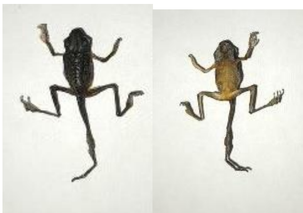
Obrázek 31: Juvenilní jedinec sušený mrazem 2, hřbetní a břišní strana