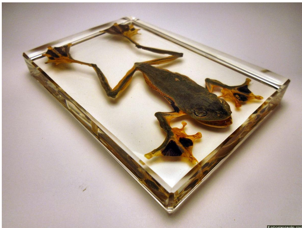
Obrázek 7: Příklad preparátu v pryskyřici, převzato z www.entomoresin.com

- 48 hodin, případně dle návodu dané pryskyřice. Finální, ztuhlý vzorek je možné ořezat, zbrousit a vyleštit do požadované podoby (Thamilselvan, 2021).