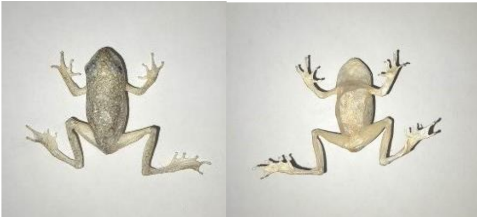
Obrázek 24: Lyofilizát dospělé nedobarvený, hřbetní a břišní strana, vlastní tvorba