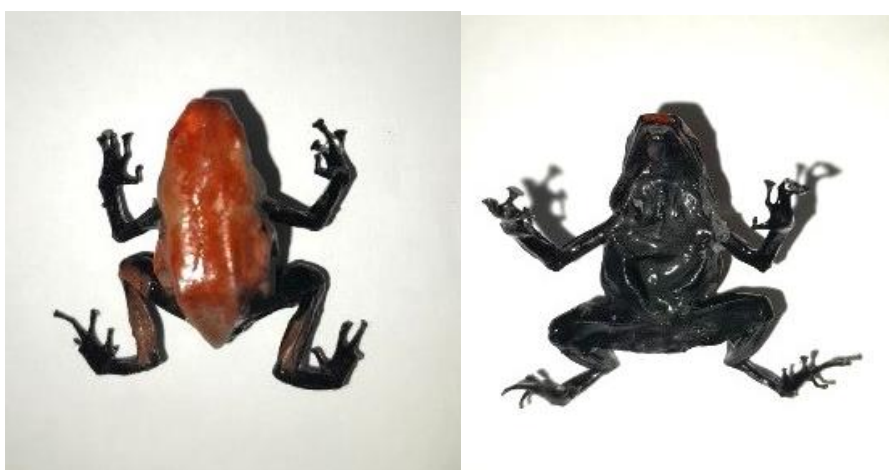
Obrázek 22: Plastinát dospělce 2, hřbetní a břišní strana, vlastní tvorba