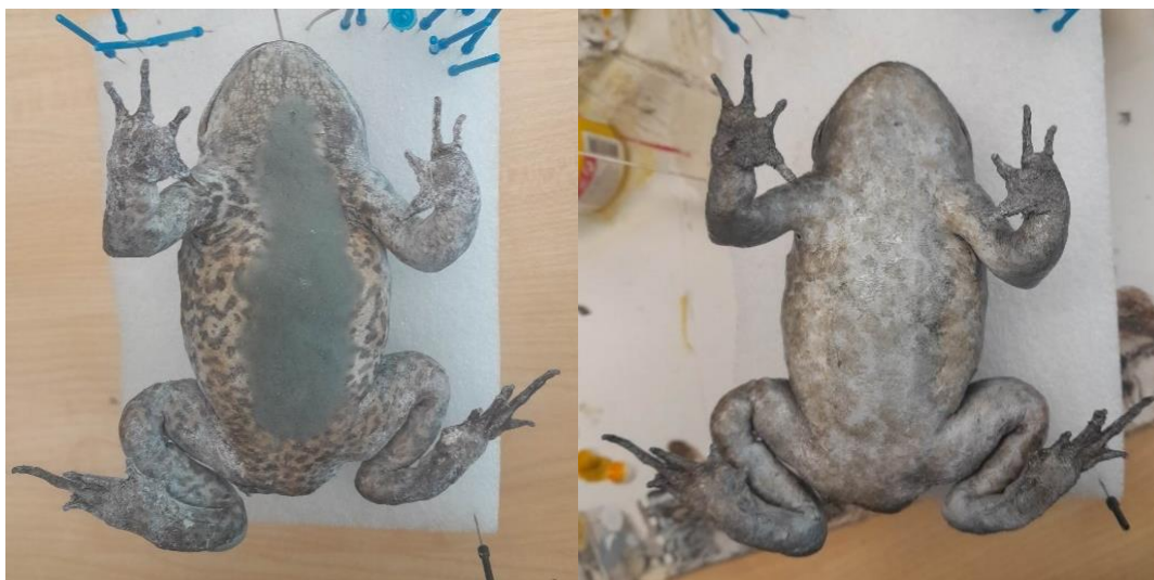
Obrázek 10: Preparát před a po dobarvení, břišní strana, vlastní tvorba