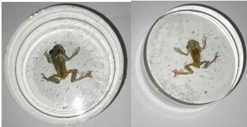
Obrázek 34: Dospělec zalitý v pryskyřici 1, hřbetní a břišní strana, vlastní tvorba