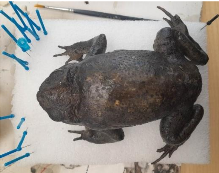
Obrázek 9: Preparát po dobarvení, hřbetní strana, vlastní tvorba