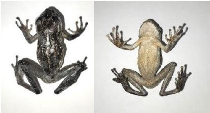
Obrázek 28: Dospělec sušený mrazem nedobarvený, hřbetní a břišní strana, vlastní tvorba