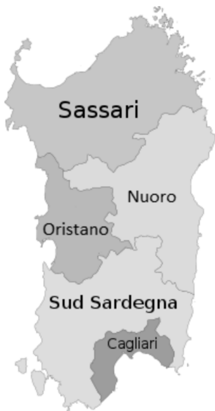
Obr. 3 – Mapa aktuálních provincií na Sardinii

Zdroj: Sardegna, Suddivisione territoriale. Dostupné z: https://it.wikipedia.org/wiki/Sardegna#Suddivisione_territoriale (přístup 11. 3 2022). Upraveno.