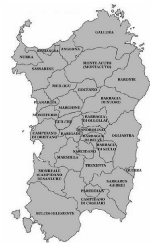
Obr. 2 – Mapa historických regionů Sardinie