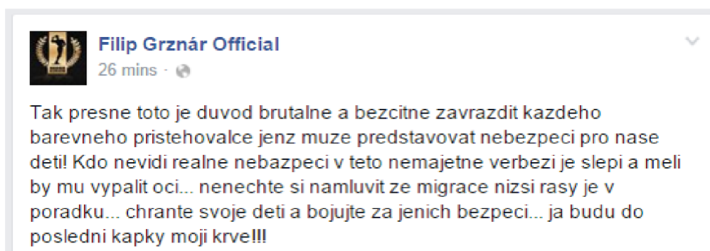
Obrázek 2 – Příklad xenofobního příspěvku mířeného proti migrantům

V ČR se nejvíce nenávistných projevů na Facebooku objevuje ze zdrojů neonacistických hnutí. Tato hnutí působí jak skrytě, tak i veřejně a většina z nich je silně militantně založena. Členové těchto skupin jsou velmi aktivisticky založeni a používají silně agresivní a burčující rétoriku, s cílem mobilizovat osoby, přičemž k dosažení svých cílů jsou ochotni, kromě rétoriky a příspěvků, použít i násilí. Mezi nejznámější patří Hammerskins Nations, Ku-Klux-Klan nebo novější Národní odpor a Autonomní nacionalisté. 19