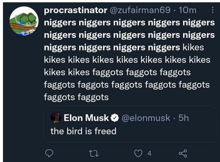
Obrázek 3 – Nenávistný příspěvek a Twitteru

Velmi kontroverzním tématem se na Twitteru stalo odblokování bývalého prezidenta USA Donalda Trumpa. Ten čelil a nadále čelí obvinění za vyprovokování útoku na Kapitol Spojených států amerických, který se stal 6. ledna 2021, jakožto reakce na prohrané volby z podzimu 2020. Trump se na síti vyjadřoval velmi kontroverzně a mnohdy svými příspěvky podporoval své příznivce v pokračování protestů a demonstrací, které často eskalovaly do situací, kde bylo použito násilí nebo zbraně.