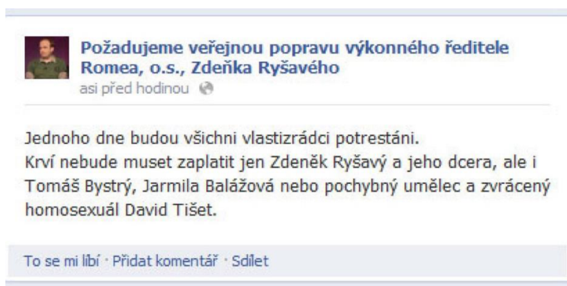
Obrázek 1 - Příklad nenávistného příspěvku na sociální síti Facebook

Facebook má politiku proti nenávistným projevům, která zakazuje příspěvky, které podněcují násilí nebo nenávist na základě rasy, náboženství, sexuální orientace, pohlaví a dalších chráněných charakteristik. Pokud se na Facebooku objeví podezření na takové příspěvky, mohou být nahlášeny moderátorům Facebooku. 17 Pokud moderátoři Facebooku zjistí, že příspěvek porušuje politiku proti nenávistným projevům, mohou jej odstranit a uživateli, který ho napsal, mohou uložit sankci, jako například dočasné nebo trvalé pozastavení účtu. Facebook také spolupracuje s orgány činnými v trestním řízení, aby zajistil, že trestně stíhané případy budou řešeny přiměřeně. 18