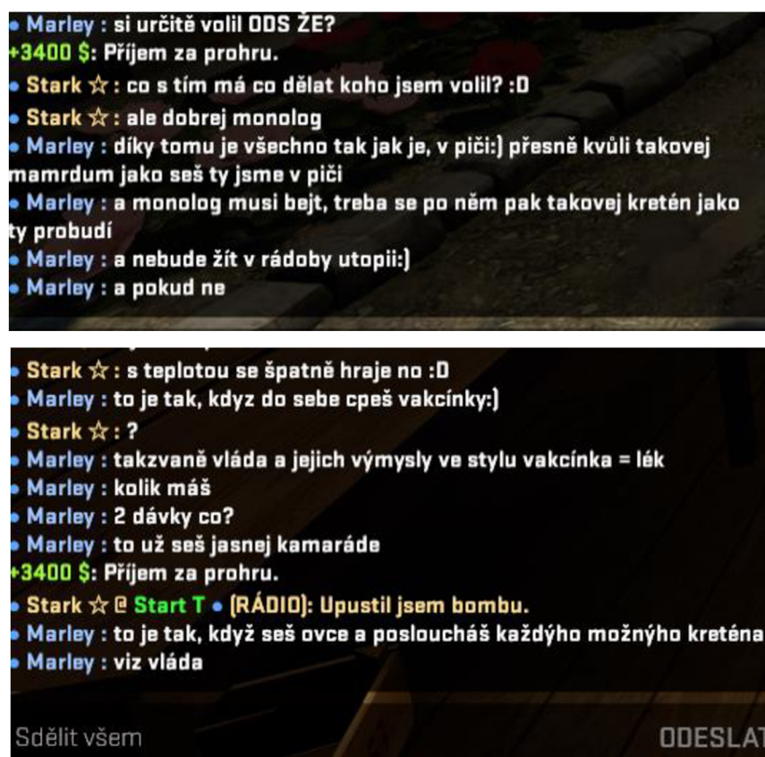
Obrázek 6 – Příklad dezinformace a předsudku vůči vakcínám

V současné době se antivax hnutí dostala do popředí kvůli pandemii onemocnění Covid-19, s kterým jsme se v posledních letech potýkali (lépe říci – již v menší míře, ale stále potýkáme). V České republice byl nejvýraznější spolek Chcípl pes, který se zaměřoval právě na antivaxerská témata. Tento spolek vznikl v roce 2020 jako odpor několika provozovatelů proti vládnímu nařízení k uzavření podniků. Pořádali řadu demonstrací, která byla namířena proti vládě a jejím proticovidovým opatřením, příkladem může být právě ta ze dne 12.12.2021 na Václavském náměstí, která byla mířena proti povinnému očkování. 49