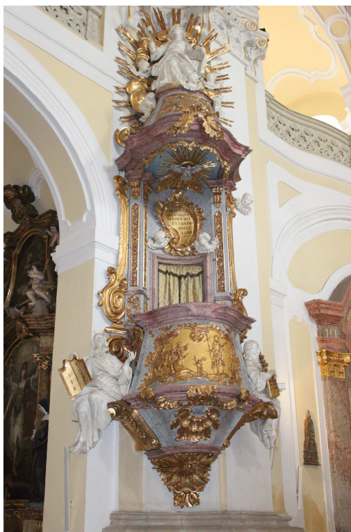
6. Hyppolit Weissmann, Kazatelna, před 1760, Frýdek, poutní kostel Navštívení Panny Marie.