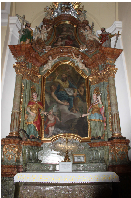
11. Oltář sv. Filipa apoštola, 1761, Frýdek, poutní kostel Navštívení Panny Marie.