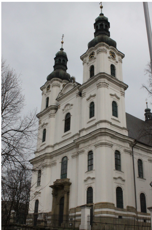
3. Frýdek, poutní kostel Navštívení Panny Marie, 1740-1759, věže kostela.