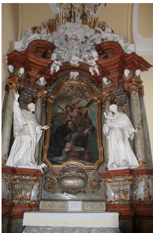
7. Oltář sv. Jana z Boha, 1760, Frýdek, poutní kostel Navštívení Panny Marie.