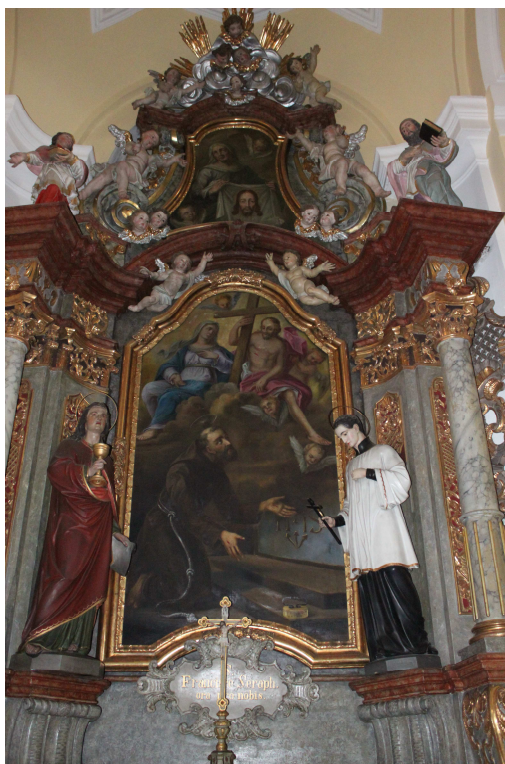
12. Oltář sv. Františka z Assisi, 1761, Frýdek, poutní kostel Navštívení Panny Marie.