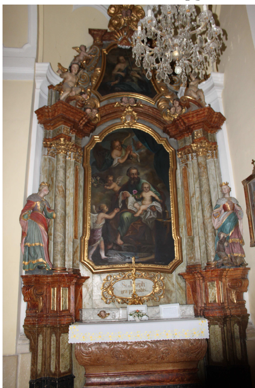
10. Oltář sv. Josefa Pěstouna, 1761, Frýdek, poutní kostel Navštívení Panny Marie.