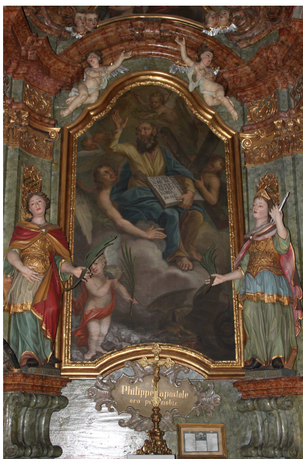
21. Eliáš František Herbert, Oltární obraz Glorifikace sv. Filipa apoštola, 1761, Frýdek, poutní kostel Navštívení Panny Marie.