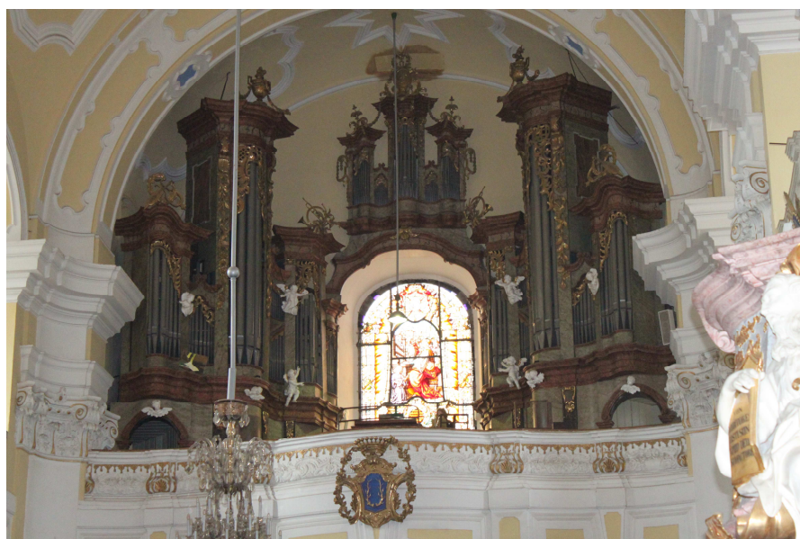
13. Josef Staudinger, Varhany, 1763, Frýdek, poutní kostel Navštívení Panny Marie.