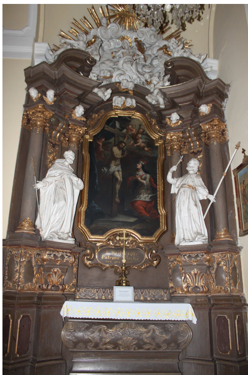
8. Oltář Sv. Hedviky, 1759, Frýdek, poutní kostel Navštívení Panny Marie.