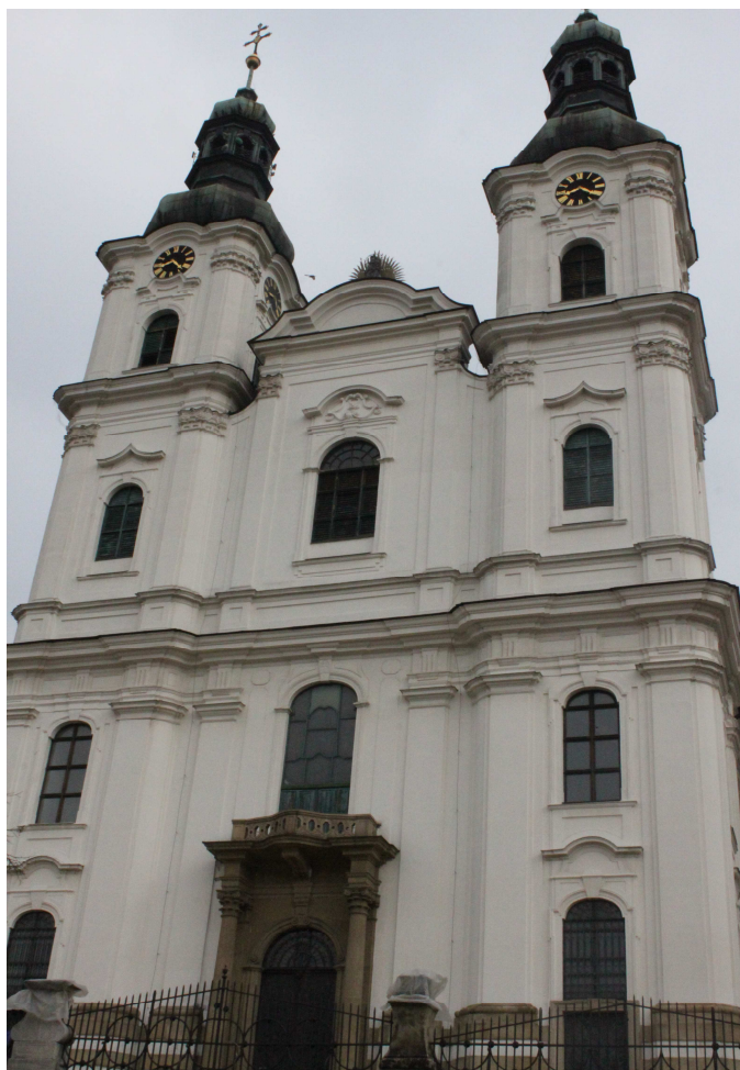
2. Frýdek, poutní kostel Navštívení Panny Marie, 1740-1759, průčelí.