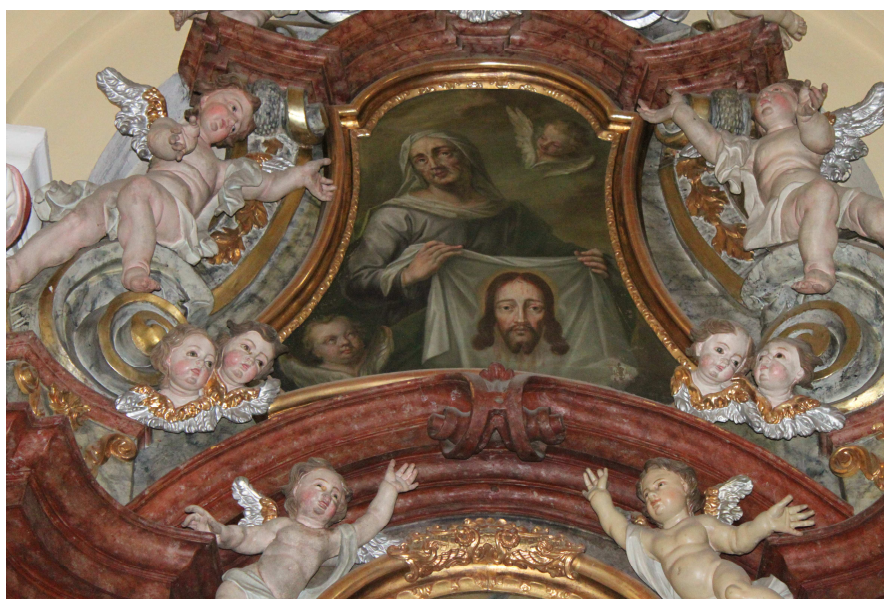
16. Eliáš František Herbert, Obraz sv. Veroniky, kolem 1761, Frýdek, poutní kostel Navštívení Panny Marie.