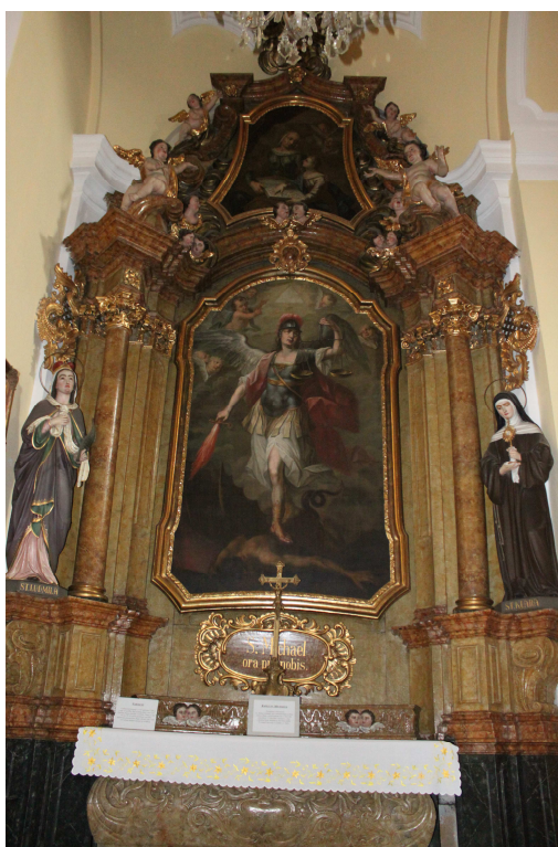
9. Oltář sv. Michaela archanděla, 1761, Frýdek, poutní kostel Navštívení Panny Marie.