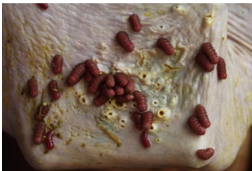
Obrázek č. 3: Četné larvy Gasterophilus přichycující se na nežlaznaté sliznici žaludku. Všimněte si multifokálních, kulatých vředů se zvýšeným, hyperplastickým okrajem, které zanechávají larvy při oddělení (Uzal & Diab 2015)

Léze v gastrointestinálním traktu lze rozlišit na základě jejich průměru v závislosti na vývojových stádiích larev a jejich velikosti na léze s velmi malým průměrem (0,5–1 mm), které dělíme na jamkovité léze, které jsou nevýrazné, a jejich průměr je menší nebo stejně velký jako jedinci larev druhého stádia a hluboké, že se do něj zanoří půlka larvy. Dále nodulární léze, které jsou výrazné, mají kulovitý tvar a uvnitř jsou vytvořeny jedna až čtyři malé, ale hluboké díry vzniklé úplnou penetrací larvy druhého stádia. Léze s malým průměrem (2–3 mm) dělíme na kráterovité léze, které jsou také výrazné, ale malé, tak že larvy třetího stádia, do nich můžou zanořit pouze pseudocefalon. Pak atypické jamkovité léze kruhovitěho tvaru s rovnoměrně ohraničenými okraji, ty jsou tvořeny larvami třetího stádia a vyskytují se ojediněle. Léze s velkým průměrem (4–5 mm) můžou mít jamkovitý tvar, tyto léze jsou hluboké, výrazné a stejně velké či větší než larvy třetího stádia. Kráterovité léze s vícečetnými erozemi jsou mělké, jejich okraje jsou nerovné a vznikají shlukováním menších lézí. Trychtýřovité léze jsou malé, kruhovitě léze, které se od základu zužují, nejsou hluboké a často kopírují tvar larvy. Poslední knoflíkovité léze jsou složené ze tří až čtyř hlubokých děr, obklopené tlustou vrstvou sliznice. Vznikají z nodulárních lézí při přeměně larev z druhého na třetí larvální stádium (Principato 1988).