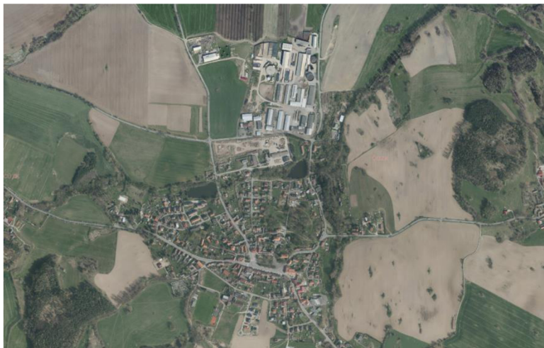
Obrázek 5 – Snímek současné krajiny v okolí Petrovic

Výsledkem kolektivizace a intenzifikace zemědělství bylo zesílení půdní eroze, protože velké půdní bloky osázené jednou plodinou jsou mnohem náchylnější k erozi vodní i větrné (Petřík a kol., 2017). Používáním minerálních hnojiv na úkor těch organických se z půdy postupně vytrácí organický materiál, což vede k úbytku edafonních bezobratlých živočichů (žížaly, chvostokoci). Bez těchto živočichů, kteří ji kypří a provzdušňují, se půda stává méně porézní a je tím pádem schopna pojmout menší množství vody. V tomto ohledu půda trpí i používáním těžké zemědělské techniky, které půdu utužuje a dále omezuje její sorpci. S výkyvy počasí a letním střídáním dlouhého sucha s přivalovými dešti a povodněmi je tento problém v posledních letech čím dál palčivější. Navíc kvalitní zemědělské půdy rok od roku ubývá vlivem relativně intenzivní zástavby (Petřík a kol. 2017). Průměrně se v ČR zastaví osm hektarů orné půdy denně, za posledních 100 let jsme zástavbou přišli o milion hektarů zemědělské plochy (Plasová, 2020).