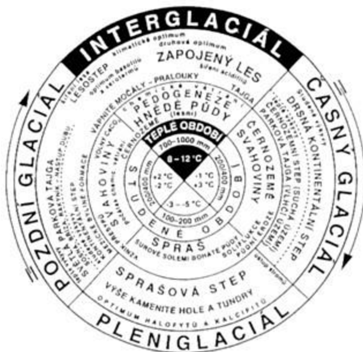
Obrázek 2 - Schéma kvartérního klimatického cyklu znázorňující cyklické sled vegetačních, půdotvorných a sedimentačních fází. Převzato z Ložek (2007).

Dalším znakem kvartéru je nástup současné fauny a flóry. Již od pleistocénu se naše flóra a fauna bezobratlých začíná podobat té dnešní. Obratlovci na druhou stranu prodělali ve čtvrtohorách mnoho evolučních změn (Ložek, 1973) V kvartéru se v přírodě objevuje člověk, rod Homo . Dnes je lidská činnost jedním z nejvýznamnějších krajinnotvorných činitelů. Po většinu své existence však byli lidé zcela odkázáni na přírodu. Přelom v tomto ohledu nastává až v holocénu, v neolitické revoluci doprovázené domestikací užitkových druhů zvířat a rostlin (Chlupáč, 2011; Ložek, 1973).