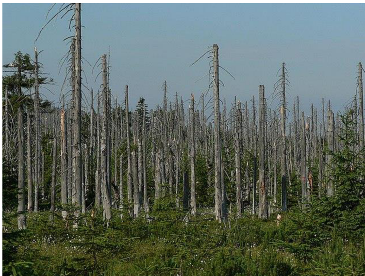
Obrázek 4 - Následky kyselých dešťů na smrkovém lese v Jizerských horách, 2006

Nemalý podíl na znehodnocování krajiny má i průmysl, znečištění emisemi z továren, elektráren a spalování fosilních paliv (Hadač, 1987). Velká část emisí se dostává do ekosystémů v podobě srážek, které mají díky obsahu \text{SiO}_2 a dalších oxidů síry a dusíku kyselý pH, tzv. kyselá deště. Následků kyselých dešťů je celá řada. Snížením pH povrchových vod trpí jak vodní a půdní živočichové, tak velká část vegetace. Kromě toho kyselá deště erodují kamenné památky (sochy, pomníky). V 90. letech, kdy se u nás riziko kyselých dešťů stávalo vážným problémem, se vláda zavázala ke snížení emisí \text{SiO}_2 o 30 % díky zavádění odsiřovacích zařízení v tepelných elektrárnách. Od té doby se situace pozvolna zlepšuje (Hadač, 1987).