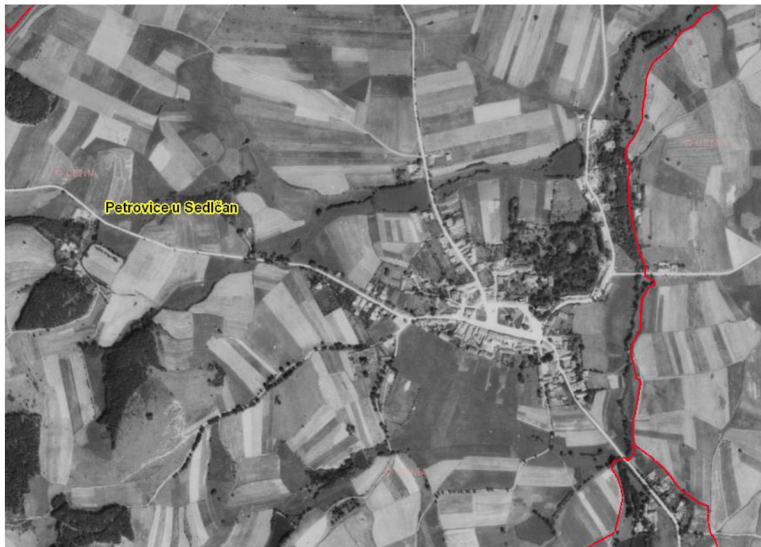
Obrázek 4 – Historický snímek krajiny v okolí obce Petrovice u Sedlčan z roku 1953 Převzato z online archivu Zeměměřického úřadu, dostupné na https://ags.cuzk.cz/archiv/