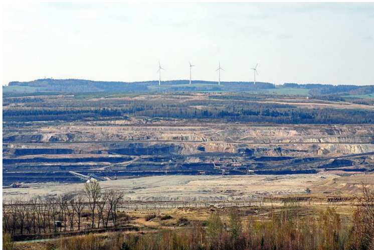
Obrázek 5 – Povrchový uhelný lom, Sokolovsko

případě přichází v úvahu navezení nového, úrodného horizontu (Petřík a kol., 2017; Řehounek a kol., 2010).