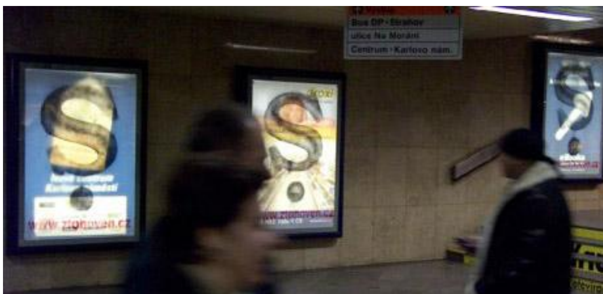
Obrázek 19: Znásilnění podvědomí, ZTOHOVEN