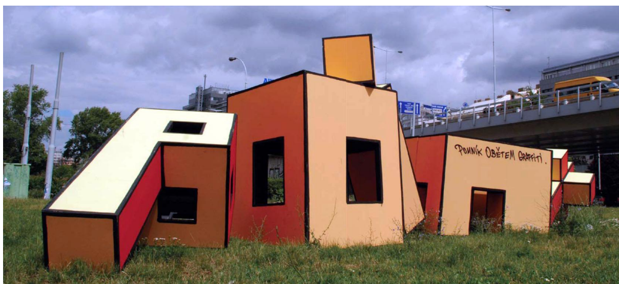
Obrázek 8: 3D instalace, Point, Jan Kaláb