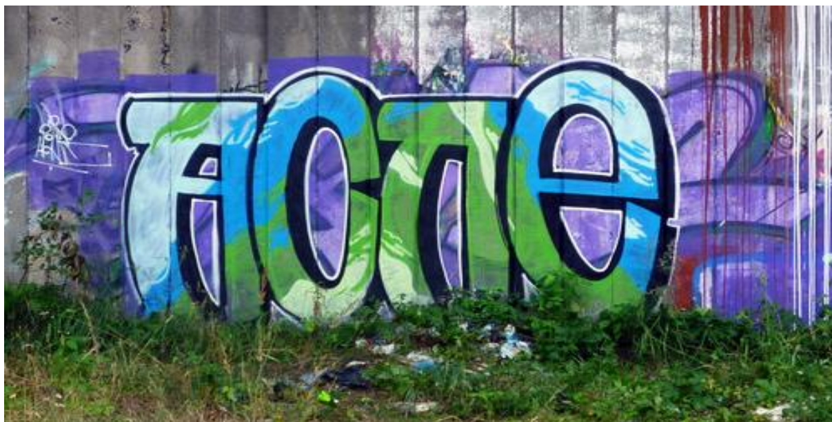
Obrázek 25: ACNE