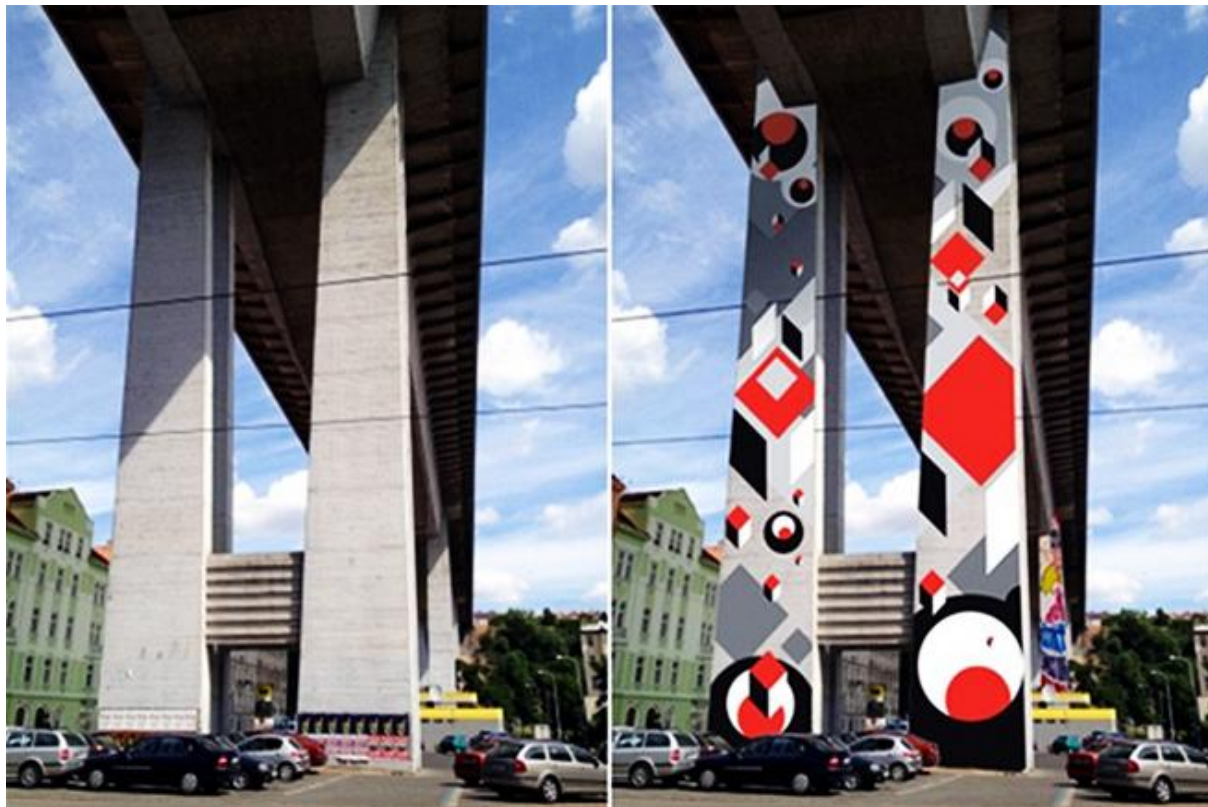
Obrázek 24: náhled pomalování jednoho z pilířů Nuselského mostu