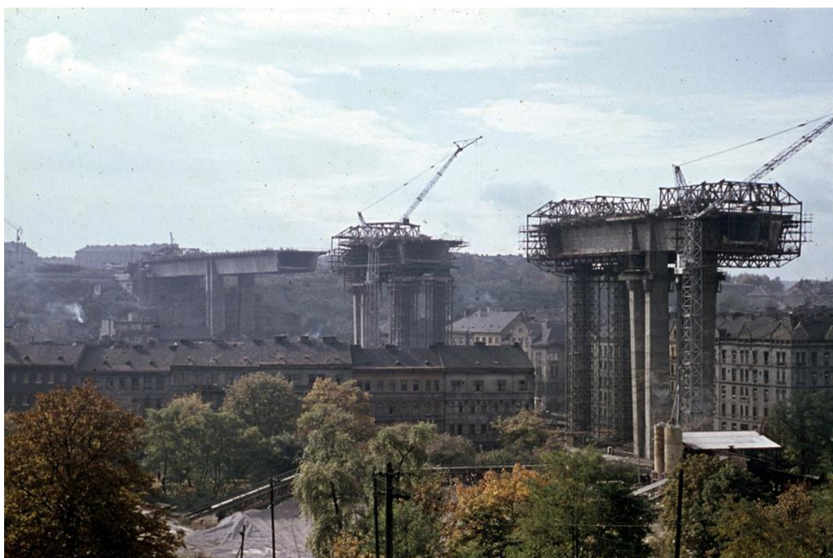
Obrázek 23: stavba Nuselského mostu