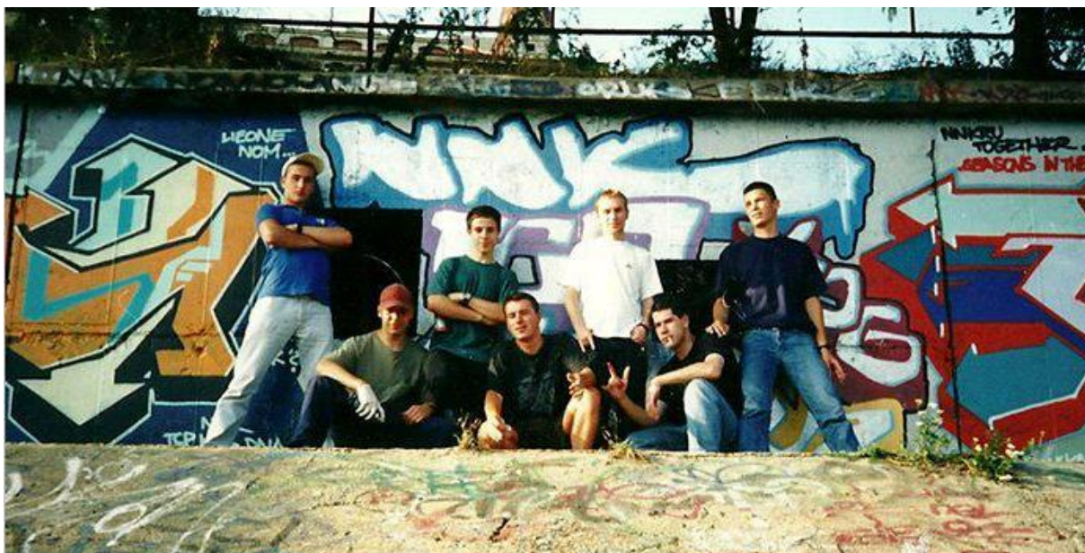
Obrázek 4: NNK crew (Nejvíc našťvaní kluci)

Zdroj: Martina Overstreet, In graffiti we trust, Praha 2006, s. 65