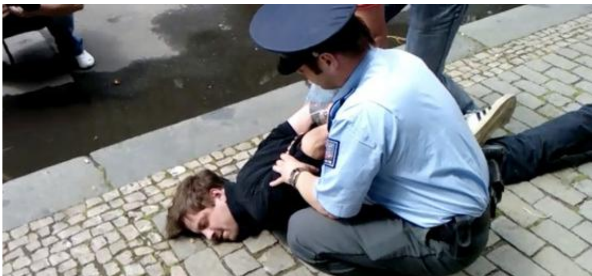
Obrázek 6: Roman Týc