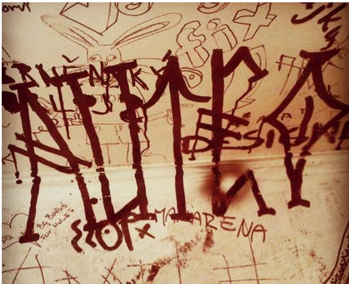
Obrázek 26: AUTEO

Auteo: „Myslím si, že u nás je velice malá základna lidí, kteří se street artu věnují a kvalitních věcí je u nás velice málo. Hodně street artistů se začalo spíše věnovat malováním obrazů a ulici se věnují už velice málo. A nová jména stále chybí. Jiné je to ovšem ve státech jako je USA nebo Německo, tam je to o hodně dál než u nás.“ 108