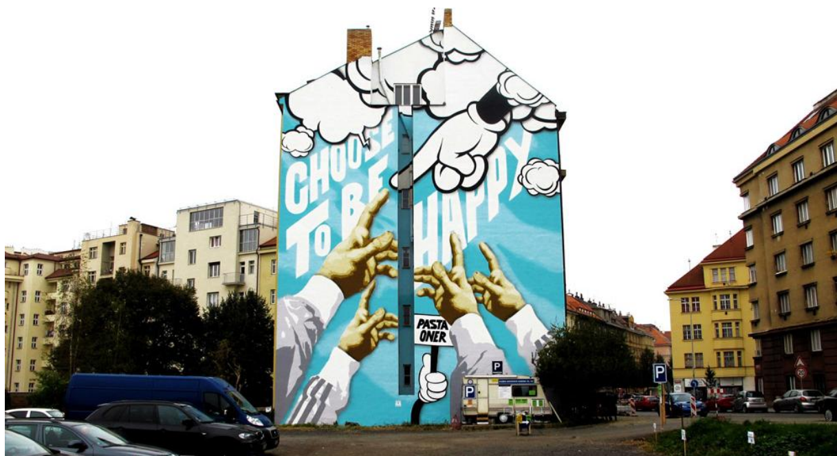
Obrázek 15: Choose to be happy, Zdeněk Řanda