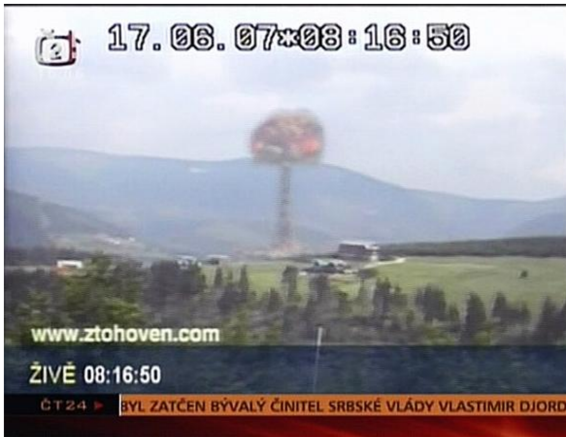
Obrázek 20: Mediální realita, ZTOHOVEN