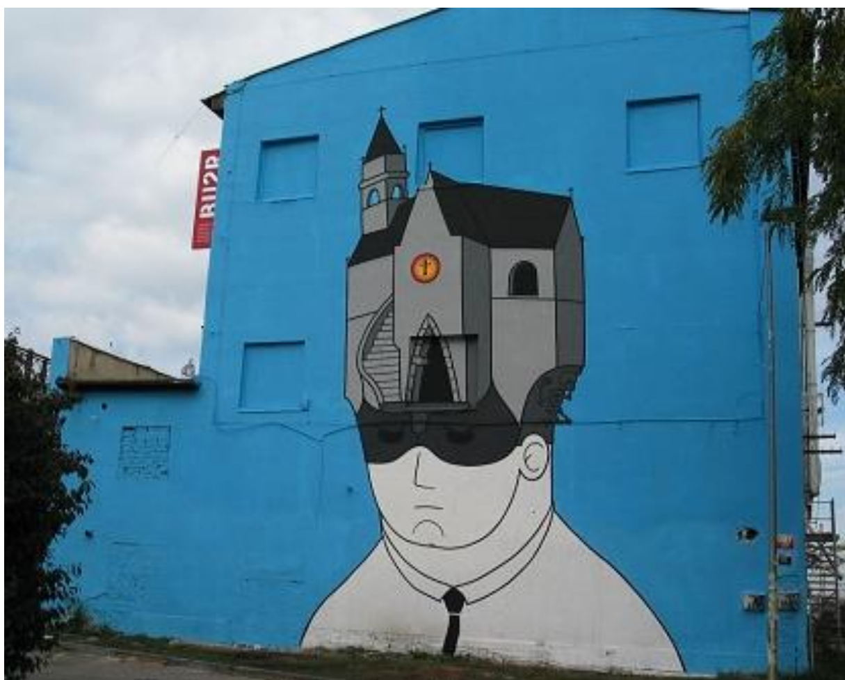
Obrázek 10: BU2R logo, malba Honet (FR), Meet Factory

Zdroj: KLÁRA VOSKOVCOVÁ – RADEK WOHLMUTH – VLADANA RÝDLOVÁ. MĚSTEM POSEDLÍ: Katalog k výstavě. Praha: Taktum s. r. o., 2012