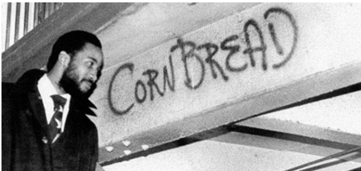
Obrázek 2: Corn Bread