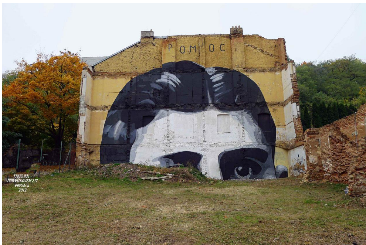
Obrázek 9: Franz Kafka, ESCIF (ES)

Zdroj: KLÁRA VOSKOVCOVÁ – RADEK WOHLMUTH – VLADANA RÝDLOVÁ. MĚSTEM POSEDLÍ: Katalog k výstavě . Praha: Taktum s. r. o., 2012