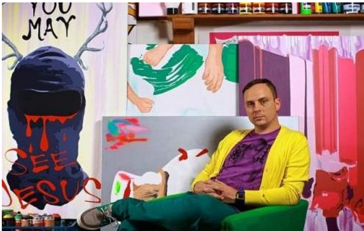
Obrázek 22: Pasta Oner