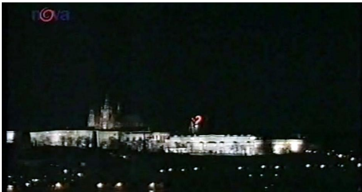
Obrázek 18: Otazník nad hradem, ZTOHOVEN