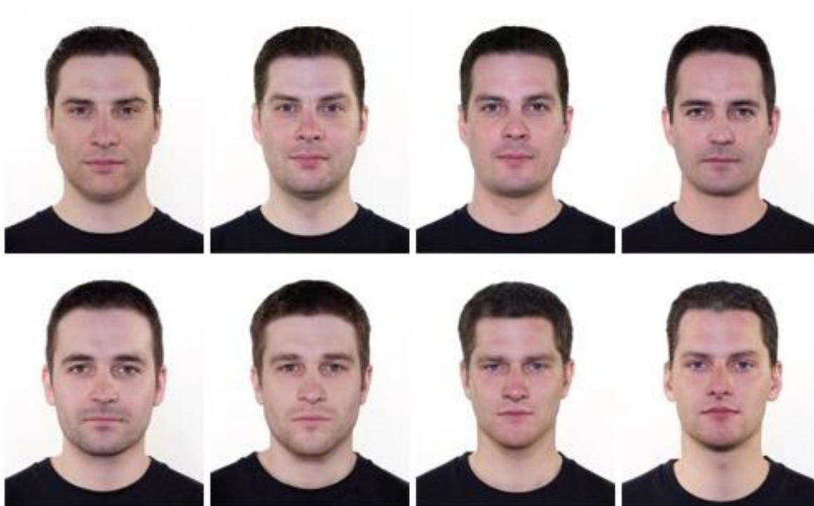
Obrázek 17: ZTOHOVEN