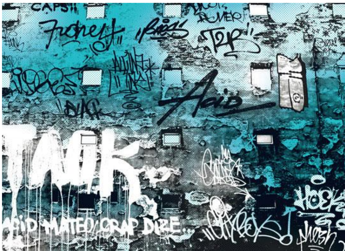
Obrázek 7: Bombing

Zdroj: 518,, Vladimír. Bigg Boss: --vás zavede půl miliardy let daleko od vašich myslí--místo: graffiti Praha = An epic drama of adventure and exploration 2666 Praha Odyssey. Praha. Labyrint, 2006, 11 s.