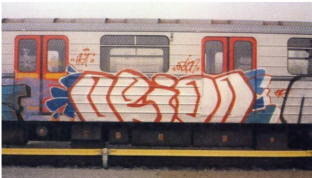
Obrázek 5: Metro, ORION