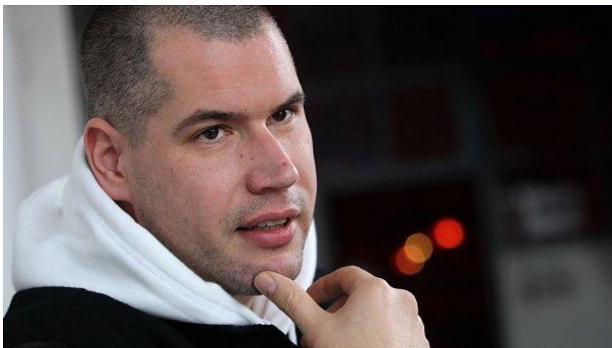
Obrázek 21: Vladimír 518