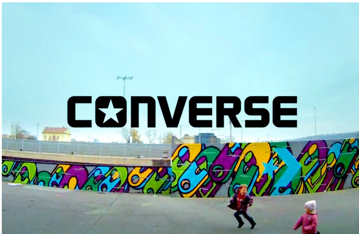
Obrázek 11: Video, WALL TO WALL Praha, Nick Zipper

Zdroj: Wall to wall Praha. WALL TO WALL [online]. [cit. 2013-03-17]. Dostupné z: http://www.bngr.cz/wall-to-wall-praha-1-video/