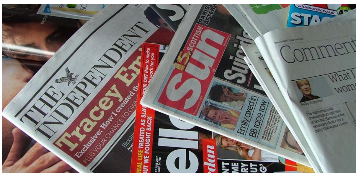
Obrázek 1: Tištěná média