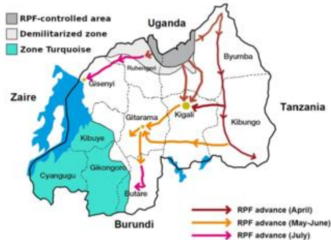
Mapa 2: Postup jednotek RPF při osvobození Rwandy v roce 1994