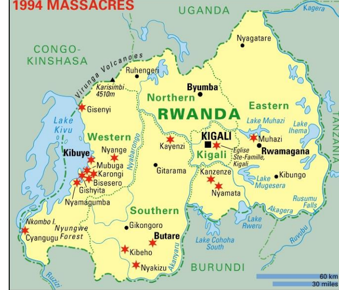
Mapa 1: Místa největších masakrů během genocidy v roce 1994