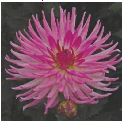
Obrázek 9. Kaktusovité

Kaktusovité jiřiny mají plné úbory z paprskovitě složených jazykovitých květů, které bývají dlouhé a špičaté. Tyto jazykovité květy jsou po celé či po většinu své délky svinuty směrem dolů. Kaktusovité jiřiny lze ještě dále dělit na pavoukovitý typ, kdy konce jazykovitých květů mohou být i zahnuté. A ještě na parořnatý typ čili fimbria, kdy mohou být na konci roztřepené (Baroš et al. 2017).