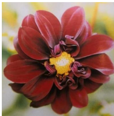
Obrázek 2. Pivoňkovité

Tento typ se vyznačuje poloplným květenstvím a skládá se ze dvou nebo více řad jazykovitých květů, které mohou být rovné nebo mírně zvlněné. Součástí úboru je také středový terč (Baroš et al. 2017).