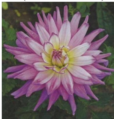
Obrázek 10. Semikaktusovité

Semikaktusovité jiřiny mají plné úbory z paprskovitě složených jazykovitých květů, které bývají dlouhé a špičaté. Jelikoř jsou jazykovité květy svinuté dolů jen v koncové části, tak jazykovité květy bývají širší (Baroš et al. 2017).