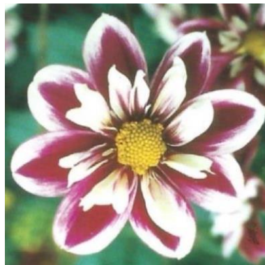
Obrázek 4. Náhrdelníkovité

Úbor tohoto typu se skládá ze dvou řad jazykovitých květů různé velikosti a dále ze středového terče. Tyto dvě řady tvoří prstence, kdy vnější prstenec je delší a vnitřní je menší. Vnitřní prstenec svým tvarem připomíná náhrdelník. Prstence mají často odlišné barvy (Baroš et al. 2017).