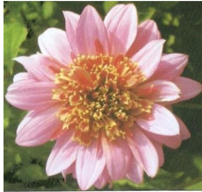
Obrázek 3. Anemonkovité

Anemonovité úbory jsou tvořeny jednou vnější řadou plochých jazykovitých květů, které doplňuje husté okružní trubkovitých květů umístěných ve středu. Prašníky jsou kratší než trubkovité květy (Baroš et al. 2017).