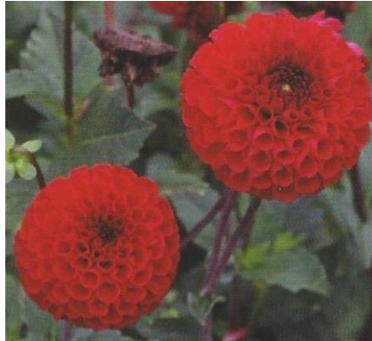
Obrázek 7. Pomponky

Pomponkovité jiřiny se podobají kulovitým typům. Mají opět plné úbory kulovitého tvaru, které ale mohou být velké maximálně do 6,5 cm v průměru. Jazykovité květy jsou velmi krátké, svinuté, případně mohou být až rourkovité (Baroš et al. 2017).