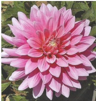
Obrázek 8. Leknínovité

Mezi znaky leknínovitých jiřin patří plné úbory, které jsou pravidelné. Tyto úbory nejsou moc husté a jazykovité květy jsou delší a rovné (Baroš et al. 2017).