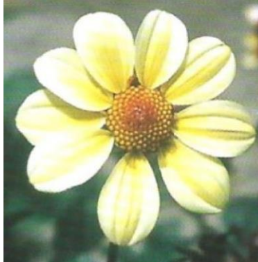
Obrázek 1. Jednoduché

Jedná se o jednoduše kvetoucí úbory, které mívají jen jednu řadu jazykovitých květů. Obvykle jich je kolem osmi. Terč je tvořen středovými trubkovitými květy (Baroš et al. 2017). Jazykovité květy mohou mít různý tvar od zaobleného po špičatý (Benzakein et al. 2021).