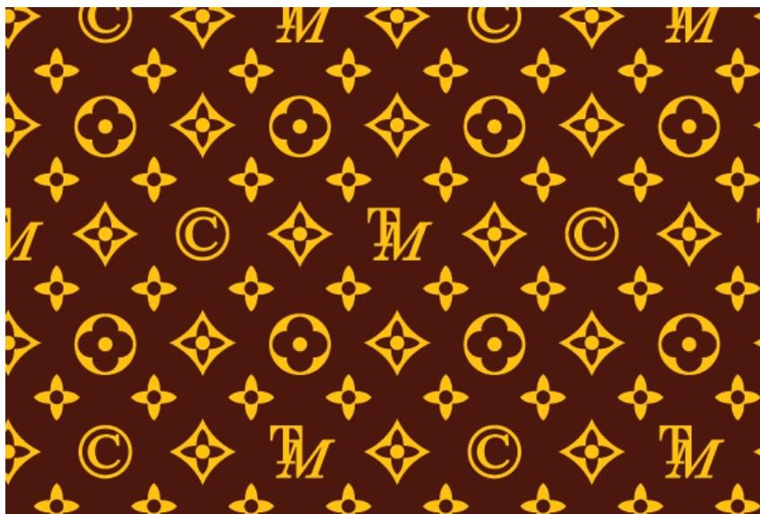
Obrázek 3: Netradiční ochranná známka – poziční. [Online]. [cit. 2024-02-03]. Dostupné z: https://madisonian.net/2012/03/04/really-louis-vuitton/