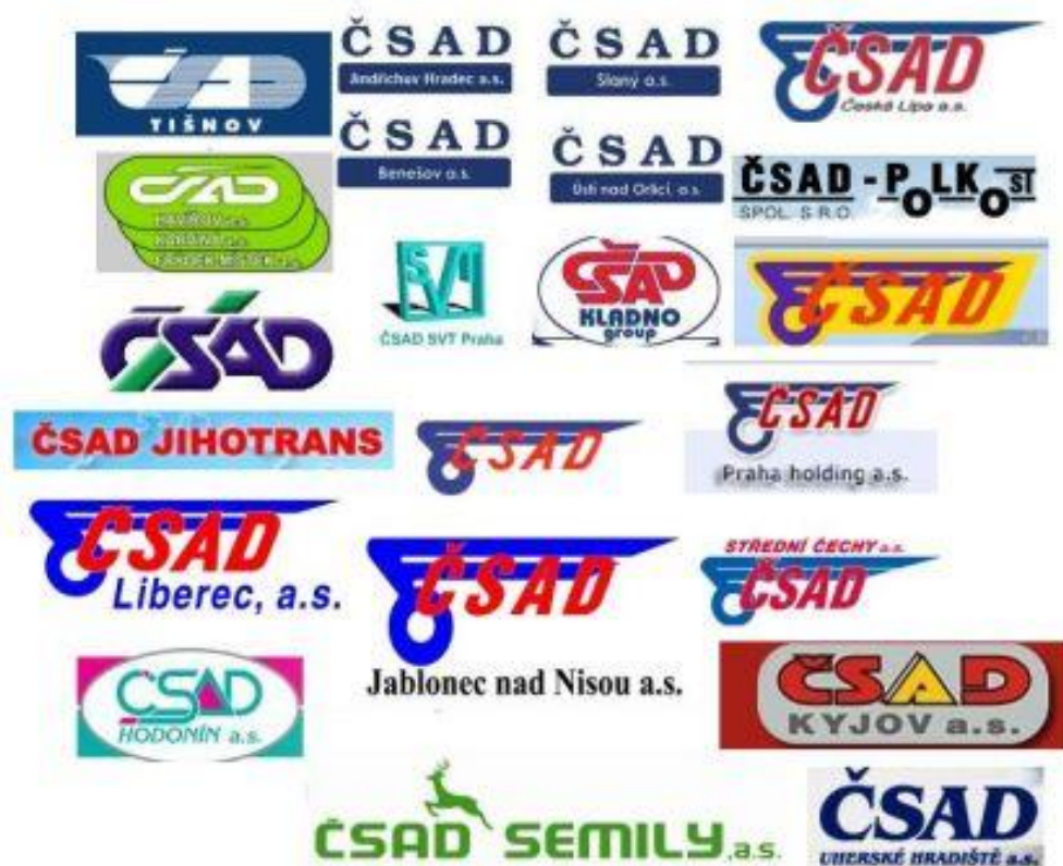
Obrázek 5 – Kolektivní ochranná známka s příkladem různých společností“ ČSAD“. [Online]. [cit. 2024-02-03]. Dostupné z: https://www.busportal.cz/clanek/60-let-csad-1-1-1949-byly-zrizeny-narodni-dopravni-podniky-5712 .