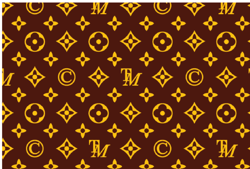
Obrázek 3: Netradiční ochranná známka – poziční. [Online]. [cit. 2024-02-03]. Dostupné z: https://madisonian.net/2012/03/04/really-louis-vuitton/