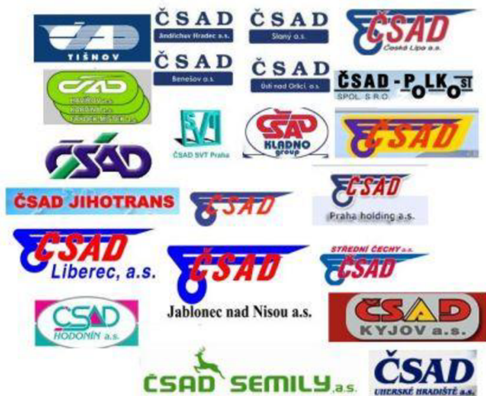
Obrázek 5 – Kolektivní ochranná známka s příkladem různých společností“ ČSAD“. [Online]. [cit. 2024-02-03]. Dostupné z: https://www.busportal.cz/clanek/60-let-csad-1-1-1949-byly-zrizeny-narodni-dopravni-podniky-5712 .