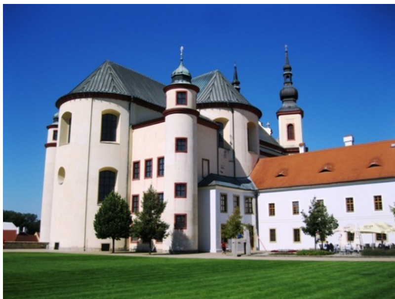
Obrázek 3 - Piaristický kostel