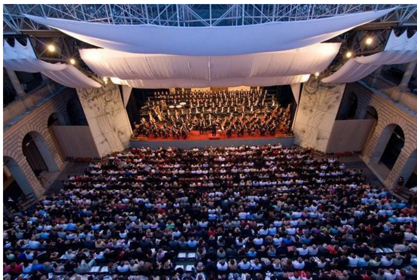
Obrázek 7 - Plné hlediště festivalu Smetanova Litomyšl