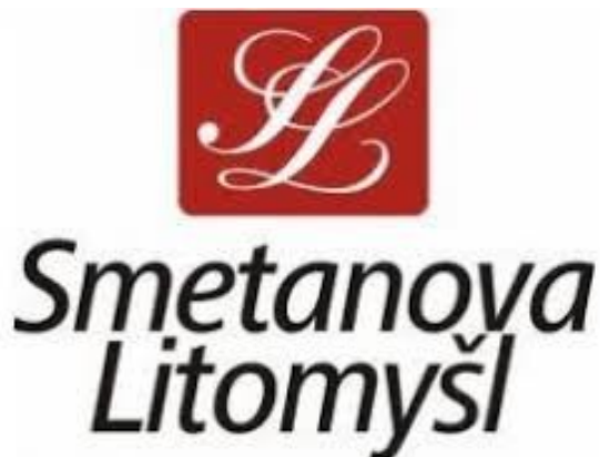
Obrázek 11 - logo festivalu Smetanova Litomyšl