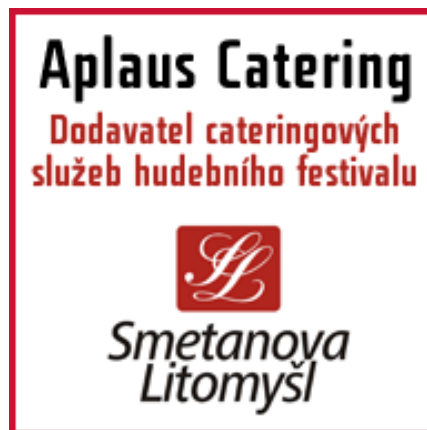
Obrázek 9 - Hotel Aplaus - catering festival