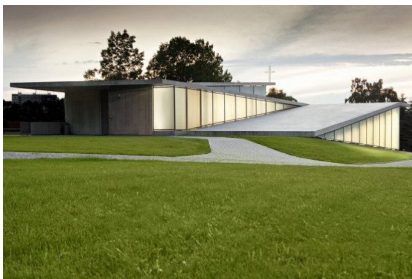
Obrázek 6 - Kostel Církve bratrské