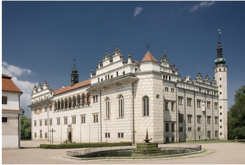
Obrázek 1 - Zámek Litomyšl