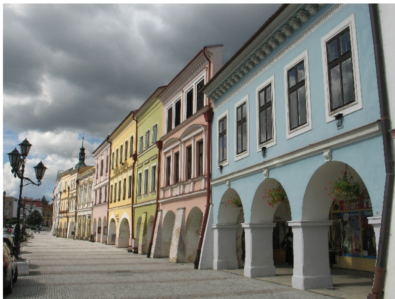
Obrázek 5 - Smetanovo náměstí v Litomyšli