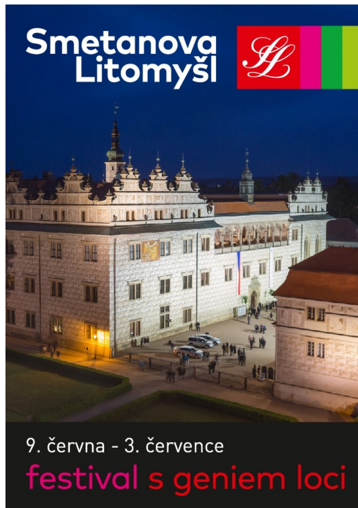
Obrázek 10 - fotografie podporující genius loci