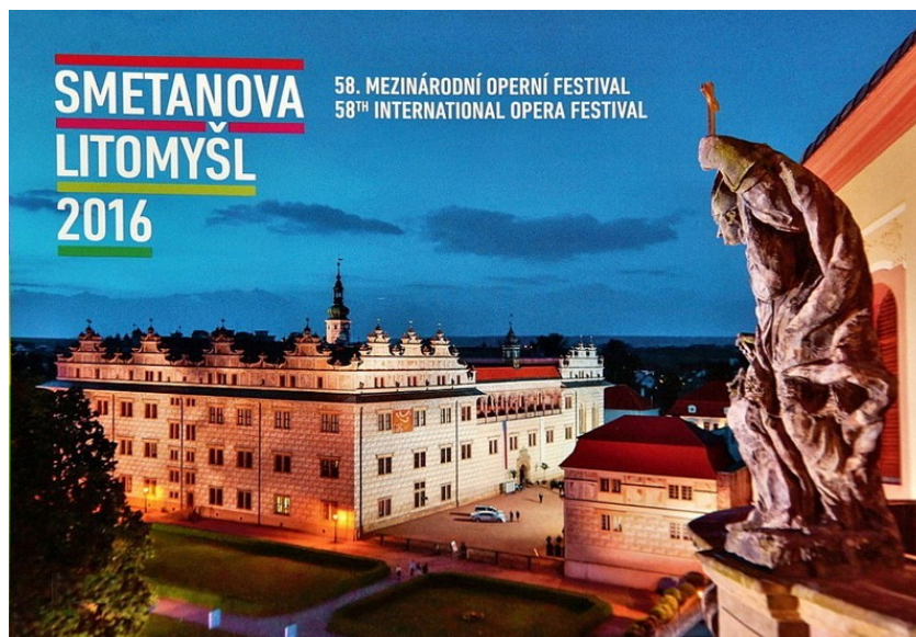
Obrázek 8 - Úvodní fotografie pro FL