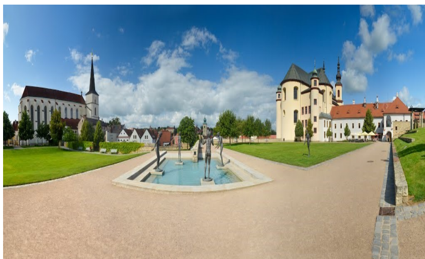
Obrázek 4 - Klášterní zahrady