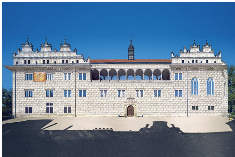
Obrázek 2 - Zámek Litomyšl