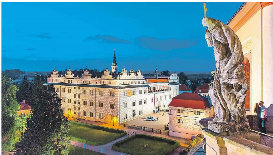
Renesanční perla Z nedávno obnoveného piaristického chrámu Nalezení svatého Kříže je krásná vyhlídka na renesanční zámek, který byl v roce 1999 zapsán na Seznam světového kulturního a přírodního dědictví UNESCO. Na jeho druhém nádvoří se odehrává většina koncertů.

Smetanova Litomyšl, druhý nejstarší hudební festival v zemi, nabídně během pětadvaceti dní na přelomu června a července 35 pořadů, včetně osmi operních titulů od Verdiho Traviaty po Smetanovu Hubičku. Předprodej vstupenek začíná za dvanáct dní, v den výročí narození nejslavnějšího litomyšlského rodáka, ve středu 2. března.