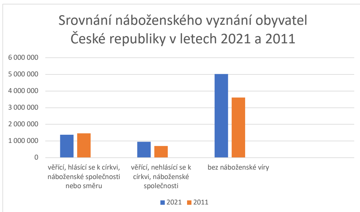
Obr. 5.2: Srovnání náboženského vyznání obyvatel České republiky v letech 2021 a 2011

Zdroj: Náboženská víra. Sčítání 2021 [online] 67