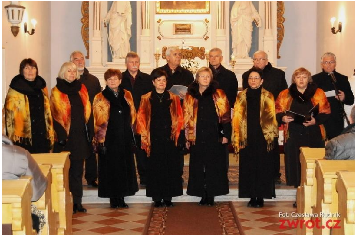
Příloha 6: adventní koncert TA Grupy v Orlové 2016