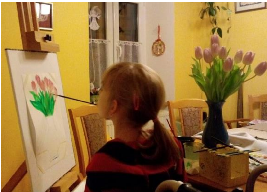
Příloha VI. Tulipány

V této malbě Barča zachycovala zátiší tulipánů. Pracovní pomůcky byly papír, tužka, štětce, speciální nástavce a stojánky na štětce, akrylové barvy a malířský stojan.