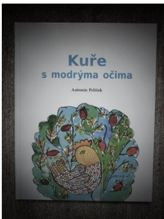
Příloha I. Ilustrace knihy