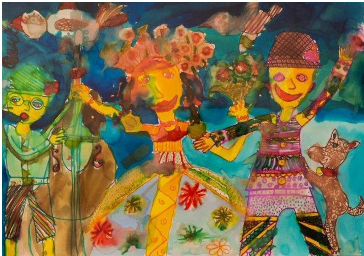
Příloha IV. Lidové tance