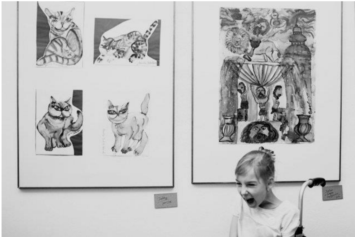
Příloha VII. Sladovna