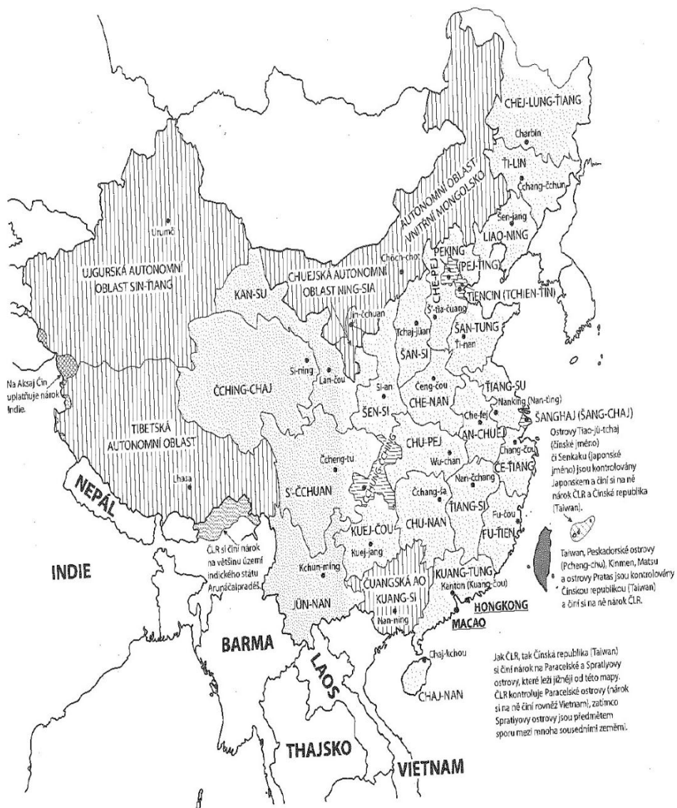
Obrázek 2 Mapa Čínské lidové republiky, zdroj: Liščák 2008. (přední předsádka)