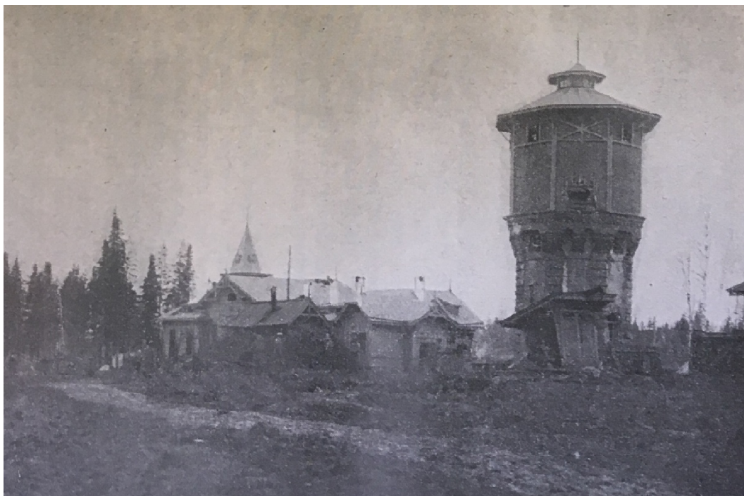
František VLÁČIL, Slezský pluk: Stručná kronika 8. čs. Slezského pluku , s. 43