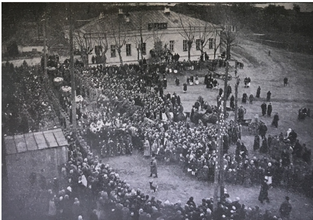
František VLÁČIL, Slezský pluk: Stručná kronika 8. čs. Slezského pluku , s. 39