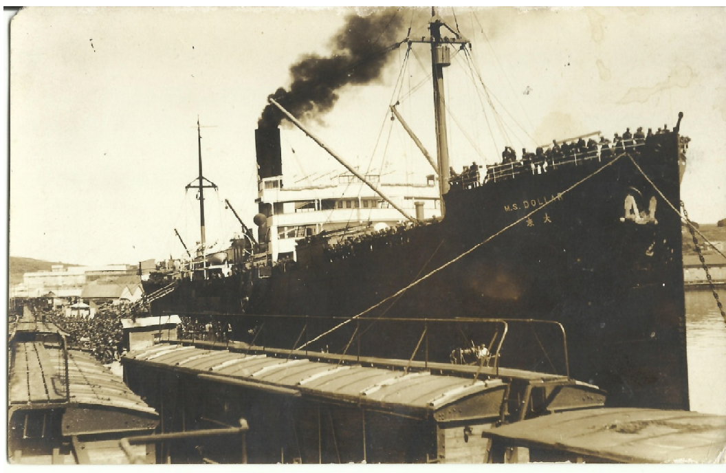
František VLÁČIL, Slezský pluk: Stručná kronika 8. čs. Slezského pluku , s. 65