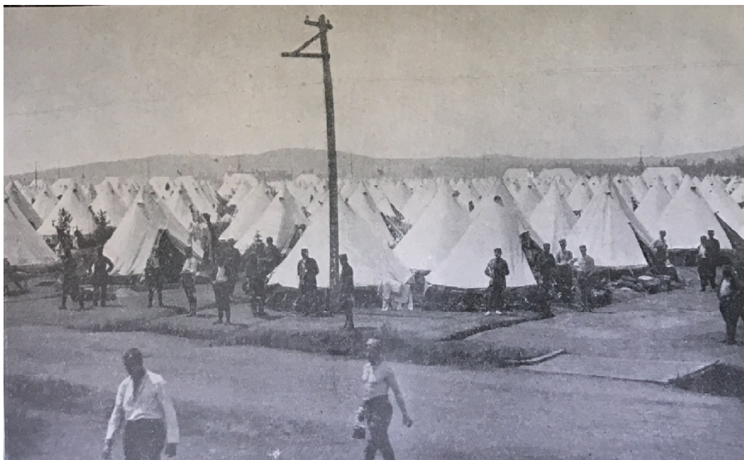
František VLÁČIL, Slezský pluk: Stručná kronika 8. čs. Slezského pluku , s. 69