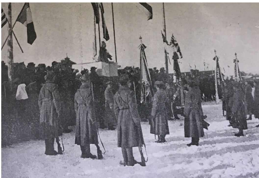
František VLÁČIL, Slezský pluk: Stručná kronika 8. čs. Slezského pluku , s. 47