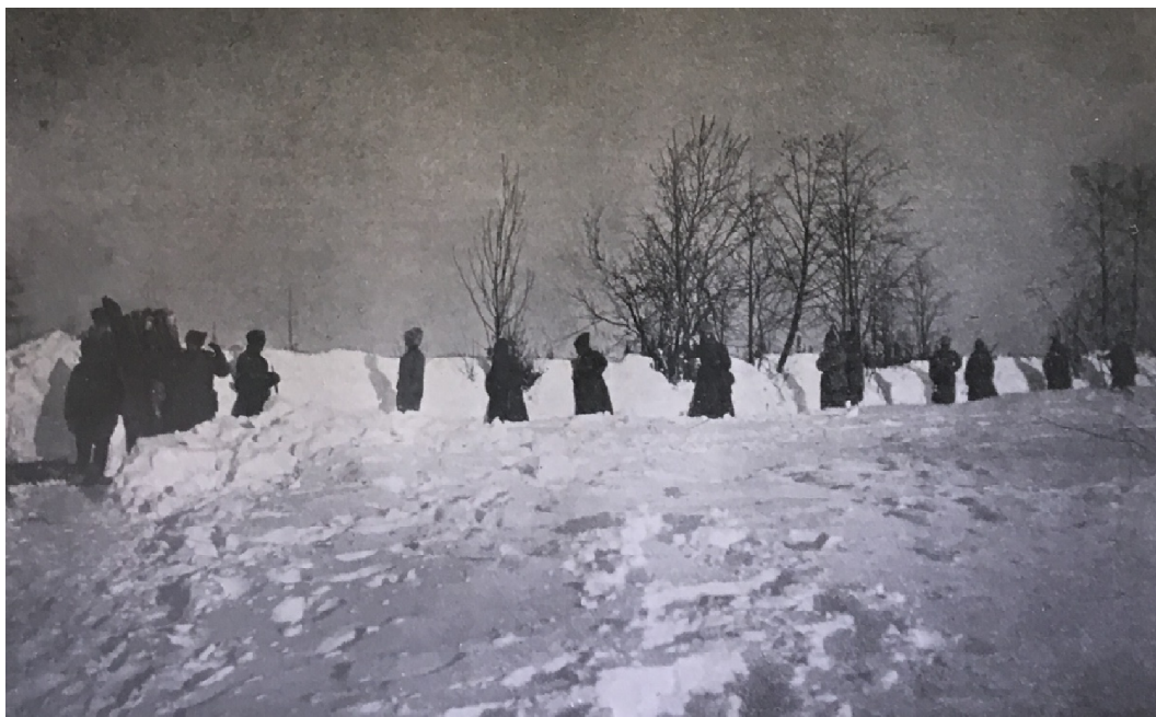
František VLÁČIL, Slezský pluk: Stručná kronika 8. čs. Slezského pluku , s. 52