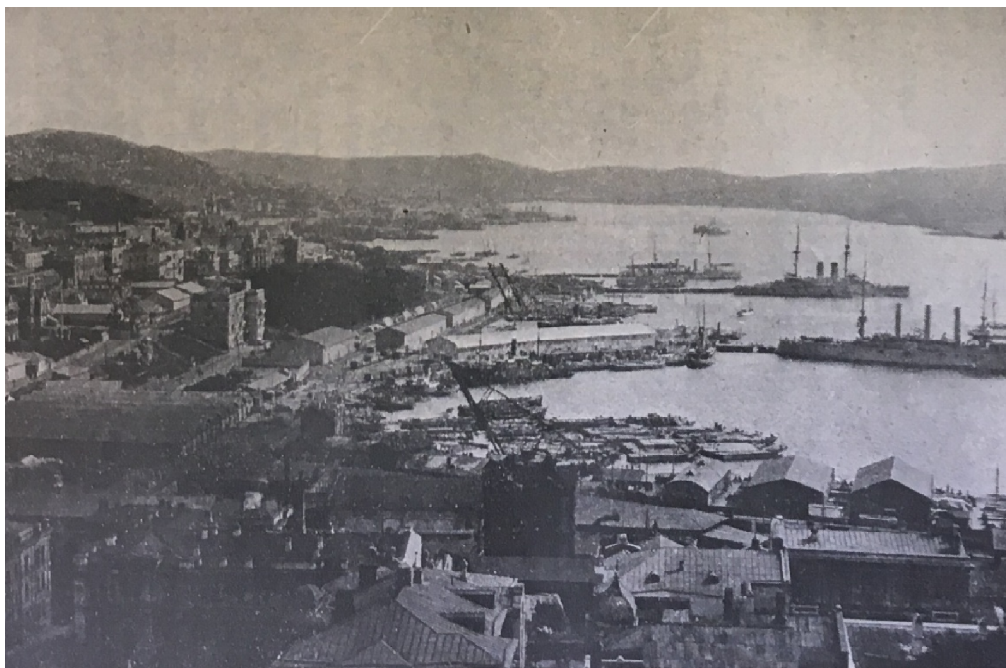
František VLÁČIL, Slezský pluk: Stručná kronika 8. čs. Slezského pluku , s. 27