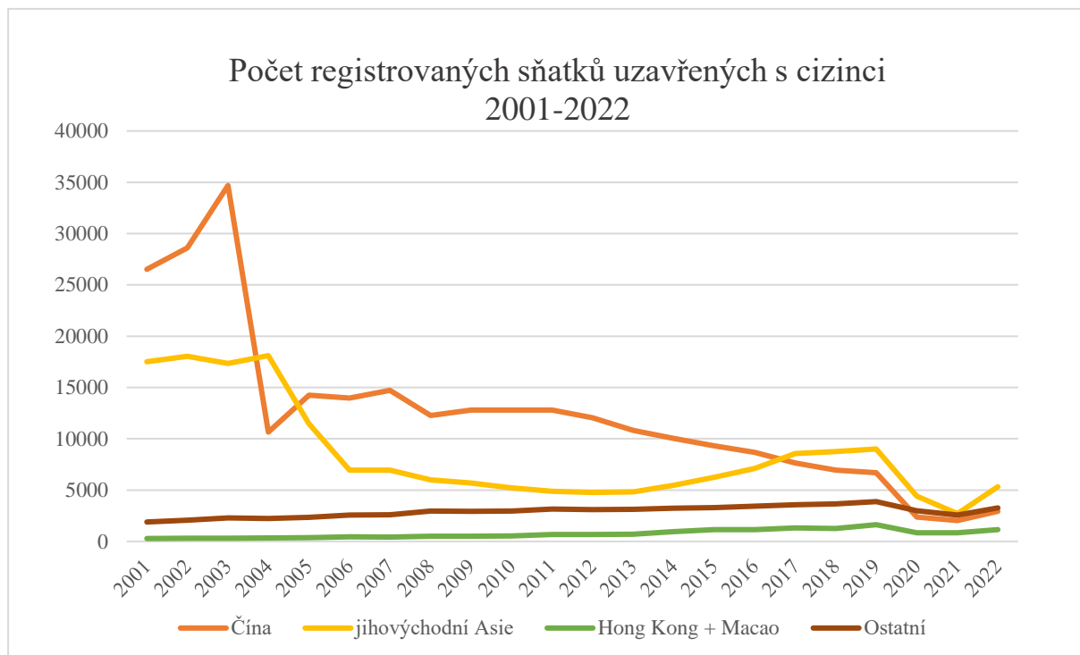
Graf 2 Počet registrovaných sňatků uzavřených s cizinci (2001-2022)