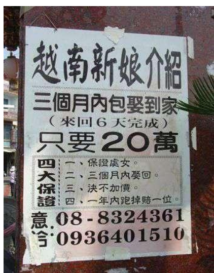
Obrázek 1: Plakát inzerující sňatek s vietnamskými nevěstami