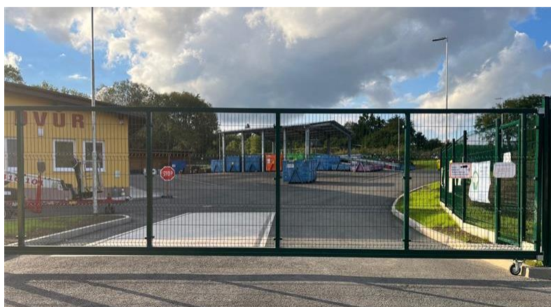
Obr. 6 Sběrný dvůr Jílové u Prahy (Jilove 2023)

Sběrný dvůr disponuje nově zakoupeným paketovacím jednokomorovým lisem, který zpracovává plast a papír. Dále byl zakoupen štěpkovač a páračka na kabely. Cílem zakoupení těchto strojů je minimalizovat vznik odpadu, snižovat jejich objem a znovuvyužití materiálů. Navíc takto vzniklé suroviny představují pro město zisk.