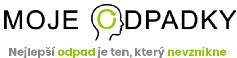
Obr. 12 Moje odpadky (Mojeodpadky 2023)

Každý listopad daného roku, pak mohou občané podávat stížnosti, či reklamace a žádat o doplnění EKO bodů, které jim nebyly z nějakého důvodu přičteny. Pokud tak místní neudělají, nebude pak později na jejich reklamace brán zřetel (Pravidla k MESOH ve městě Jílové u Prahy 2019).