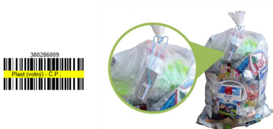
Obr. 10, 11 Příklad čárového kódu a možnost umístění kódu (Pravidla MESOH 2019)

Druhým opatřením bylo zavedení evidenčního systému. Tímto způsobem mohou referenti odpadového hospodářství a jejich týmy sledovat množství vyprodukovaného odpadu v jednotlivých domácnostech a případně zakročit a vysledovat nedostatky třídění a množství odpadu. K tomu se zavedly jedinečné čárové kódy, které se po naskenování zaměstnanců města propojí pomocí čtečky s účtem dané domácnosti, který má zaregistrovaný na mojeodpadky.cz. Tyto čárové kódy, které obsahují informace o množství odpadu (v litrech), o jakou komoditu se jedná a informace o dané domácnosti, se zavěsí na odpadkový pytel, který se umístí před dům.