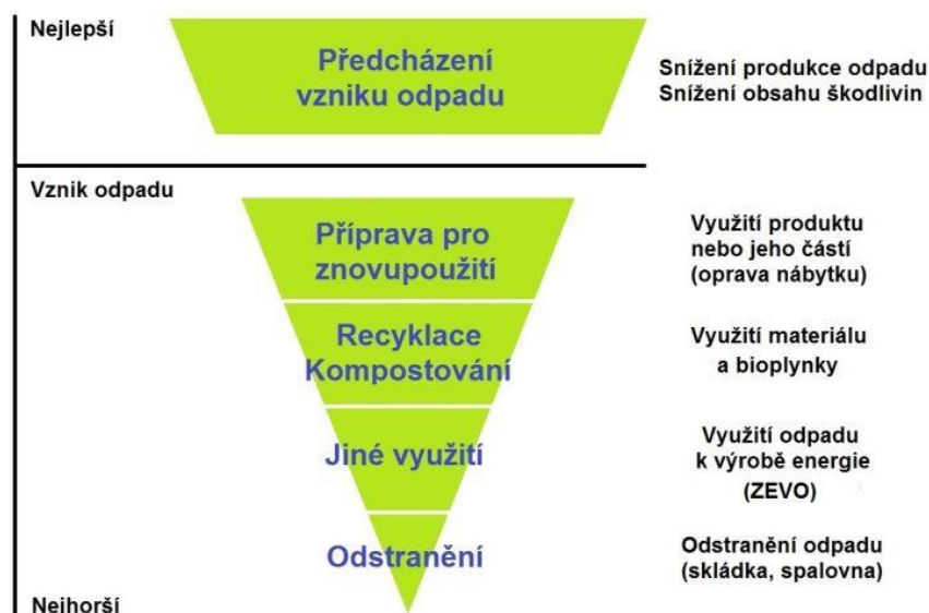
Obr. 1 Hierarchie nakládání s odpady (Arnika 2023)

Hierarchie nakládání s odpady se skládá z pěti hlavních bodů, které jsou pak dále rozvinuty a každý původce odpadu má zákonnou povinnost tyto body dodržovat, respektovat a postupovat podle nich.