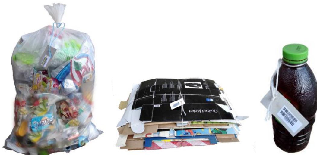
Obr. 7, 8, 9 Možnosti umisťování plastu, papíru, oleje (Pravidla MESOH 2019)

větších rozměrů, jako např. plastové bedny na ovoce nebo třeba kýble je možné umístit samostatně před dům. Papír je možné též uložit do pytlů, ale v Jílovém se osvědčilo papír ukládat do použitých papírových tašek, nebo ho sešlápnout a svázat provázkem. Takový to balík musí mít na výšku alespoň 30 cm, aby se využila maximální zaplněnost. Jedlý olej a tuk je umisťován do použitých plastových nádob, např. od šťávy. Tyto nádoby musí být řádně uzavřeny. Kovy se sbírají do použitých plastových tašek. Kovy znečištěné nebezpečnými látkami do tohoto pytle nepatří. Kartony od nápojů, např. od mléka nebo džusu, se sbírají do libovolné igelitové nebo papírové tašky. Elektrozařízení menších rozměrů se umisťují opět do igelitových nebo papírových tašek.