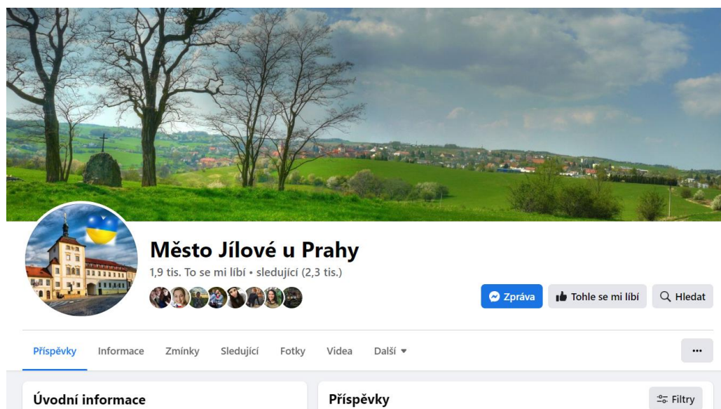
Obr. 19 Facebooková skupina města Jílové (Facebook 2023)

Tento systém komunikace s občany, jakožto jedno z hlavních informačních vláken má pozitivum především po finanční stránce. Tato komunikace bude pro město představovat nulový finanční vklad.