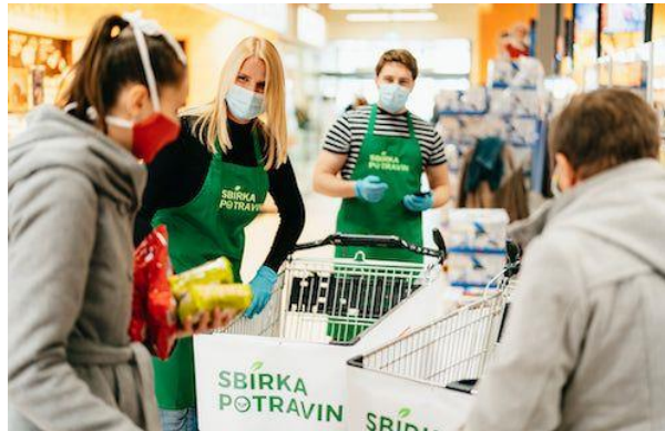
Obr. 5 Potravinová banka (Potravinovebanky 2023)

Enviromentální výchova úzce souvisí i s dobrovolnickou prací. Jednotlivé organizace se zaměřují na rozmanitá témata a snaží se držet trendu v předcházení vzniku odpadu. Jedná se o potravinové banky, sbírky oblečení, reuse centra apod. V současné době nemůžeme přesně říct, kolik oblečení, nebo dalších věcí je vybráno, roztrženo a případně darováno z důvodu velmi rozmanitého sortimentu (MŽP 2014).