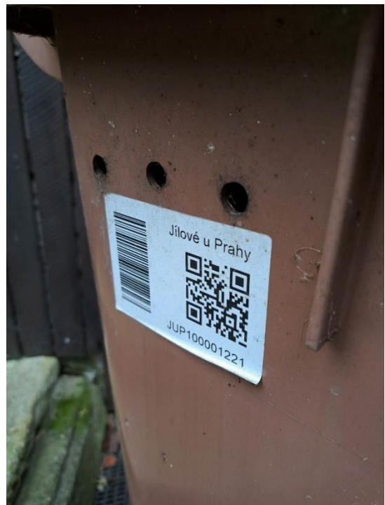
Obr. 16, 17 Hnědá popelnice na bioodpad a kód na popelnici