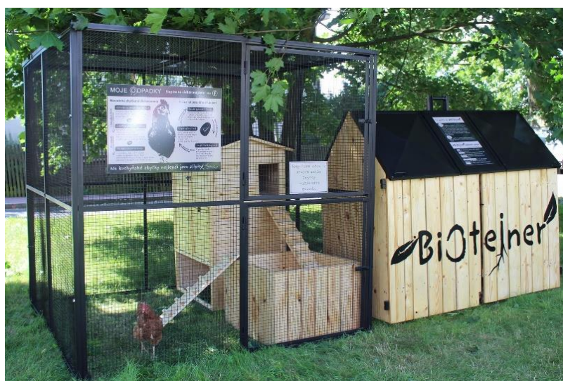
Obr. 14 Biotejnér s kurníkem (Mojeodpadky 2021)

Právě zbytky živočišného původu přilákaly hlodavce, kteří využívají BIOtejněry ke stavbě svých hnízd. Následky přemnožení mohou být katastrofální. Dochází zde pak k úzkému kontaktu mezi lidmi a hlodavci, což může mít vliv na zvýšení přenosu zoonóz, jako je Leptospira nebo Yersina pestis (Feng 2013). Přestože mají BIOtejněry ochranou síť z kovu s jemnými očky podél všech stran včetně dna, tak hlodavci jako jsou krysy a potkani, se mohou do nádoby dostat vrchním víkem, pokud nedojde ke správnému uzavření.