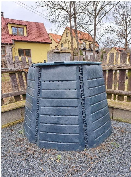
Obr. 13 Domácí kompostér

Kompostéry jsou zavedeny na systému dlouhodobého propůjčení od města, kdy daný kompostér můžou občané případně vrátit. Tento projekt je pro obyvatele města zcela zdarma. V současné době se referent odpadového hospodářství zabývá myšlenkou posílení tohoto projektu a zasílá dotazníky občanům, zda by byly o další domácí kompostéry zájem, tak aby se mohlo dostat na všechny, kteří by rádi s kompostováním začali.