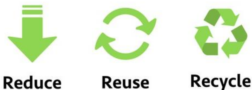
Obr. 3 Reduce, reuse, recycle

90. léta znamenala pro předcházení vzniku odpadu velký zlom. Průmyslové podniky nově neřeší, jak se vzniklým odpadem nakládat, ale jak mu předcházet přímo v místě výroby. S tím přišlo i úsilí snížit nebezpečnost složek na minimum a zároveň snižovat objem (Kuraš 2008). Problém s odpadem zaznamenalo i mnoho měst, která začala hledat i jiné metody likvidace odpadu, než jenom skládkování a spalování. Recyklace byla sice, již celkem zaběhlá, ale nepředstavovala bezchybné řešení. Předcházení vzniku odpadu, se tak stalo ideální vyhlídkou do budoucnosti. Zbytečné obaly, jako jsou obaly na jídlo s sebou, jednorázové baterie, tašky, fotoaparáty, reklamní letáky a spoustu dalších by představovaly seznam produktů, které by představovaly reálné mety při prevenci vzniku odpadu. Agentury životního prostředí a místní vlády v celosvětovém měřítku, tak umístili předcházení vzniku odpadu na vrchol pyramidy hierarchie nakládání s odpady. Nově tak vznikla fráze REDUCE-REUSE-RECYKLE, tedy redukovat-opětovně používat-recyklovat (Bortoleto 2014).