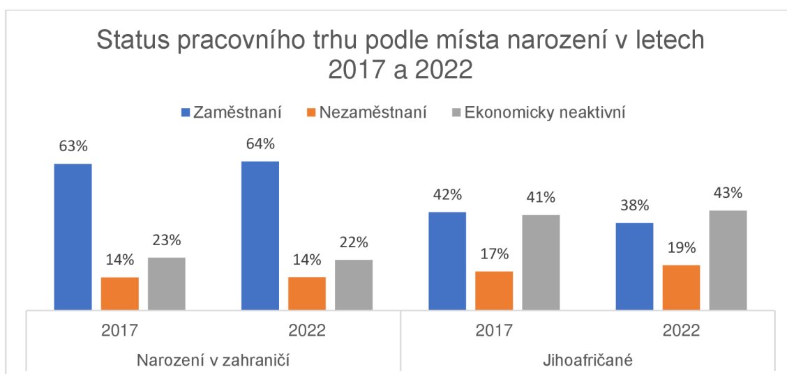
Graf 2: Stav pracovního trhu v Jihoafrické republice v letech 2017 a 2022

Zdroj dat: Statistics South Africa. 2022. Labour market dynamics in South Africa, 2022 . Pretoria: Statistics South Africa, 92.