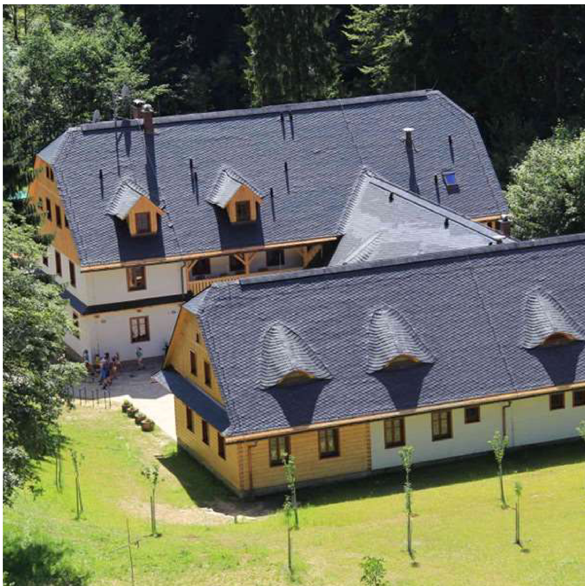
Středisko ekologické výchovy Švagrov, nedatováno