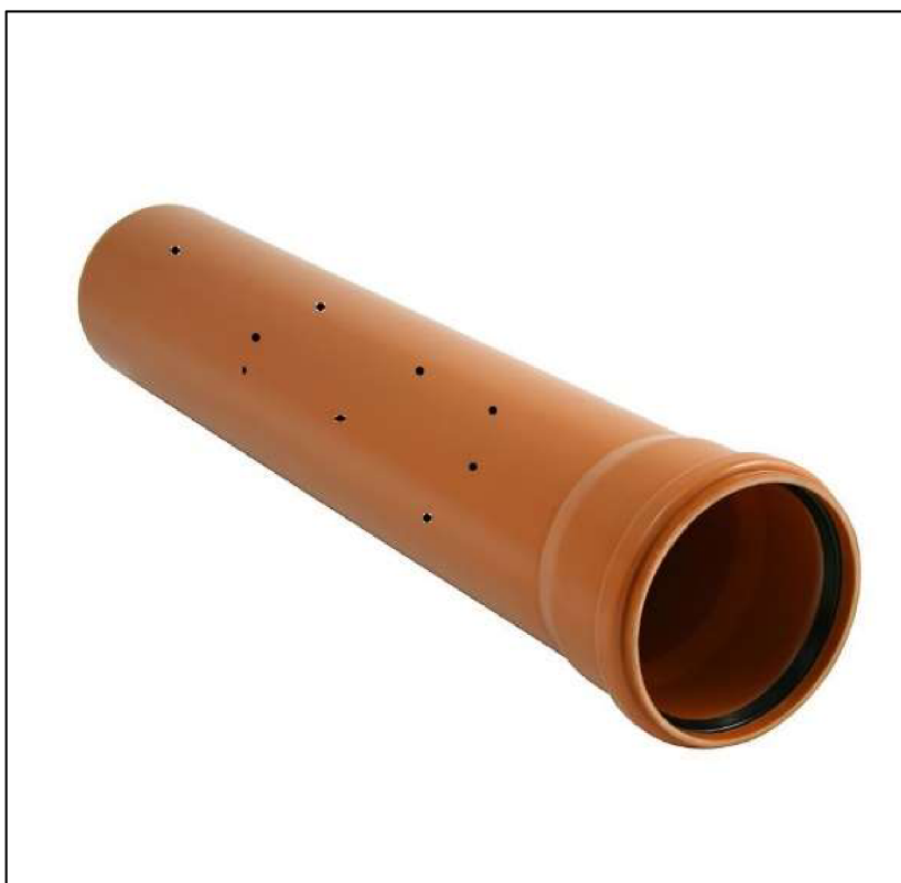
Příloha 10- děrovaná trubka