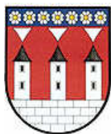
Obrázek 3 - Znak města Spálené Poříčí

Město dlouhodobě prosazuje tři hlavní priority – rozvoj školství, ochrana životního prostředí a obnova místních památek. V roce 1992 byl střed města prohlášen městskou památkovou zónou. Největší opravy prodělal renesanční zámek, budova barokního děkanství a lidový roubený domek čp.138. V roce 1996 město získalo „Statut Města“. Za obnovu památek získalo v roce 2004 prestižní ocenění Historické město České republiky roku 2003. Ocenění je o to významnější, že ho Spálené Poříčí získalo jako jediné v Plzeňském kraji. Může tak být srovnáváno i s ostatními městy, která toto ocenění získala, jako např. Český Krumlov, Znojmo, Prachatice, Kroměříž a další. Město má plnou občanskou vybavenost – je zde mateřská i základní škola, dům dětí a mládeže, střední škola s ekologickým a sociálním zaměřením, obchody, zdravotní středisko, pošta, sportoviště, několik restaurací, hotel a mnoho dalšího.