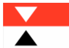
Obrázek 4 - Vlajka města Spálené Poříčí