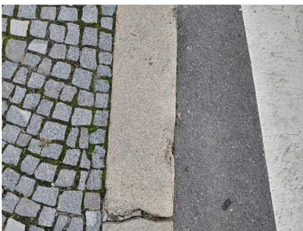
Obr. 16: Kamenná dlažba a beton na Náměstí Míru (Autor, 2023)

Na tomto náměstí jsou chodníky řešeny jak pomocí kamenné dlažby s širší spárou, tak pomocí betonu. Beton je zde použit nejen na pozemní komunikaci a parkoviště, ale i v pěší zóně. Problémem betonové zástavby ve vztahu k dešťové vodě je, že dešťová voda má v podstatě nulovou možnost vsakování v místě spadu, což zapříčiňuje její setrvání na betonovém povrchu bez dalšího využití a rovněž její odtok, v tomto případě, do kanalizace.