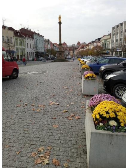
Obr. 10: Stromy a rostliny na Staroměstském náměstí

V horní části Staroměstského náměstí se nachází travnaté plochy spolu se vzrostlými stromy a keři. Komunikace je zde řešena rovněž kamennou dlažbou, jako na zbytku náměstí. V rámci celého náměstí se jedná o plochu, kde je nejvíce využívána dešťová voda, neboť se zde vsakuje právě přes travnaté plochy do půdy, která je tak přirozeně zavlažována. Menší vsakování dešťové vody je zde umožněno taktéž skrz kamennou dlažbu.