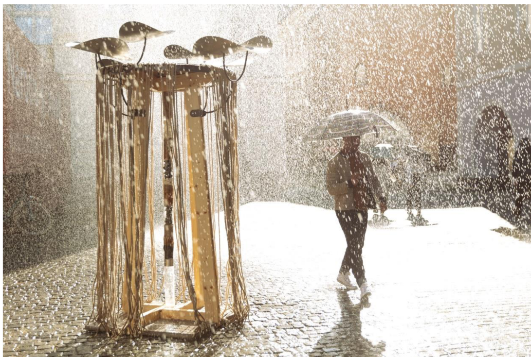
Obr. 24: Dešťová fontána Matyáše Baráka (Anna-Marie Křížová, 2023)

Udržitelné hospodaření s dešťovými vodami si klade za cíl zajistit odvodnění daného území takovým způsobem, aby byl v co nejvyšší míře obnoven přirozený vodní režim. Mezi základní cíle takového hospodaření patří například ochrana urbanizovaného území před zaplavením v důsledku přívalových srážek, prevence sucha, ochrana vodních zdrojů a s tím spojená ochrana jakosti vody. Pokud v rámci hospodaření s dešťovými vodami dochází i k propojení s vegetací (modrozelená infrastruktura), zvyšuje s tím kvalita urbanizovaných území, a to například zlepšením klimatických podmínek, biodiverzity či estetických a dalších ekosystémových služeb (Stránský et al., 2021). Hospodárná úprava náměstí vyžaduje finanční investice, což mnohdy vede k nerealizaci projektů. Jednou z možností je spolufinancování takovýchto projektů Evropskou unií. Jako příklad můžeme uvést úpravu náměstí v Sepekově. Projekt byl dotován Evropskými strukturálními a investičními fondy v rámci Operačního programu Životního prostředí. Účelem dotace byla obnova stávající zeleně a zakládání nové veřejné zeleně v městysi Sepekov. Součástí realizace projektu došlo i k ošetření dřevin a jejich další výsadbě, instalaci mobiliáře a založení trávníku v zastavěném území obce. Náklady na realizaci tohoto konkrétního projektu činily 539 254,- Kč, přičemž dotace z Evropské unie byla ve výši 323 552,40 Kč, což odpovídá 60 % z celkové výše nákladů (Koutník, 2024).