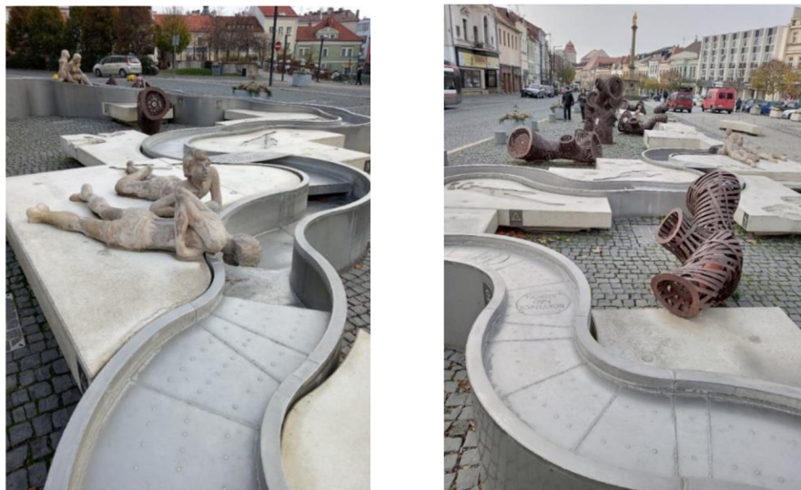
Obr. 6 a 7: Vodní kaskáda na Staroměstském náměstí

V rámci revitalizace náměstí došlo k instalaci fontány a vodní kaskády připomínající tok řeky Jizery. Koryto vodní kaskády je opatřeno stavidly, kterými lze regulovat tok řeky (StavbaWEB, 2012). Okolí této kaskády je vybetonováno, přičemž v betonu jsou vytvořeny obrazce, které svými prohlubněmi umožňují zadržet dešťovou vodu. Ta je následně odpařována do ovzduší, ale může sloužit i jako napajedlo pro ptactvo.