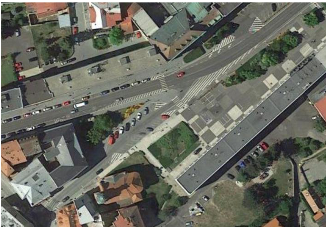
Obr. 22: Letecký snímek Náměstí Míru (URL 4)

Fontány jsou na podobných náměstích výborným prostředkem pro hospodaření s dešťovou vodou. Ačkoliv koryto fontány by mohlo být větší, dešťová voda se zde zachycuje, a to i v případě, kdy není fontána v provozu.