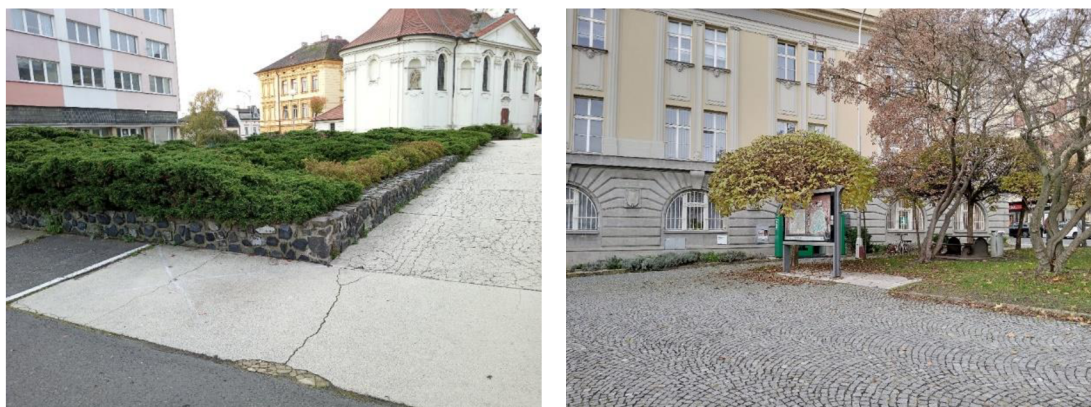
Obr. 17 a 18: Flora na Náměstí Miru (Autor, 2023)

Uprostřed jedné z travnatých ploch je umístěna fontána, která je připojena na uzavřený vodní okruh, který je regulován z přílehlého Infocentra. Koryto fontány není příliš velké, nicméně se v něm zachycuje určité množství dešťové vody. Fontána je v provozu pouze přes den, po 22 hodině je vypínána, což umožňuje například ptactvu využít tuto stojatou vodu jako napajedlo (První boleslavská s.r.o., 2018).