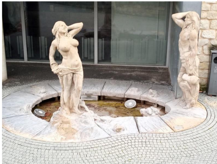
Obr. 9: Vodní kašna u Staroměstského náměstí

V blízkosti náměstí je vystavěna vodní kašna, která zadržuje dešťovou vodu přímo v místě spadu. Tato kašna je umístěna v rovině komunikace, tudíž část vody, která při dešti dopadá na komunikaci, odtéká do této kašny.