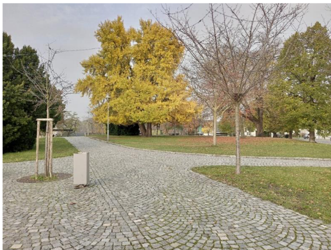
Obr. 13: Komenského náměstí (Autor, 2023)

Součástí Komenského náměstí je i parkoviště, které je od náměstí opticky odděleno silnicí. Povrchová úprava parkoviště je řešena betonem, který neumožňuje vsakování dešťové vody. Veškerá voda z této části náměstí je svedena do kanalizace bez dalšího využití. Parkoviště je obklopeno rostlinami a keři, které jsou umístěny v úrovni chodníku, nicméně jsou osázeny obrubníky. Rostliny tak využívají pouze dešťovou vodu, která spadá přímo do jejich okolí. Obrubníky znemožňují svod dešťové vody z chodníků a silnic k rostlinám, kde by tato voda mohla sloužit jako závlaha.