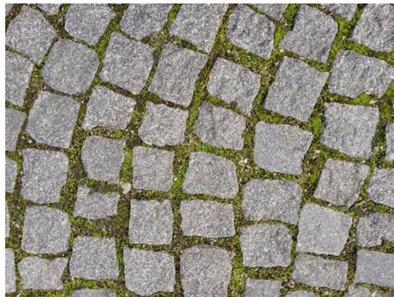
Obr. 12: Kamenná dlažba na Komenského náměstí (Autor, 2023)

Jelikož se jedná o parkové náměstí, je zde v hojné míře zastoupen travnatý porost. Chodníky jsou zde řešeny pomocí kamenné dlažby s širší spárou, čímž jsou zde vytvořeny dobré podmínky pro vsakování dešťové vody.