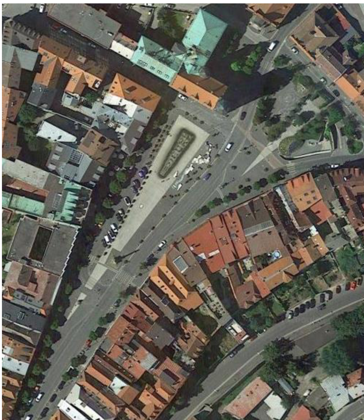
Obr. 20: Letecký snímek Staroměstského náměstí (URL 2)

Vsakování dešťové vody je zde podpořeno vysázenými vzrostlými stromy, které pojmu dešťovou vodu jak v místě spadu, tak stékající vodu z okolní komunikace. Za negativní lze považovat velikost propustné plochy v okolí stromů. Tato plocha je velmi malá, a tak množství vsáknuté vody nestačí ani jako závlaha pro tyto stromy. Vhodnějším řešením by bylo nechat větší propustnou plochu v okolí stromů a namísto kamenné dlažby instalovat v jejich okolí zatravněvací tvárnice či mříž pro okolí stromů. Výhodou zmíněné mříže je i možnost instalování laviček pro odpočinek. Betonové květníky s rostlinami jsou vhodně zvolenou úpravou právě pro podobná náměstí. Dodávají místu estetickou hodnotu a zároveň pohlcují dešťovou vodu, která tak nemusí odtékat z místa pryč. V tomto případě by bylo vhodnější umístit květníky do úrovně komunikace, aby měly možnost pojmout i dešťovou vodu z okolí. Této situaci by příznivě nahrával i fakt, že Staroměstské náměstí je situováno v mírném sklonu a dešťová voda, která se nevsákne skrz kamennou dlažbu, stéká po náměstí pryč.