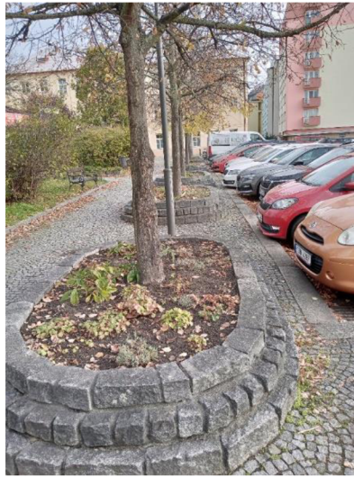
Obr. 15: Stromy na Komenského náměstí

a nestačí se vsakovat skrze spáry kamenné dlažby. Dešťová voda je tak rovněž odváděna do kanalizace.