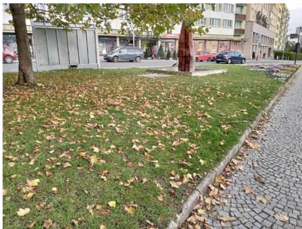
Obr. 19: Fontána na Náměstí Miru

Uprostřed jedné z travnatých ploch je umístěna fontána, která je připojena na uzavřený vodní okruh, který je regulován z přílehlého Infocentra. Koryto fontány není příliš velké, nicméně se v něm zachycuje určité množství dešťové vody. Fontána je v provozu pouze přes den, po 22 hodině je vypínána, což umožňuje například ptactvu využít tuto stojatou vodu jako napajedlo (První boleslavská s.r.o., 2018).