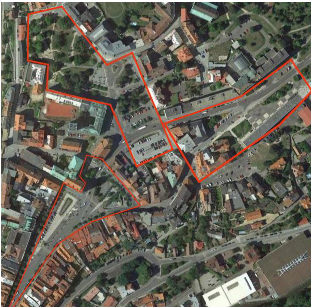
Obr. 4: Letecký snímek tří vybraných náměstí v Mladé Boleslavi (URL 1)

specifických parkových zásahů (estetika, exotické dřeviny, kultivary atd.) a postupné obnovy lesoparku (Kupec et al., 2022).