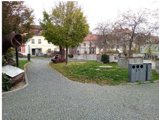
Obr. 11: Travnatá plocha na Staroměstském náměstí

V horní části Staroměstského náměstí se nachází travnaté plochy spolu se vzrostlými stromy a keři. Komunikace je zde řešena rovněž kamennou dlažbou, jako na zbytku náměstí. V rámci celého náměstí se jedná o plochu, kde je nejvíce využívána dešťová voda, neboť se zde vsakuje právě přes travnaté plochy do půdy, která je tak přirozeně zavlažována. Menší vsakování dešťové vody je zde umožněno taktéž skrz kamennou dlažbu.