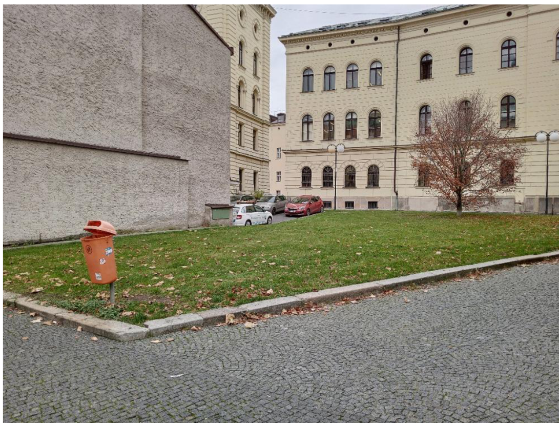
Obr. 23: Travnatá plocha u Staroměstského náměstí

Pokud by se město rozhodlo využít plochu jiným způsobem, prioritně by bylo vhodné vystavět na místě akumulční nádrž. Jedná se o technický objekt, který umožňuje zadržet dešťovou vodu a následně ji využít na zálivku vegetace či na kropení zpevněných povrchů. Tímto by došlo ke kýženému snížení nákladů na vodu potřebnou pro zálivku v letní sezóně (Sýkorová et al., 2021).