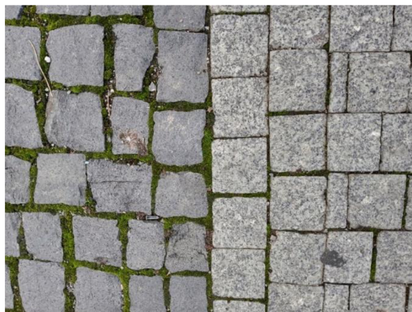
Obr. 5: Kamenná dlažba na Staroměstském náměstí (Autor, 2023)

Toto náměstí, jakožto typické zpevněné náměstí s historickým kontextem, nenabízí moc možností pro hospodaření s dešťovou vodou. Nakládání s vodami je upraveno Zákonem o vodách č. 254/2001 Sb., tzv. vodním zákonem (Magistrát města Mladá Boleslav, 2023). Na náměstí je v markantní většině použita kamenná dlažba, která skrz spáry umožňuje vsakování dešťové vody do podloží.