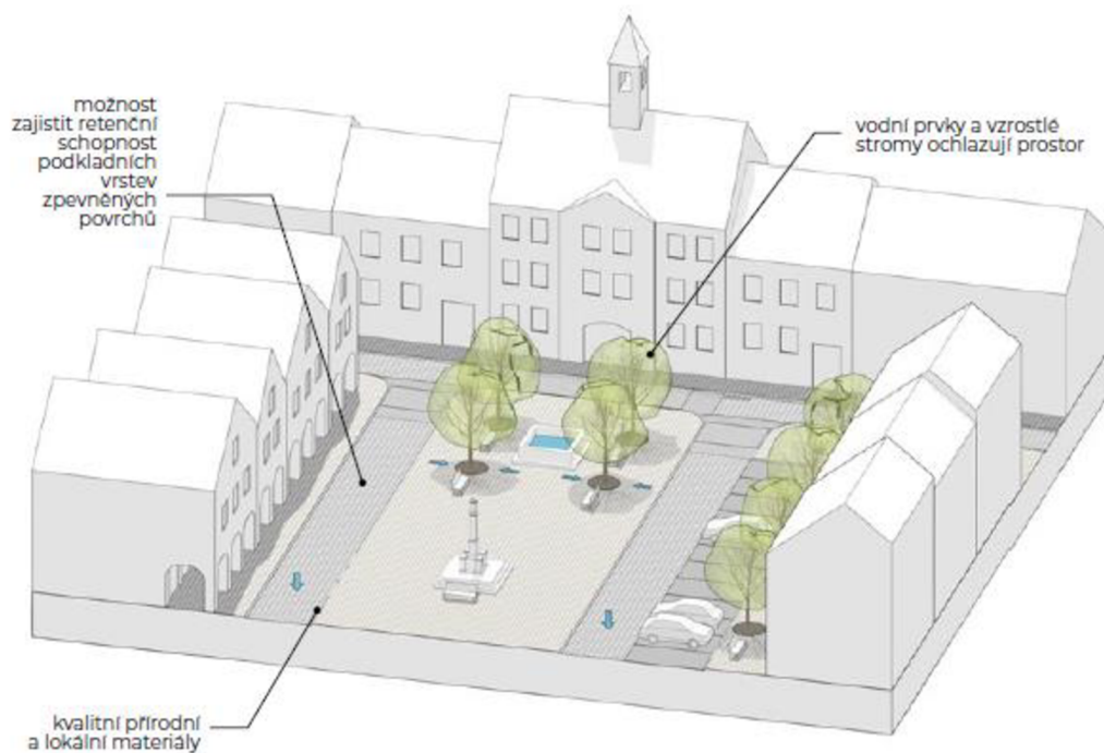
Obr. 2: Zpevněná náměstí (Sýkorová et al., 2021)