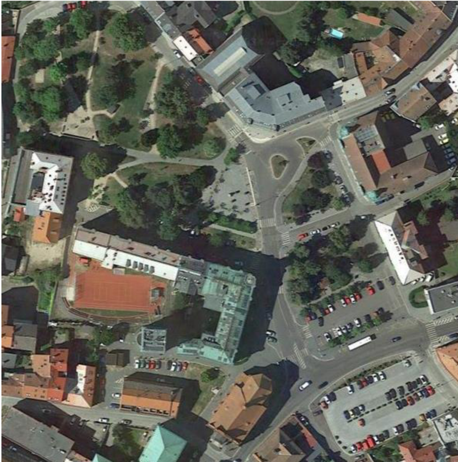
Obr. 21: Letecký snímek Komenského náměstí (URL 3)