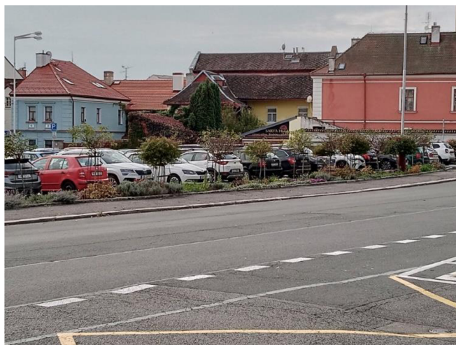
Obr. 14: Parkoviště na Komenského náměstí

Součástí Komenského náměstí je i parkoviště, které je od náměstí opticky odděleno silnicí. Povrchová úprava parkoviště je řešena betonem, který neumožňuje vsakování dešťové vody. Veškerá voda z této části náměstí je svedena do kanalizace bez dalšího využití. Parkoviště je obklopeno rostlinami a keři, které jsou umístěny v úrovni chodníku, nicméně jsou osázeny obrubníky. Rostliny tak využívají pouze dešťovou vodu, která spadá přímo do jejich okolí. Obrubníky znemožňují svod dešťové vody z chodníků a silnic k rostlinám, kde by tato voda mohla sloužit jako závlaha.