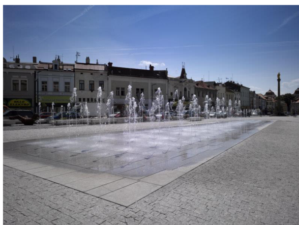
Obr. 8: Fontána na Staroměstském náměstí (Stavba roku, 2011)

Vedle vodní kaskády je umístěna fontána tryskající vodu do výšky přímo z dlažby na náměstí. Voda, která z této fontány tryská je rovněž svedena z potoka a v rámci hospodaření s dešťovou vodou tak není nijak využívána (Magistrát města Mladá Boleslav, 2023).