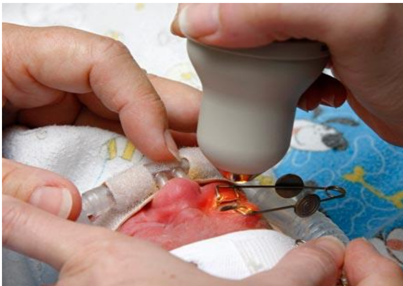
Obrázek 2: Vyšetření pomocí RetCam 3 [23]

V zemích s nízkými příjmy, neadekvátním lékařským vybavením a nedostatkem personálu, jsou časté screeningové vyšetření ROP velmi náročné a často nereálné. V těchto případech je možným řešením stále se vyvíjející telemedicína. Telemedicína využívá vzdálenou interpretaci digitálního zobrazení fundu a nabízí tak lepší lékařskou službu i v odlehlých regionech. Konečná kvalita a řešení situace však závisí na místních podmínkách. V posledních letech se díky snímkům z digitální kamery RetCam staly dostupné četné datové soubory. Díky těmto databázím lze síťové obrazy efektivně analyzovat pomocí umělé inteligence, která je schopna rozpoznat patologické stavy onemocnění sítnice. Původně byly tyto systémy využívány také při screeningu diabetické retinopatie. Umělá inteligence vytvořila skóre závažnosti ROP, které odpovídá klasifikaci onemocnění dle studie ICROP a má velký potenciál pro kvantitativní monitorování, zlepšení prevence, léčby a následné recidivy po terapii. Může také včas detekovat závažné stupně ROP před rozvojem odchlípení sítnice. Při potvrzení aktivity ROP vždy následuje kontrola nepřímou oftalmoskopií odborníkem. Tradiční způsob vyšetření tedy zatím nelze plně nahradit digitálními systémy, jelikož senzitivita přístrojů závisí také na kvalitě pořízených snímků. [21, 22]