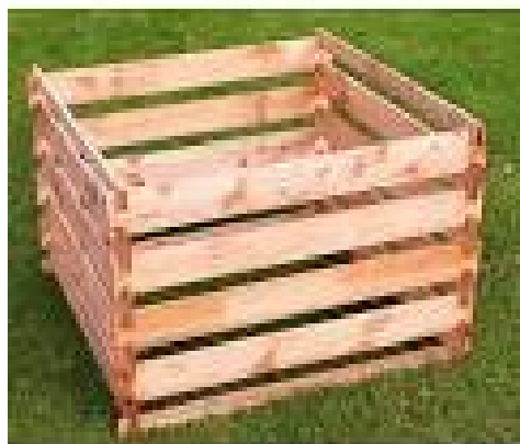
Obrázek č. 12,13 – Ukázka kompostéru