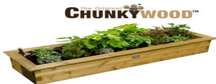
Obrázek č.11 - Mobilní pěstování: vyvýšený záhon s poličkou