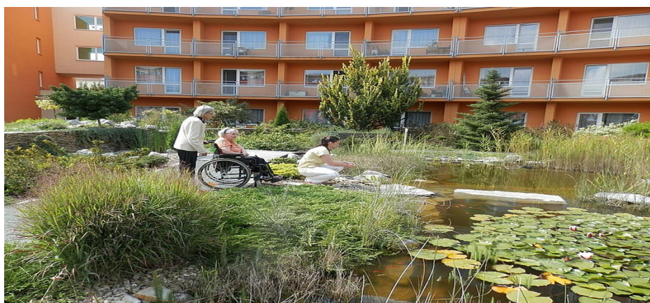
Obrázek č. 6 - Relaxační stezka