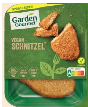
Obrázek 8- Garden Gourmet veganský řízek, Nestlé

Hodnocení: Dvě hlavní složky produktu jsou voda a strouhanka, kvůli tomu nelze výrobek hodnotit z pohledu nutričního významu pozitivně. Navíc obsahuje dost přídavných látek a dochucovadel. Mimo již zmíněné methylcelulózy se zde objevuje guma guar, rozpustná vláknina používaná jako stabilizátor, zahušťovadlo nebo emulgátor. Pozitivní je použití sójové bílkoviny jako zdroje proteinu a řepkového a slunečnicového oleje jako zdroje tuku.