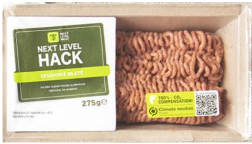
Obrázek 18- Next level hack veganské mleté, Next level meat