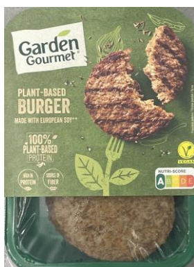
Obrázek 15- Garden Gourmet Veganský burger, Nestlé

Hodnocení: Oproti Beyond Meat burgeru má tento burger významně nižší energetickou hodnotu, obsahuje výrazně menší obsah tuku, nasycených mastných kyselin a přídavných látek. Kladně lze hodnotit použití přírodních dochucovadel a obsah směsi pšeničné a sójové bílkoviny a řepkového a slunečnicového oleje.