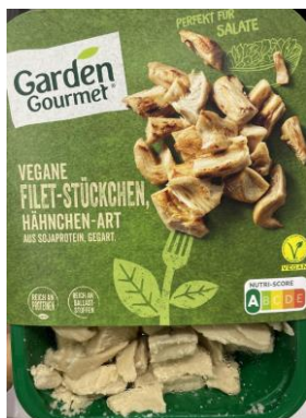
Obrázek 13- Garden Gourmet Veggie nudličky, Nestlé

značky Pan Hrášek, hlavní rozdíl spočívá v odlišném druhu rostlinné bílkoviny, jinak jsou výrobky složením téměř totožné.