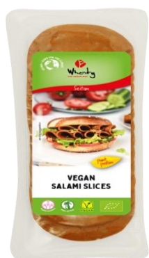
Obrázek 20- Salám plátky vegan 100g BIO, Wheaty (zdroj: web výrobce Wheaty)

Hodnocení: Pšeničný “salám” je velmi bohatým zdrojem bílkovin díky vysokému obsahu pšeničného proteinu, ale nedá se považovat za plnohodnotný zdroj. Obsahuje poměrně vysoký obsah tuku ze slunečnicového oleje, výhoda je nulový obsah nasycených mastných kyselin. V českém popisku produktu je obsažen “vysokohlinitanový slunečnicový olej”, podle původního složení v anglickém jazyce se jedná o High Oleic Sunflower Oil, tedy slunečnicový olej s vysokým podílem kyseliny olejové. Tento typ oleje je vhodný díky své vyšší teplotní a oxidační rezistenci. Oproti hrachovému “salámu” značky Well Well neobsahuje zahušťovadla, pravděpodobně kvůli tomu, že seitan má lepivou a pevnou strukturu sám o sobě.