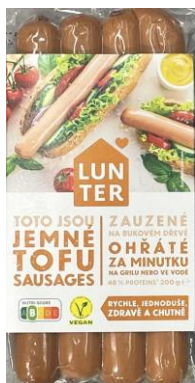
Obrázek 9- Tofu párky jemné, Lunter

Hodnocení: Díky obsahu tofu, hrachové bílkoviny a slunečnicové bílkoviny je výrobek zdrojem plnohodnotných bílkovin. Obsahuje ale i poměrně dost tuku, kladně lze hodnotit použití řepkového oleje a pouze malé množství nasycených mastných kyselin. Ve výrobku se vyskytuje poměrně velký obsah ochucovadel a koření, jedná se ovšem především o koření a přírodní ochucovadla zdraví nezávadná.