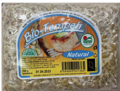
Obrázek 5- Bio-Tempeh natural, Sunfood

Hodnocení: Výhoda tempehu je vysoký obsah kvalitní sójové bílkoviny a proces fermentace, které je výrobek vystaven. Ta podpoří biodostupnost bílkovin, minerálních látek a vitaminů, naopak snižuje aktivitu antinutričních látek. Opět se jedná o tempeh natural, který neobsahuje žádné další přidané tuky a aditiva, tato verze tempehu je co se týče výživových hodnot nejvhodnější.