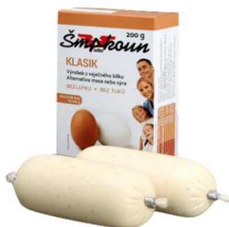
Obrázek 1- Šmakoun klasik (zdroj web výrobce Šmakoun)

Hodnocení: Výhodou produktu je oproti ostatním masovým náhražkám obsah mléčných plnohodnotných bílkovin. Hodí se i do redukčních diet díky nízkému obsahu energie. Oproti mnoha jiným masovým náhražkám neobsahuje téměř žádný tuk. Šmakoun obsahuje i malé množství vlákniny díky jitrocelové vláknině, která se nazývá také psyllium. Výhodou je, že neobsahuje žádné chemické přídavné látky a konzervanty.