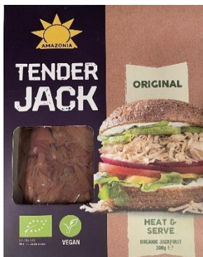
Obrázek 19- Tender Jack Original, Amazonia

Hodnocení: Jak je zmíněno v teoretické části, jackfruit, neboli chlebovník, je ovoce a jako náhražka masa se využívá díky své konzistenci podobné trhanému masu. Energetické hodnoty se masu ani jiným masovým výrobkům nepodobají, jackfruit neobsahuje téměř žádné bílkoviny ani tuk.