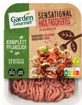
Obrázek 17-Garden Gourmet Sensational Mleté, Nestlé

nasyčených tuků, kvůli obsahu kokosového oleje. Jako stabilizátor obsahuje methylcelulózu, stejně jako produkt VegiSteak kukuřízek. K dochucení jsou použity přírodní zdroje a jako barviva koncentráty z ovoce a zeleniny.