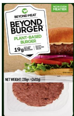
Obrázek 14- The Beyond Burger, Beyond Meat