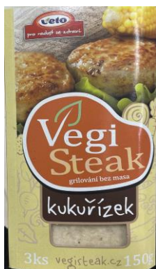
Obrázek 7- Kukuřízek, Veto