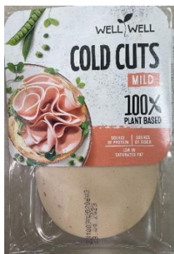
Obrázek 10 - Salám hrachový klasik, Well Well

Hodnocení: Výrobek nemá vysokou nutriční hodnotu, vysoký podíl složení tvoří voda, malé množství bílkovin a olej. Navíc obsahuje mnoho přídavných látek, aby bylo dosaženo struktury a vzhledu salámu. Hrachová bílkovina je kvalitní zdroj proteinu, ale v hrachovém salámu je ho obsaženo pouze malé množství.