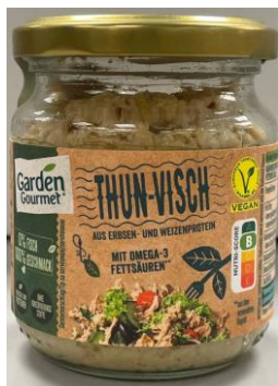
Obrázek 16- Garden Gourmet Vuňák, Nestlé

Hodnocení: Hlavní složkou této rostlinné napodobeniny tuňáka je směs bílkovin a řepkový olej. Tuňák je prospěšný především díky obsahu omega 3 polyenových mastných kyselin, vitaminů D, E, A a B a minerálních látek, především železo, fosfor, hořčík, zinek, draslík, jód a selen. Tyto benefity rostlinná verze nemá, i když může být také zdrojem omega-3 díky vysokému obsahu řepkového oleje.