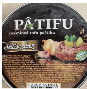
Obrázek 11- Patifu prémiová tofu paštika delikates, Veto

Hodnocení: Rostlinná “paštika” obsahuje jako hlavní bílkovinu sóju v podobě tofu, která by se dala považovat jako plnohodnotný zdroj bílkovin. Ve výrobku však není sóji veliký podíl a výsledný obsah bílkovin není vysoký. Kladně se dá hodnotit použití pouze přírodních dochucovadel a oproti klasické paštice se jedná o zdroj nenasycených mastných kyselina a není tak bohatá na energii.