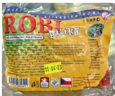
Obrázek 4- Robi plátky, Eurobi s. r. o.

Hodnocení: Robi maso je další alternativa na bázi obilovin, je vhodná pro osoby s alergií na sóju. Výhodou je malé množství tuku a vysoké množství bílkovin, které ale nejsou plnohodnotné a ideální je pokrm doplnit o další zdroj proteinu. Mají nízkou energetickou hodnotu, jako ostatní rostlinné náhražky neobsahuje cholesterol.