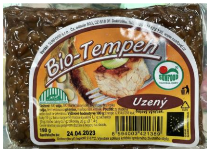
Obrázek 6- Bio-Tempeh uzený, Sunfood