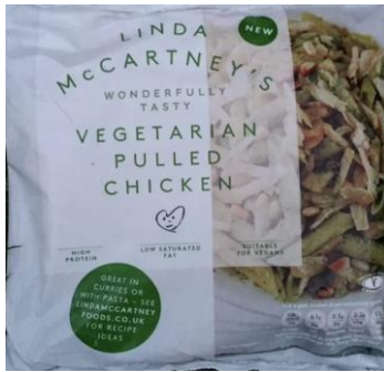
Obrázek 21- Vegetarian Pulled Chicken, Linda McCartney's