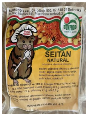
Obrázek 3- Seitan natural, Sunfood