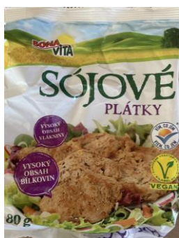
Obrázek 2- Sójové plátky, BonaVita

Hodnocení: Extrudované sójové maso se na trhu objevuje v mnoha dalších variantách, jako jsou nudličky, kostky nebo granulát. Liší se pouze tvarem, složení zůstává stejné, obsahují pouze sójovou mouku. Obsahuje velké množství bílkovin a málo tuku. Sójové maso se musí nejprve povařit ve vodě nebo vývaru, následně popřípadě opéct na oleji s kořením. Záleží tedy i na konzumentovi, jak bude se sójovým masem pracovat a kolik oleje a dochucovadel použije během přípravy.