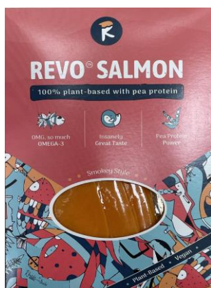
Obrázek 22- Rostlinný uzený losos, Revo™

Hodnocení: Náhrada lososa založena na hrachové bílkovině. Obsahuje velké množství vody a množství bílkovin v produktu je velmi nízké. Zároveň jsou použity přídatné látky pro lepší texturu. Kalciumalginát, neboli alginát vápenatý E404 se získává z hnědých řas a používá se jako stabilizátor, zahušťovadlo a želírující látka. Ve větším množství se váže na stopové prvky a zhoršovat vstřebatelnost živin (Fér potravina, E404). Zahušťovadla karagenan a konjak již byly zmíněny v jiných produktech. Velmi kladně lze hodnotit přidání vitaminů B 12 a D 2 , které losos a jiné ryby obsahují a celkově jich mají lidé na vegetariánské stravě nedostatek. Dle výrobce je výrobek bohatým zdrojem omega-3 polyenových mastných kyselin. Zdrojem může být právě výtažek z řas a kombinace řepkového a lněného oleje.