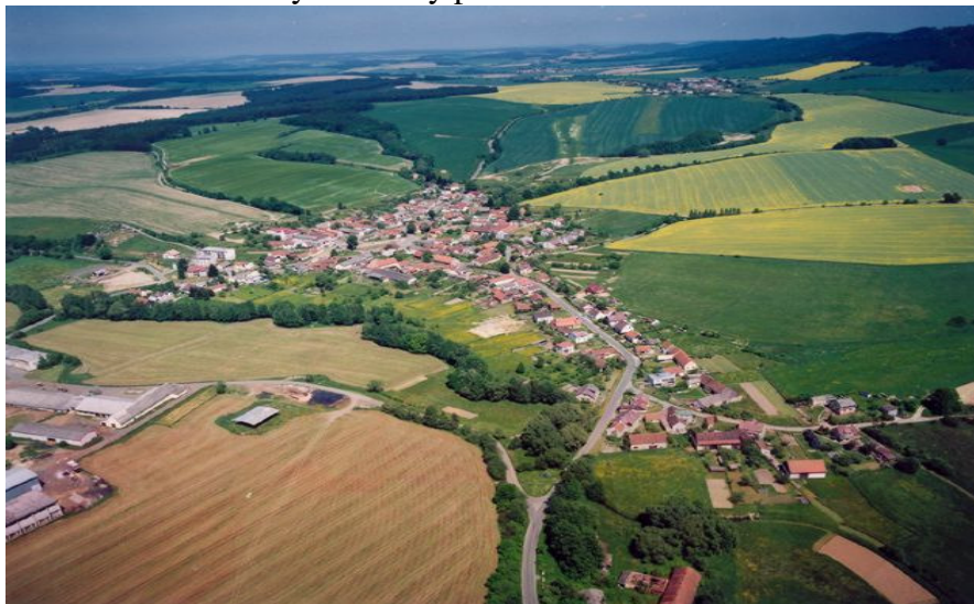
Obrázek č. 1: Zahořany – letecký pohled