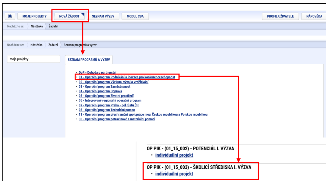
Obr. 1: Založení žádosti v programu podpory Školící střediska - I. Výzva v rámci OP PIK, zdroj: IS KP14+.

Podle výše zmíněného manuálu jsem po dostatečném zmapování portálu přistoupila ke založení nové žádosti a díky tomu získala přístup k potřebným dokumentům, které je pro zpracování předběžné žádosti potřeba. Jednalo se o formuláře Finanční výkaz, Prohlášení k podpoře de minimis, Prohlášení k definici malého a středního podnikatele.