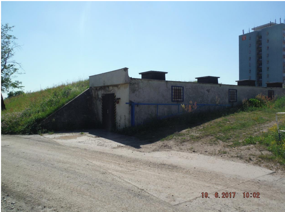
Příloha č. 2a – Původní stav AK1 venkovní pohled