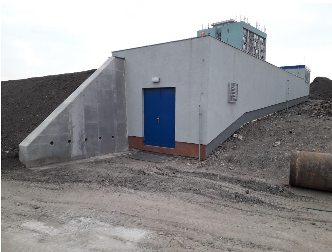
Příloha č. 10a – Nový stav AK1 venkovní pohled