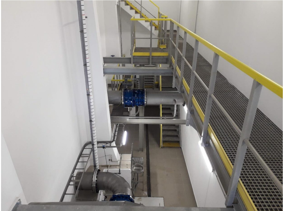
Příloha č. 10b – Nová stav AK1 vnitřní pohled