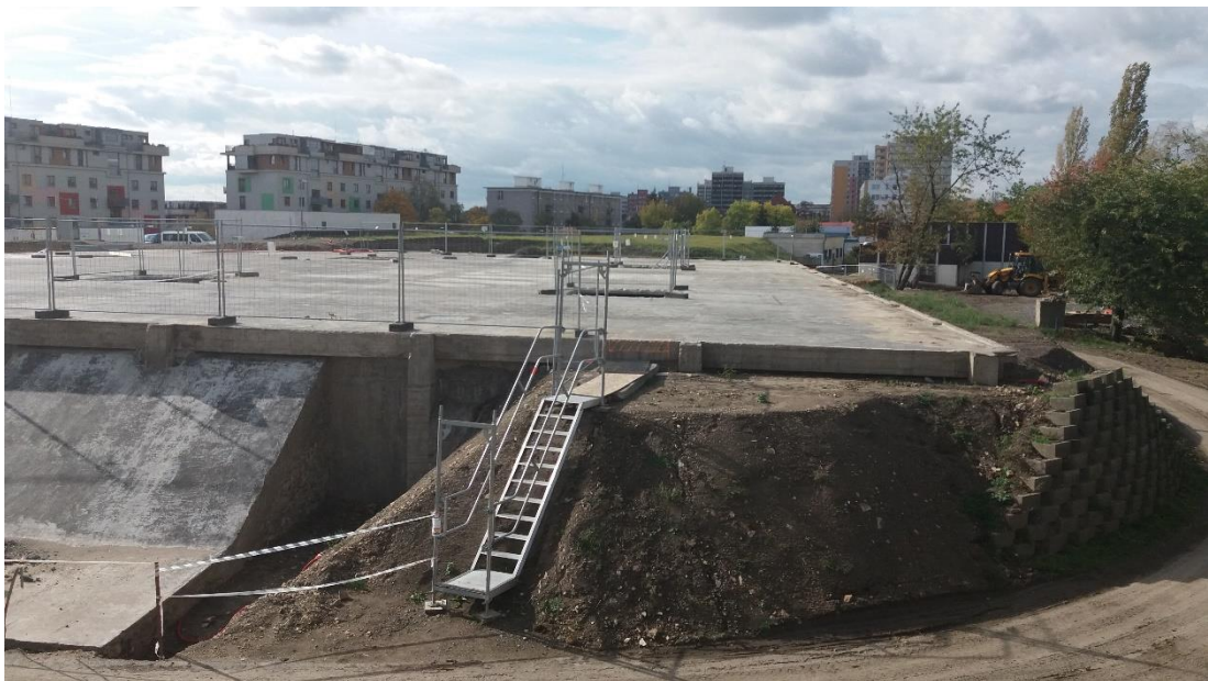
Příloha č. 4 – Pohled na odkrytou konstrukci nádrže