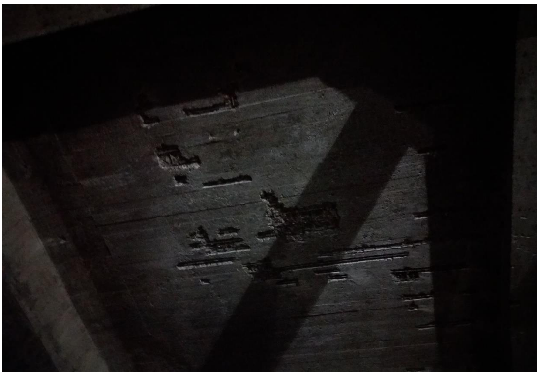
Příloha č. 5 – Místa na stropní konstrukci s odstraněným zdegradovaným betonem