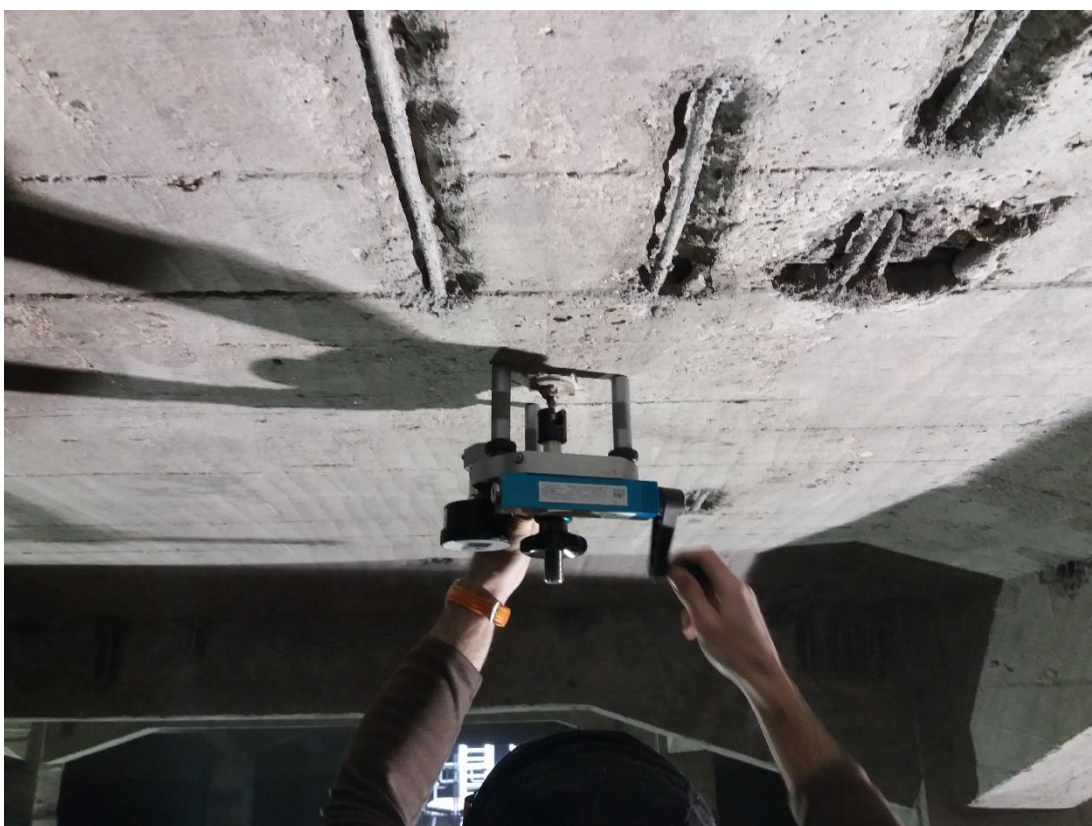
Příloha č. 6 – Postup odtrhové zkoušky