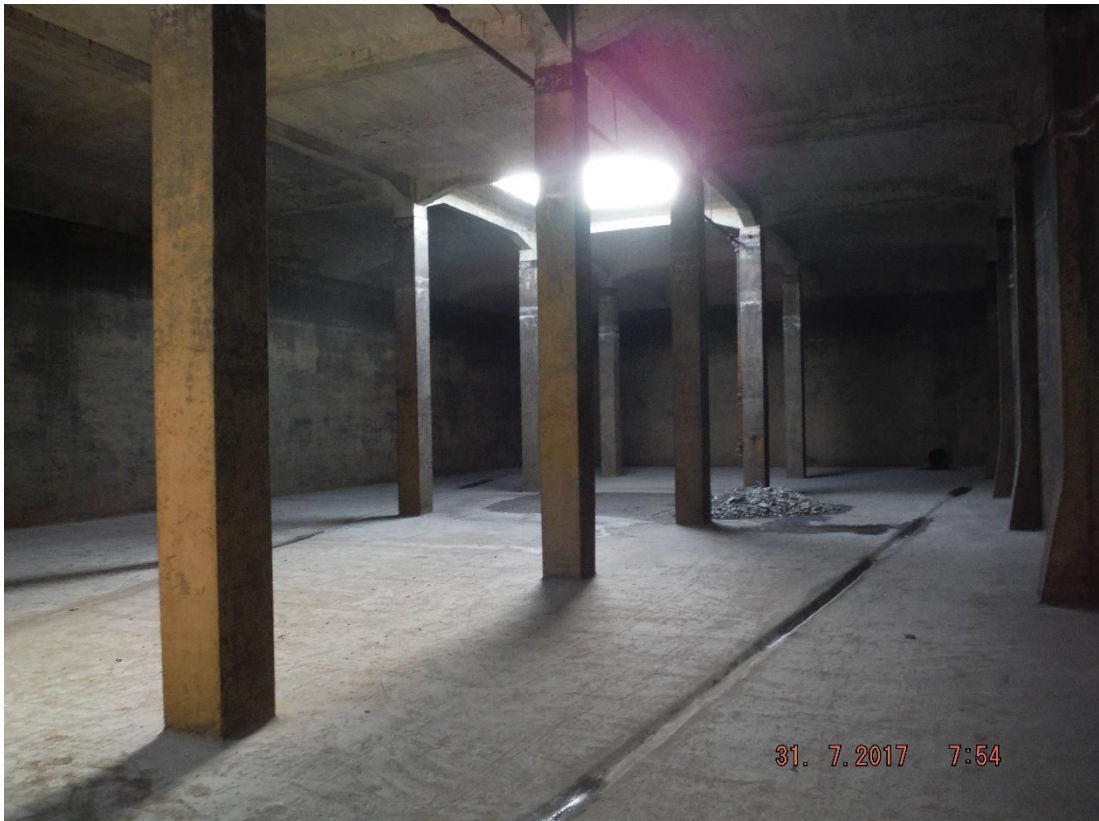
Příloha č. 3 – Pohled do vypuštěné akumulční nádrže (původní stav)