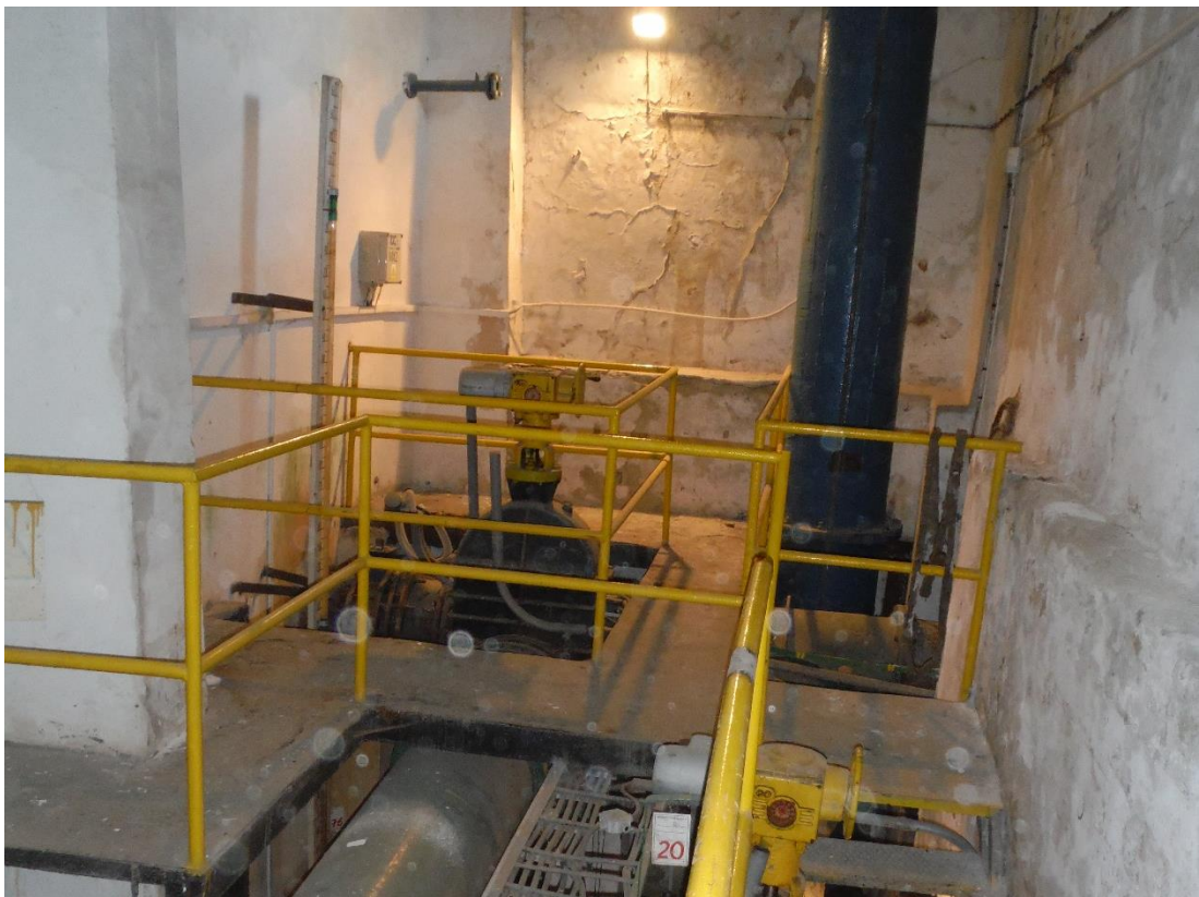
Příloha č. 2b – Původní stav AK1 vnitřní pohled