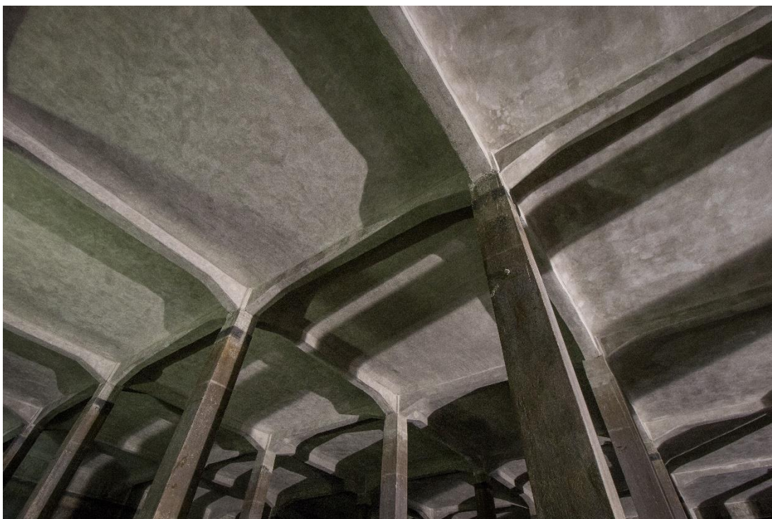
Příloha č. 7 – Nový stav stropní konstrukce