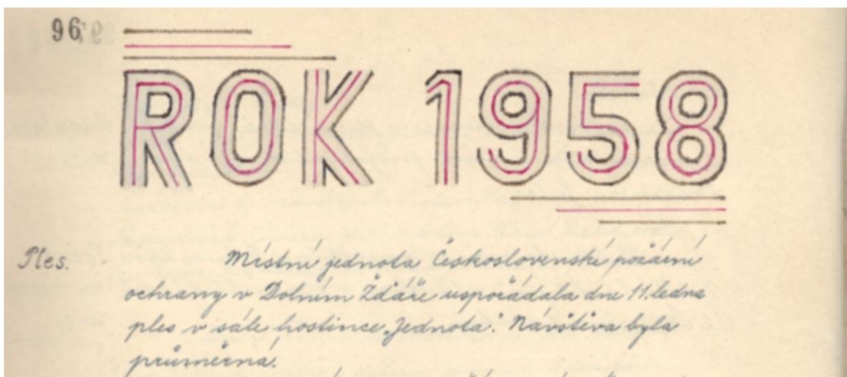
Příloha č. 10 Zápisy z Kroniky obce Dolní Žďár 1939-1992 - rok 1958