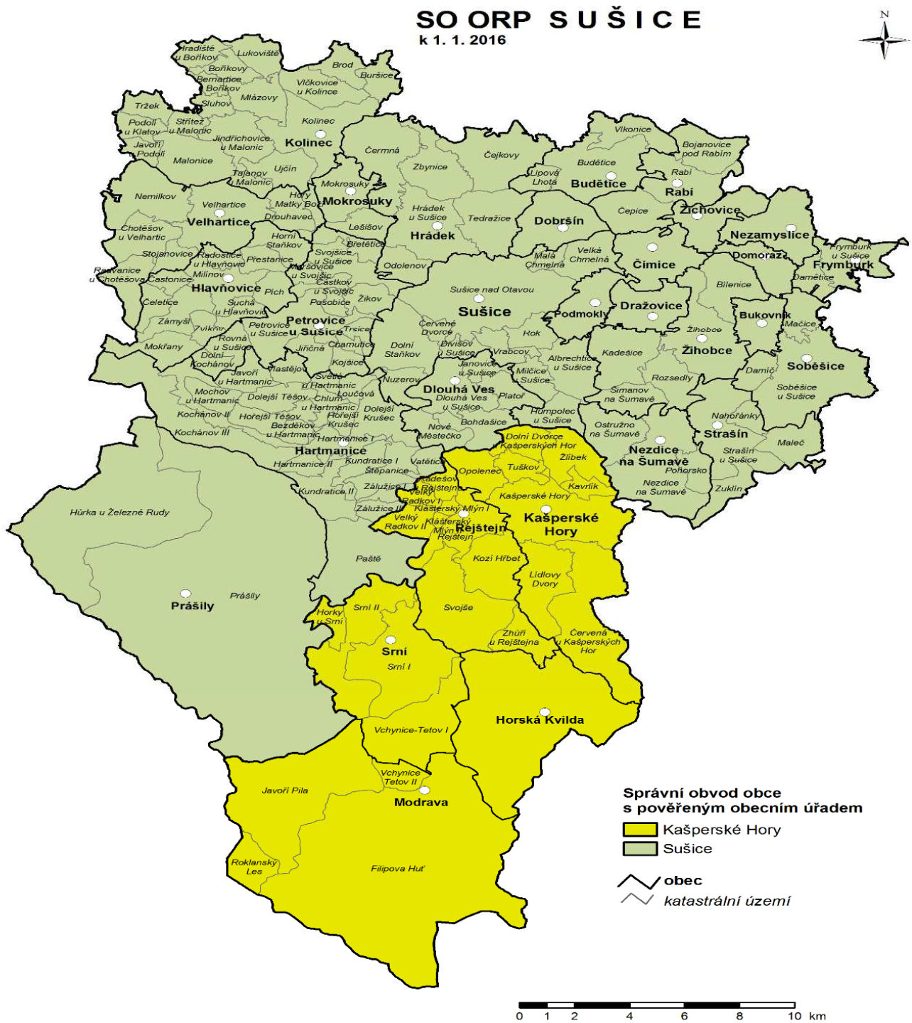
Obrázek 2: SO ORP Sušice